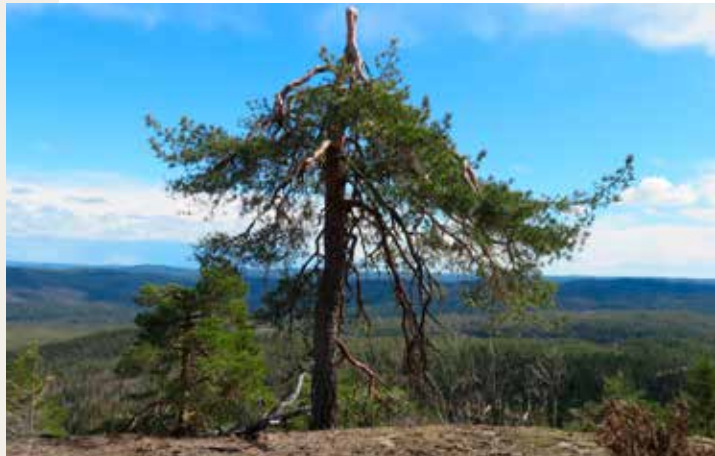
På toppen av Bjynnustadfjellet

Område: Valle/Digerdal Møtested: Bomveg: vipps/mynt. Frammøte ved Valle/Uvdalsvegen. Tid: 11:00 Timer: 3,5 Kilometer: 5,5 Arrangør: Dagsturgruppa i Havrefjell Turlag Naturlos: Kåre Dalane Kontaktperson: Kåre Dalane Tlf.: 474 76 146 Påmelding: Ingen påmelding Pris: Gratis