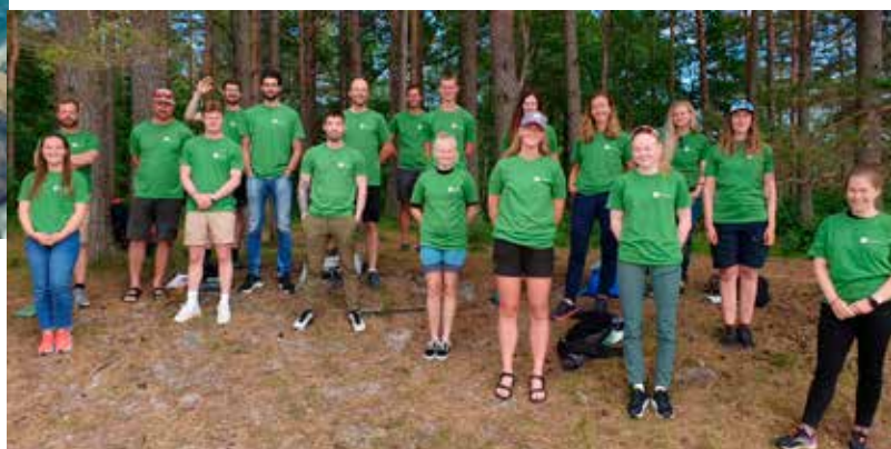
Friluftsrådet Sørs ansatte og friluftsskoledere 2021

Marka Friluft er et gratis fritidstilbud for alle ungdommer i 7.-10. klasse i Arendal Kommune. Les mer om Marka på www.friluft-sor.no/fritid/markafriluft og følg oss på Facebook og Instagram!