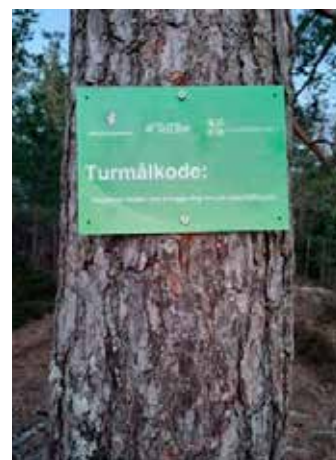
TellTurskilt med turmålkode