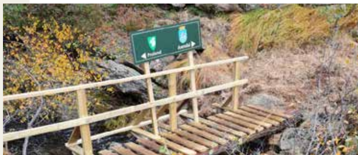
På stien til Høgesteinsheia