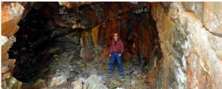
Inni Nikkelgruva ved Svartekjenn

Område: Blakstad - Messel Møtested: Kjerringhuset, Messel Tid: 11:00 Timer: 3 Kilometer: 4 Arrangør: Froland historielag Naturlos: Svein Edmund Kristiansen Tlf.: 913 79 628