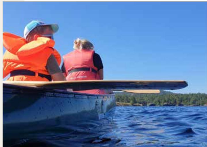
Kanutur på Skarvann