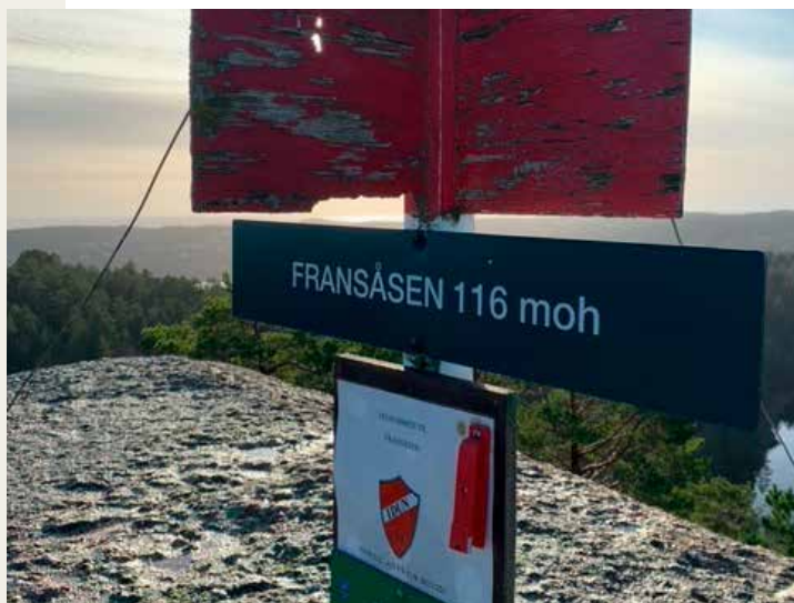
Fransåsen i Risør