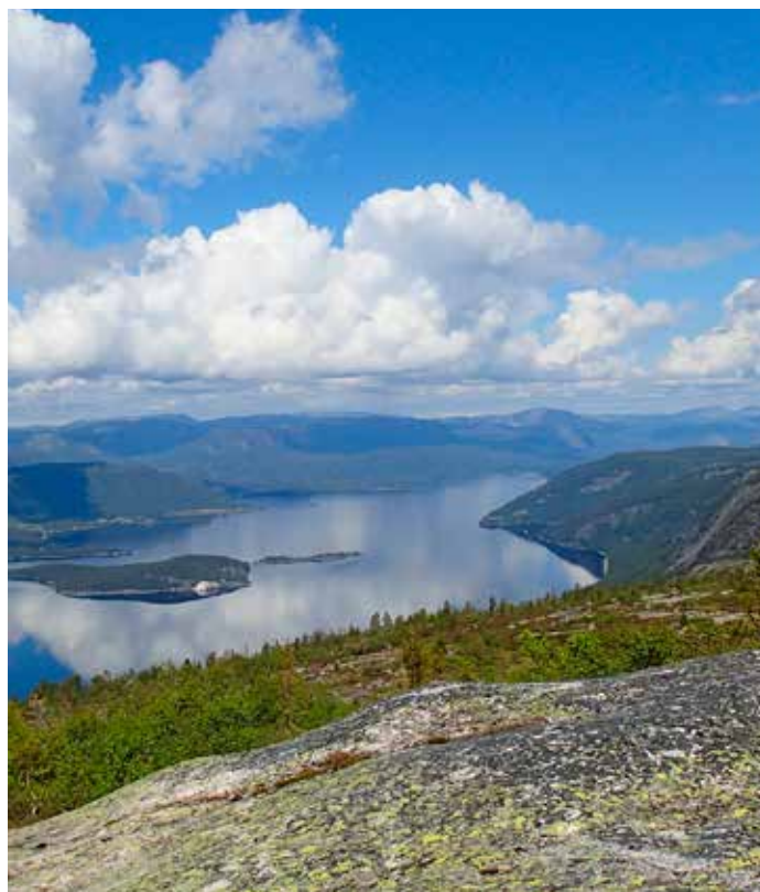
Utsikt over Nisser fra TellTurmålet Hjasufsknatten