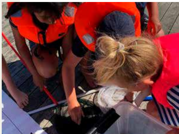
Livet i fjæra