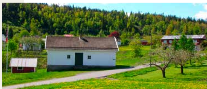
Gjerstadmarsjen fra Løite Skule

Område: Gjerstad Møtested: Løite skule Tid: 11:00 Arrangør: Havrefjell Turlag og Gjerstad IL Naturlos: Astrid H. Bråten Kontaktperson: Astrid H. Bråten Tlf.: 413 38 602 Påmelding: Annonseres Pris: Annonseres