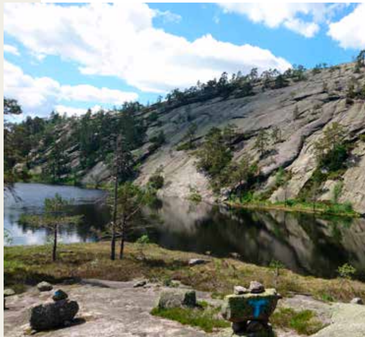
Bergtjønn, Velausfjell i Nissedal

Område: Felle Møtested: Bomveg: vipps/mynt. Start frå Trælvatn. Frammøte ved butikken på Felle. Tid: 11:00 Timer: 3,5 Kilometer: 6 Arrangør: Dagsturgruppa i Havrefjell Turlag Naturlos: Tove Urfjell Kontaktperson: Tove Urfjell Tlf.: 400 38 188 Påmelding: Ingen påmelding Pris: Gratis