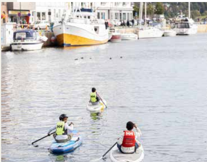
Padling i Pollen på Passion for Ocean-festivalen

Område: Kanalplassen og Pollen Møtested: Kanalplassen og Pollen Tid: 11:00 Timer: 5 Arrangør: Sjøsjukt og Friluftsrådet Sør Kontaktperson: Marthe Marie Ruud Tlf.: 466 60 922 Påmelding: Ingen påmelding Pris: Gratis