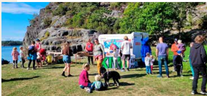
Kom deg ut Randvik