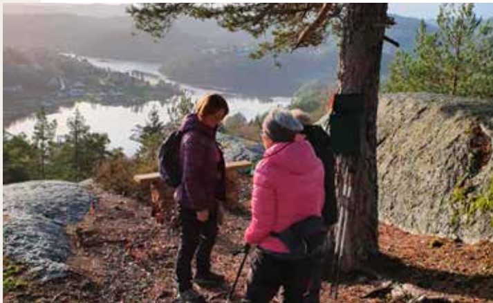
Utsyn frå Venliknuten i Risør