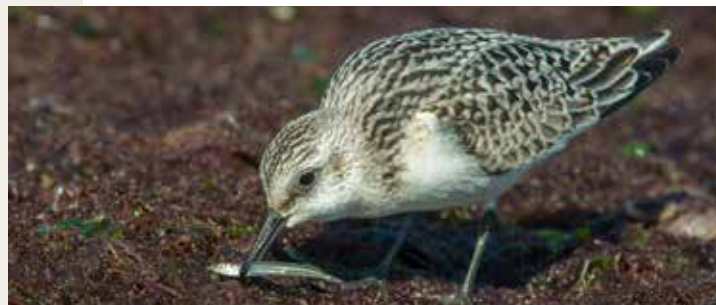
Fuglene vender tilbake