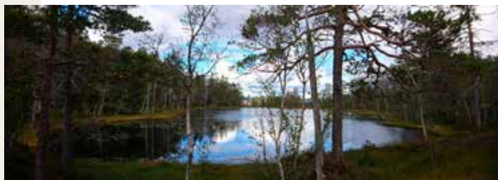
Tjenn 479 før Valefjell