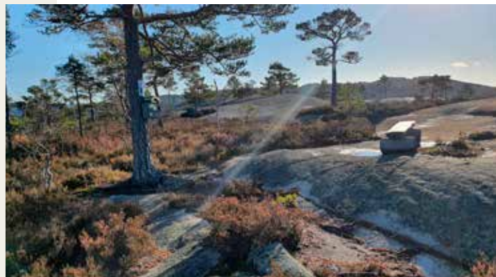
Toppen av Austnesheia