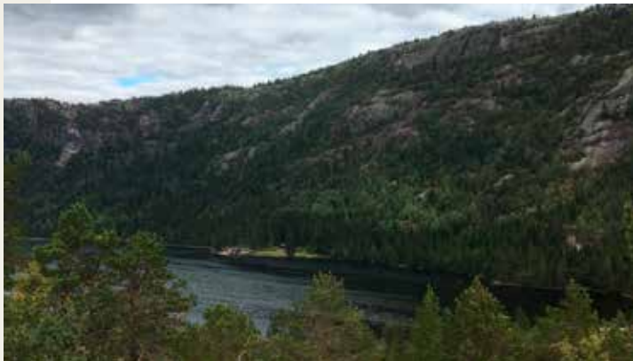
Skulhomfjell i Nissedal

Område: Treungen Møtested: Bomveg (Juvavegen) 14,7 km frå Øy mot Treungen. Tid: 11:00 Timer: 4,5 Kilometer: 9 Arrangør: Dagsturgruppa i Havrefjell Turlag Naturlos: Torhild Hagen Kontaktperson: Torhild Hagen Tlf.: 908 48 644 Påmelding: Ingen påmelding Pris: Gratis