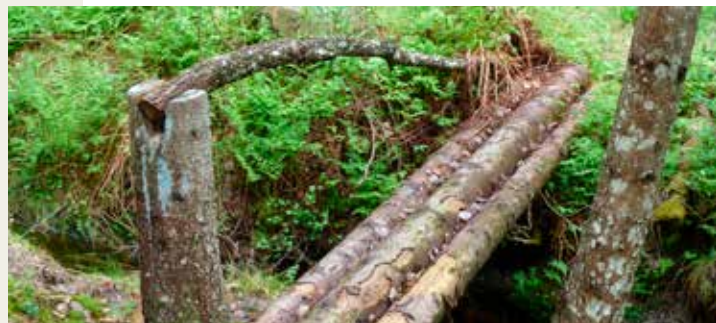
På stien til Røedsknuten

Område: Røed/Holte Møtested: P-plass ved Renstøl Tid: 11:00 Timer: 3,5 Kilometer: 6,5 Arrangør: Dagsturgruppa i Havrefjell Turlag Naturlos: Åse Øygarden Kontaktperson: Åse Øygarden Tlf.: 416 80 480 Påmelding: Ingen påmelding Pris: Gratis