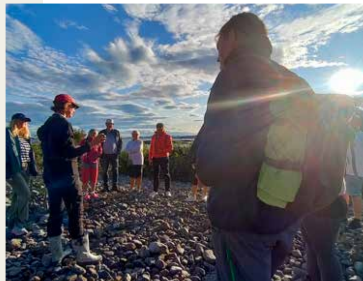
Geologi på Hove

Område: Hoveodden Møtested: Hoveodden parkeringsplass Tid: 17:00 Timer: 2 Kilometer: 3 Arrangør: Besøkscenter Raet nasjonalpark/Raet nasjonalpark Naturlos: Uavklart Kontaktperson: Trygve Norgaard Tlf.: 413 04 464 Påmelding: Ja, post@raetbesokssenter.no eller på facebook-event hos @visitraet Pris: Gratis