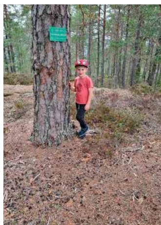
På TellTur i Froland

TELLTUR ER ET NASJONALT OPPLEGG. I ØSTRE AGDER OG NISSEDAL ER DET FRILUFTSRÅDET SØR SOM KOORDINERER TELLTUR-MÅLENE. PÅ NETTSIDEN WWW.TELLTUR.NO KAN DU LESE MER OM OPPLEGGET OG OPPRETTE BRUKERKONTO!