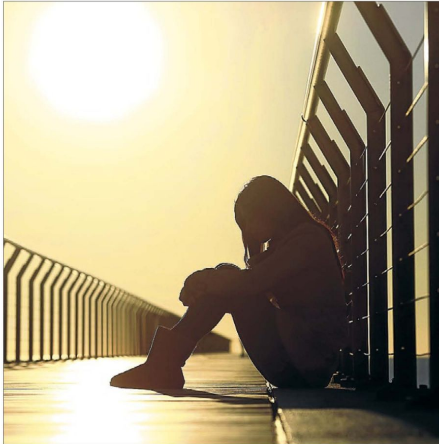
► Riesgo ► Adolescente adoptada con trastornos de conducta, pensativa en un puente de una gran ciudad.

Una de las quejas más insistentes de los nuevos progenitores es «lo solos y desorientados que están cuando los chavales entran en la adolescencia», señalan los exper-