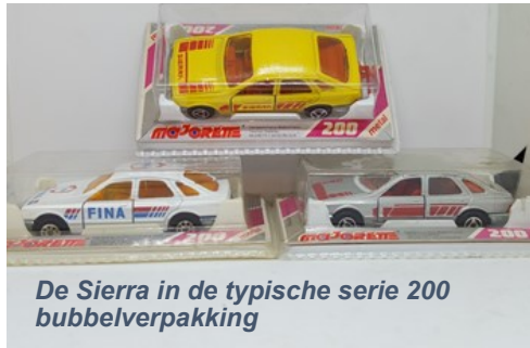
De Sierra in de typische serie 200 bubbilverpakking

De bumpers en de trekhaak waren geïntegreerd met de bodemplaat en dit was gemaakt uit diecast metaal en niet gespoten wat bij Majorette bij veel modelletjes gebruikelijk is.