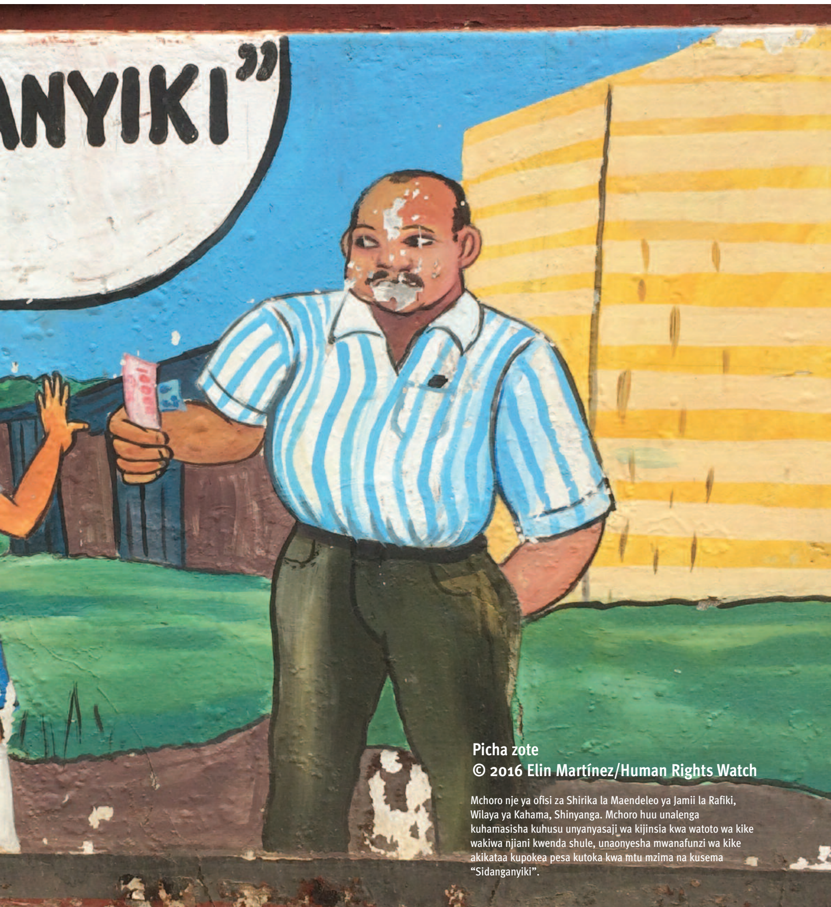
Picha zote © 2016 Elin Martínez/Human Rights Watch

Mchoro nje ya ofisi za Shirika la Maendeleo ya Jamii la Rafiki, Wilaya ya Kahama, Shinyanga. Mchoro huu unalenga kuhamasisha kuhusu unyanyasaji wa kijinsia kwa watoto wa kike wakiwa njiani kwenda shule, unaonyesha mwanafunzi wa kike akikataa kupokea pesa kutoka kwa mtu mzima na kusema "Sidanganyiki".