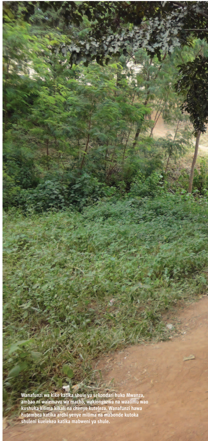
Wanafunzi wa kike katika shule ya sekondari huko Mwanza, ambao ni walemavu wa macho, wakiongozwa na waalimu wao kushuka kilima kikali na chenye kuteleza. Wanafunzi hawa hutembea katika ardhi yenye milima na mabonde kutoka shuleni kuelekea katika mabweni ya shule.