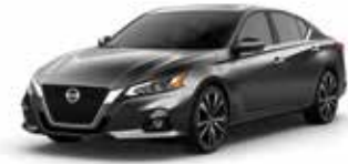
رمادي حديدي KAD Gun Metallic KAD