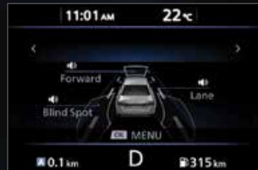
وسائل المساعدة على القيادة DRIVING AIDS