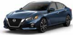
أزرق داكن RBD Dark Blue RBD