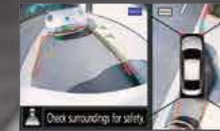
الرؤية الخلفية والعلوية REAR AND OVERHEAD VIEWS

تستخدم شاشة الرؤية الشاملة الذكية أربع كاميرات تمنحك رؤية افتراضية لما حولك من أعلى بزاوية قدرها 360 درجة. كما تتيح لك إمكانية تقسيم الشاشة لتقريب الرؤية من الأمام أو الخلف أو الجوانب حتى تحصل على صورة أوضح. كما يمكن لهذه الشاشة الذكية أن تعطيك تنبيهات مرئية على الشاشة عندما تستشعر أجساماً متحركة بالقرب من سيارتك، حتى وإن كانت عربة تسوق.