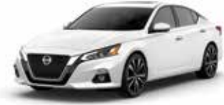
أبيض QAK Solid White QAK