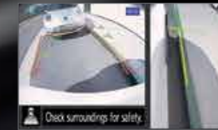
الرؤية الخلفية والجانبية REAR AND SIDE VIEWS