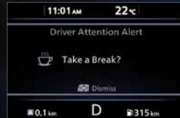
نظام التنبيه الذكي للسائق INTELLIGENT DRIVER ALERTNESS