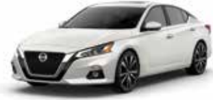
أبيض لؤلؤي QAB Pearl White QAB