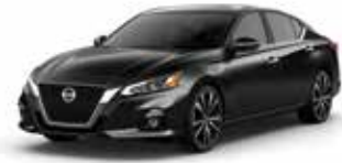
أسود KH3 Solid Black KH3