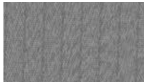
قماش خفيف متوفر على S & SV light cloth available on S & SV

الألوان الخارجية قابلة للتغيير تبعاً لمتطلبات السوق والدرجة المطلوبة. الرجاء استشارة وكيلك المحلي.