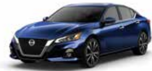
أزرق لؤلؤي RAY Pearl Blue RAY