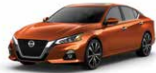
برتقالي EBL Orange EBL