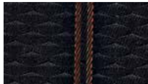
قماش أسود مع خياطة متوفر على فئة sport black cloth with stitching available on sport grade