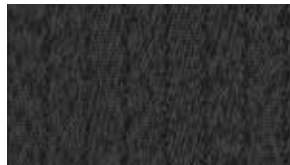
قماش أسود متوفر على S & SV black cloth available on S & SV