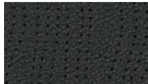
جلد أسود متوفر على SL black leather available on SL

حرصت نيسان على أن تكون نماذج الألوان المعروضة هنا أقرب ما يمكن إلى ألوان المركبة الحقيقية، إلا أن هذه النماذج قد تختلف بشكل طفيف عن الواقع تبعاً للشروط والإجراءات التي تخضع لها عملية الطباعة، فضلاً عن اختلافها عند مشاهدتها في ضوء النهار أو تحت ضوء ساطع أو متوهج. يرجى زيارة أقرب وكيل نيسان لمشاهدة ألوان المركبات الحقيقية.