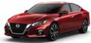
أحمر فلفلي NBL Scarlet Ember NBL

Exterior Colours are subject to change depending on market and grade. Please consult your local dealer.