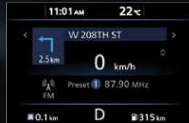
الصفحة الرئيسية HOME

Safety features, directions, fuel economy, and more. You'll enjoy a wider selection of information than ever, directly in your line of sight, on the full-colour 178 mm (7") Advanced Drive-Assist Display. Toggle through your screens with easy-to-use steering wheel controls.