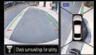
الرؤية الأمامية والعلوية FRONT AND OVERHEAD VIEWS