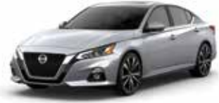
فضي K23 (M) Silver (M) K23