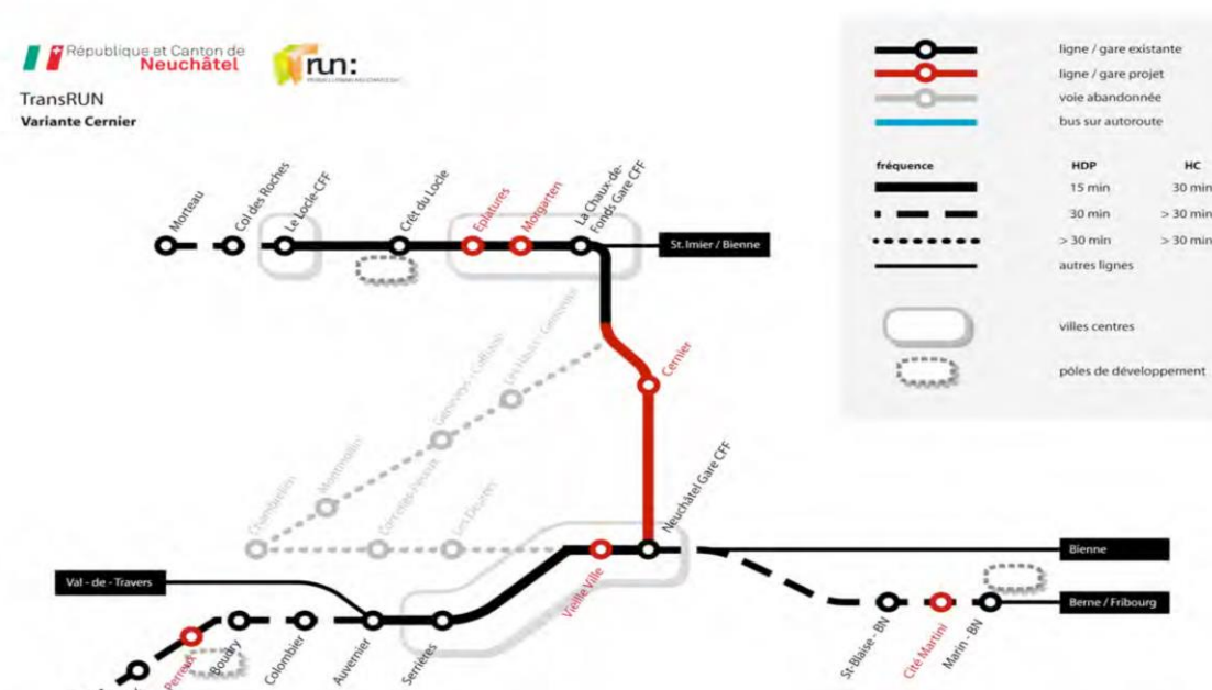
Figure 1 : Projet RUN

Le schéma ci-dessous synthétise le projet d'agglomération de 1 ère génération du RUN. Les nouvelles haltes des Éplatures et de Morgarten planifiées en Ville de La Chaux-de-Fonds y figurent.