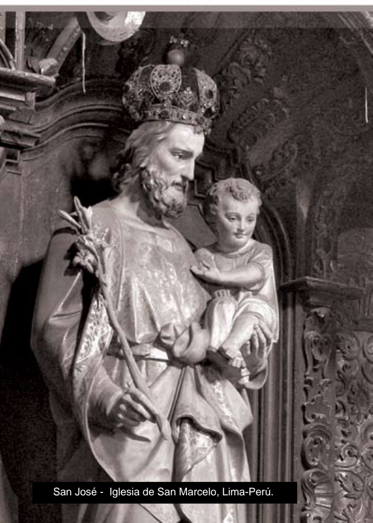
San José - Iglesia de San Marcelo, Lima-Perú.