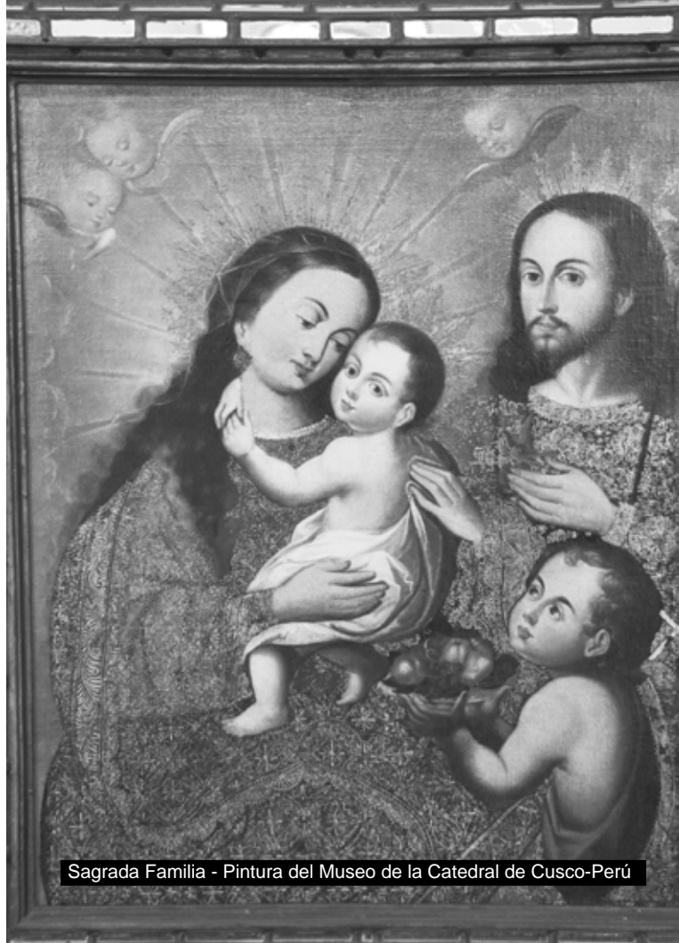
Sagrada Familia - Pintura del Museo de la Catedral de Cusco-Perú