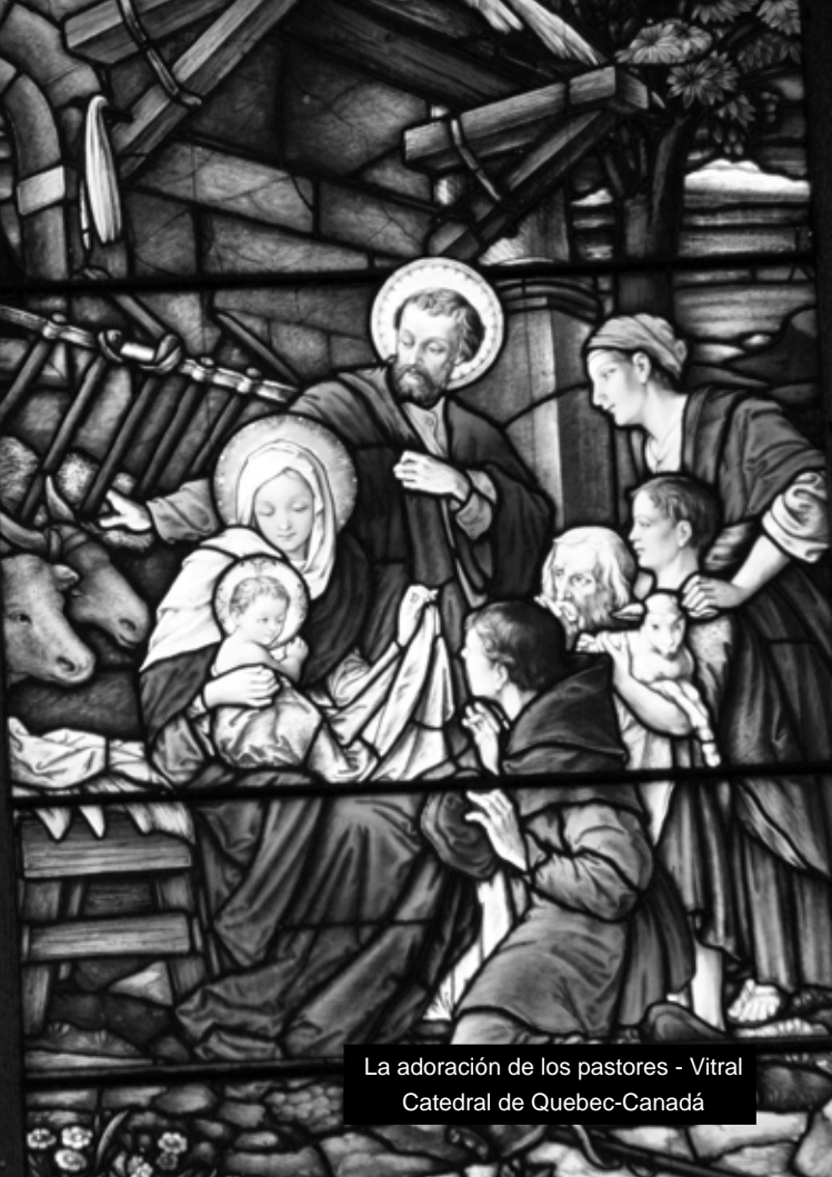
La adoración de los pastores - Vitral Catedral de Quebec-Canadá