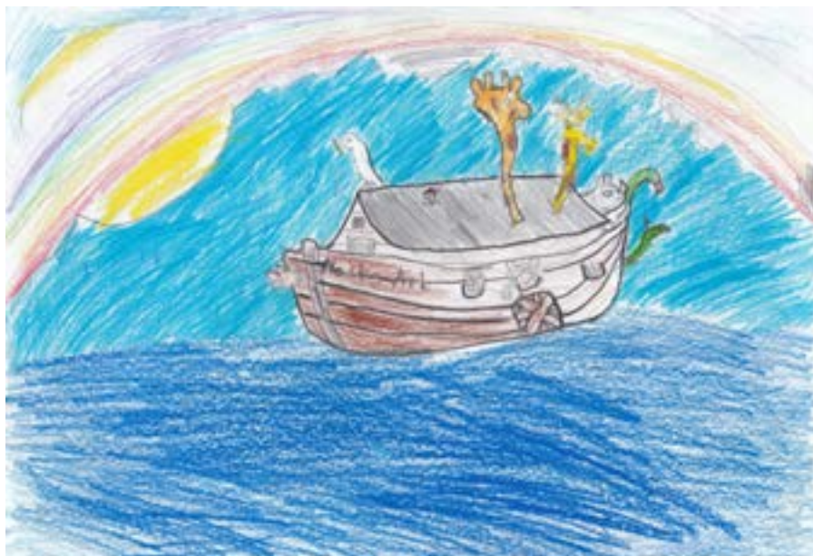
«Arken». Teikna av Magnus, 4. kl. Vats skule.