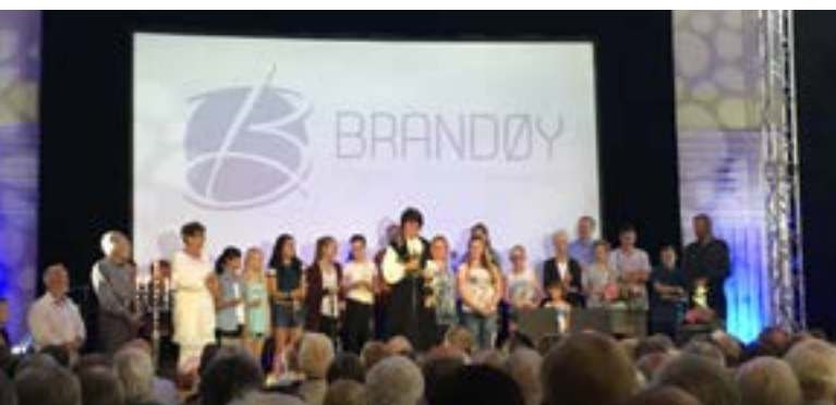
Gymsalen på Brandøy var rigga om til konsert- og møtelokale i jubileumshelga