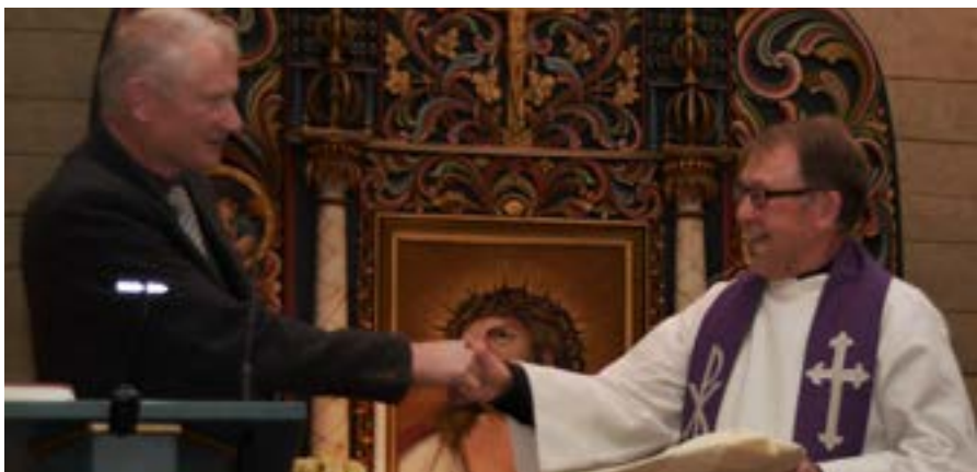
Leiar i Ølen sokneråd overrekte eit stort rosemåla fat og gode takkeord.