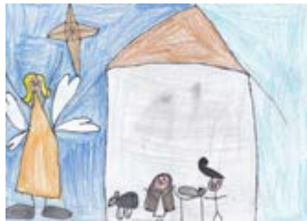
Emi Bøtker Krøger. 3 kl. Bjoa skule.