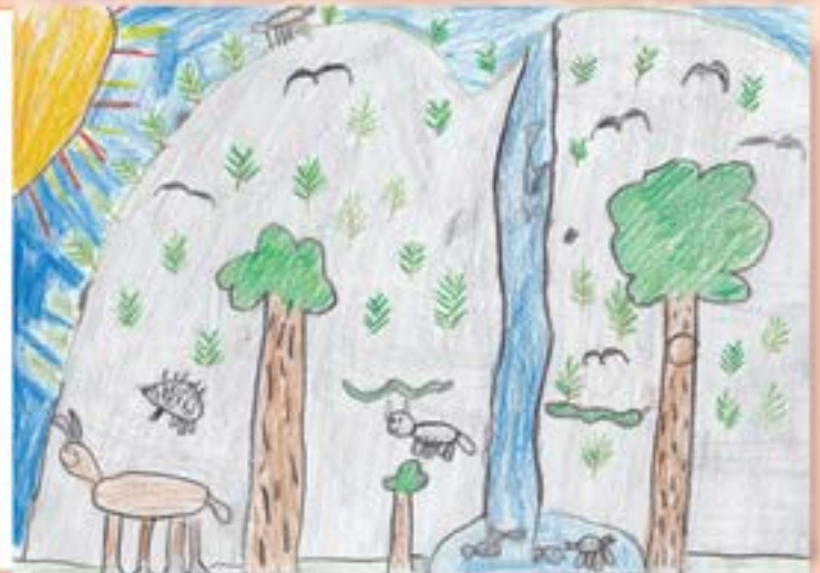
Skapelsen, Teikna av Rasmus, 2. klasse Vats skule.