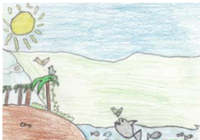
"Skapelsen", Teikna av Askev, 6. kl. Vik skule.