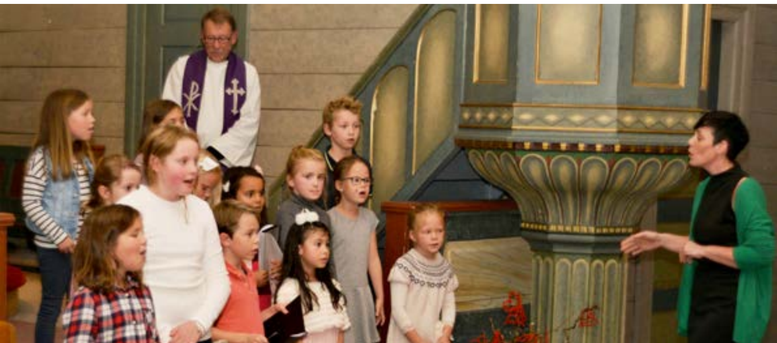
Kids of JOY song for Johannes som skulle reisa.

Det er ikkje alltid Kids og JOY er med på julekonsert, men i år skal dei syngje på julekonsert på Kulturhuset i Ølen. Dirigenten sjølv tek seg gjerne ein tur på julekonsert for å få den gode julestemninga.