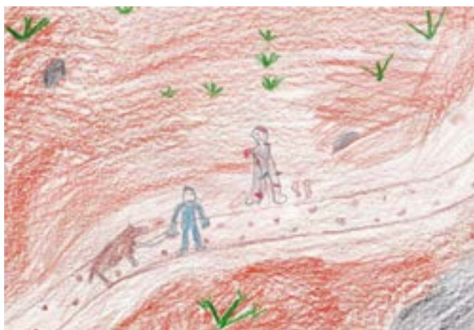
«Samaritanen». Teikna av Mona, 6. kl. Vik skule.