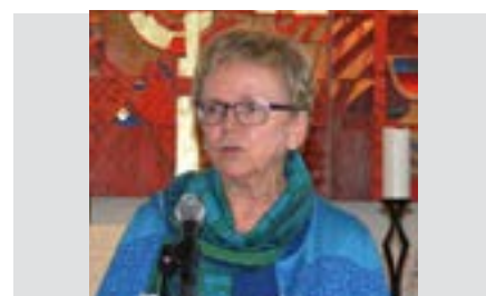
Fylkesmann Magnhild Meltveit Kleppa.