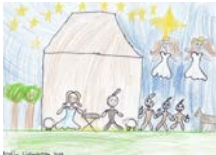
Amelia Ciehanosska. 4. kl. Bjoa skule.