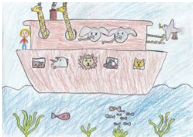
«Arken». Teikna av Rebekka, 4. kl. Vats skule.