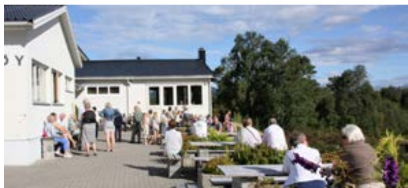
Sola skein og det var godt å vera ute på Brandøydagen