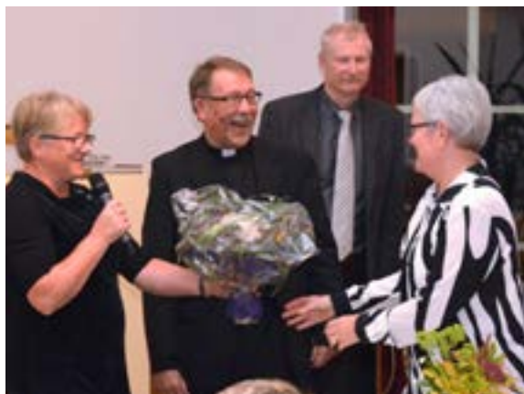
Sokneråda takka for langt og godt samarbeid

Ny sokneprest er alt tilsett, sjå side 3.