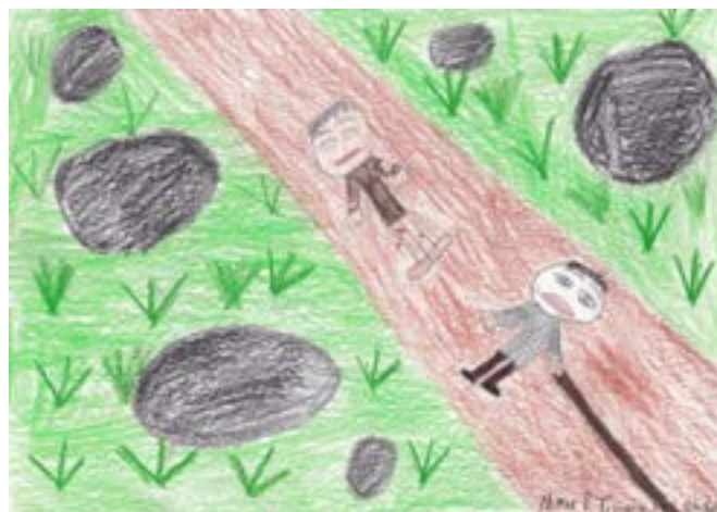
"Samaritanen", Teikna av Tobias, 3. kl. Skjold skule.