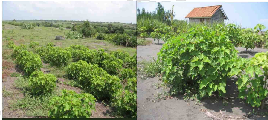
a. Tanamam bibit asal setek