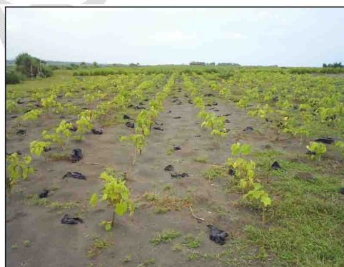
b. Setek tanam tidak langsung