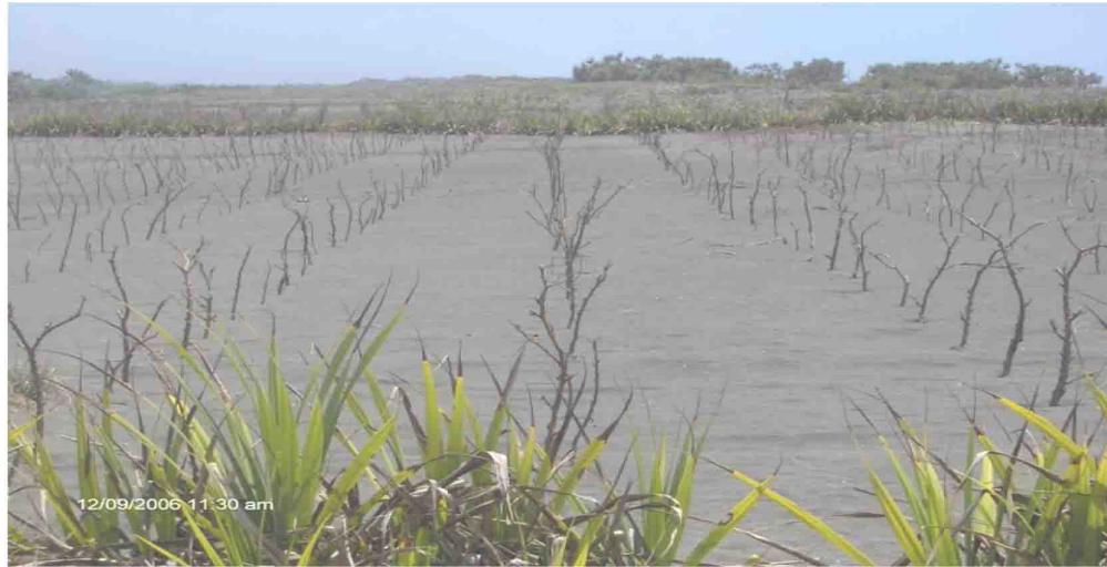
Gambar 5. Jarak pagar asal bibit tanam langsung di akhir musim kemarau tahun 2006

Kenampakan yang berbeda teramati pada tanaman asal bibit baik dari setek maupun biji. Keduanya mampu bertahan hidup melewati musim kemarau yang panas di lahan pasir pantai. Peluang hidup bibit asal setek yang ditanam langsung dengan polibagnya lebih baik dari bibit asal setek yang ditanam dengan melepas polibag sebagai wadah pembibitan sebelum penanaman. Kemampuan bertahan hidup bibit asal setek kemungkinan disebabkan (1) media pembibitan yang dibawa bibit mampu menyediakan lengas tanah, (2) sistem perakaran jarak pagar asal bibit sudah lebih baik dari tanaman asal setek tanam langsung. Paling tidak tanaman asal bibit mempunyai akar berumur 2 bulan lebih tua dari tanaman asal setek. Kemungkinan yang lain jarak pagar termasuk tanaman yang mampu memanfaatkan lengas tanah dalam jumlah yang sangat sedikit dalam tanah untuk mendukung kehidupannya. Dengan hanya memperbaiki kualitas tanah di daerah perakarannya saja, kemampuan tanah di daerah perakaran tersebut mengikat air