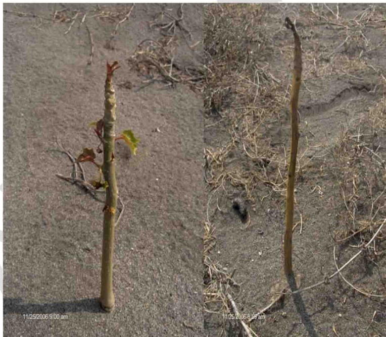
a. Jarak pagar bertunas kembali

gur dan mati kekeringan (Gambar 5). Selain karena panasnya permukaan tanah yang dapat mencapai 50°C saat terik matahari, kematian jarak pagar asal setek yang langsung ditanam di lapangan kemungkinan juga disebabkan terjadinya kendala air di daerah perakaran jarak pagar. Diketahui bahwa lahan pasir pantai merupakan jenis tanah pasir yang mempunyai kemampuan mengikat air sangat rendah. Musim kemarau yang agak panjang menyebabkan keberadaan air di daerah perakaran sangat rendah yang tidak mampu mengimbangi laju evaporasi tanaman. Dengan penanaman sekitar bulan Maret dan langsung dilaksanakan di lapangan, kemungkinan sistem perakaran yang terbentuk masih sangat dangkal.