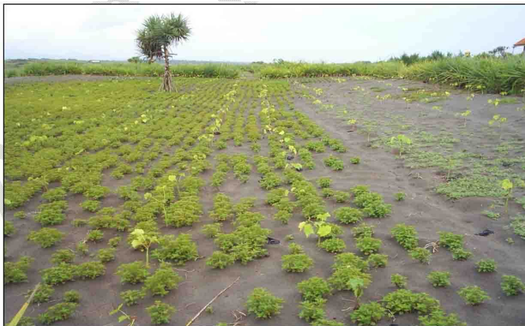
Gambar 3. Keragaan bibit asal biji di lapangan

Musim kemarau merupakan saat yang sangat berat bagi tanaman yang dibudidayakan di lahan pasir pantai. Oleh karena itu di beberapa daerah disiapkan air pengairan yang berasal dari air sungai dengan pendekatan penyiraman langsung. Hal yang sama nampaknya perlu dilakukan untuk jarak pagar.