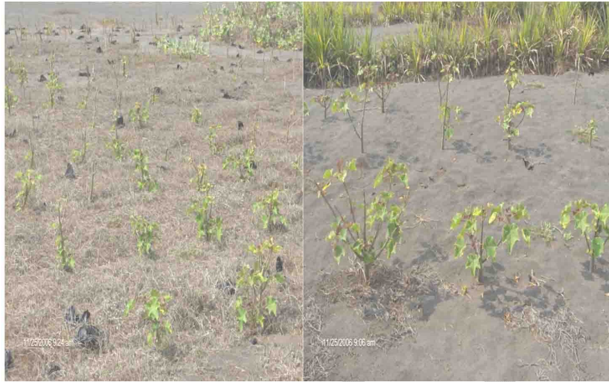
a. Bibit asal setek