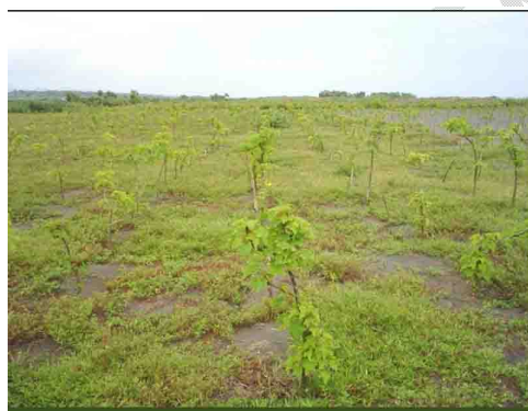
a. Setek tanam langsung