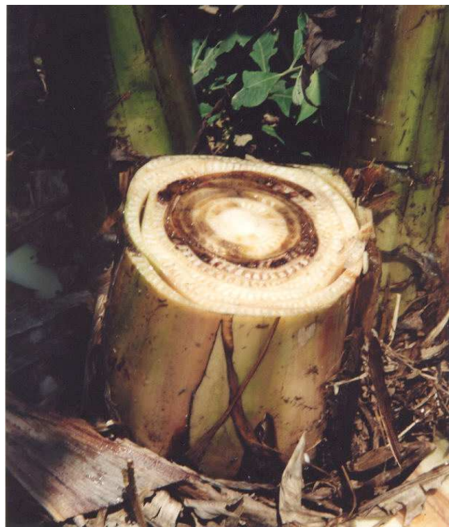
Figura 2. Pseudocaulis de banana apresentando sintomas do ataque de mal-do-panamá (descoloração vascular do pseudocaulis).

Neste trabalho são apresentados os dados de pesquisa obtidos pelo mapeamento da doença nos diferentes municípios de Rondônia, realizado pela Embrapa Rondônia em parceria com a Agência de Defesa Agrossilvopastoril de Rondônia (IDARON), durante o período de 2004 a 2009.