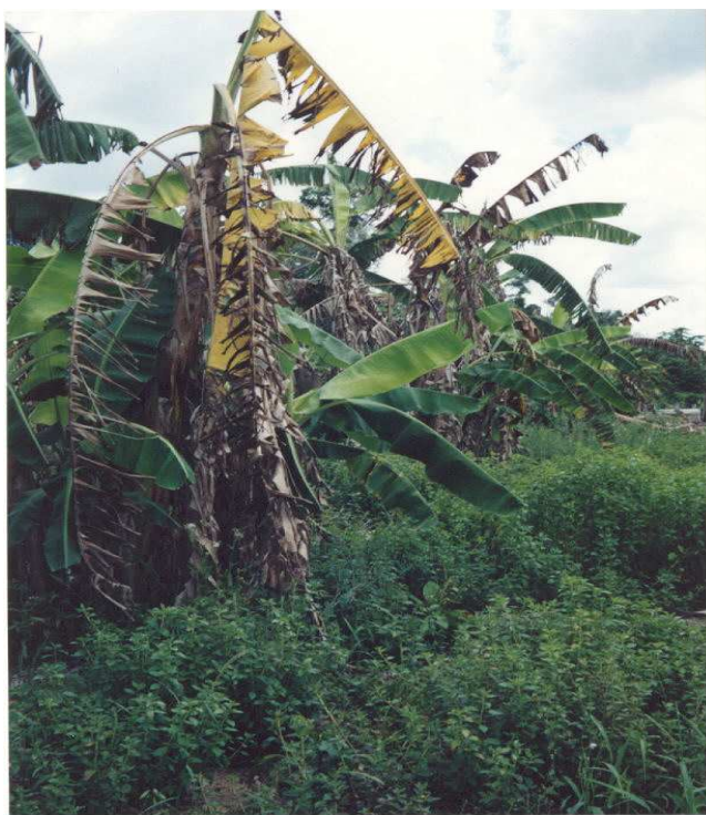
Figura 1. Planta de banana com sintomas do ataque de mal-do-panamá.