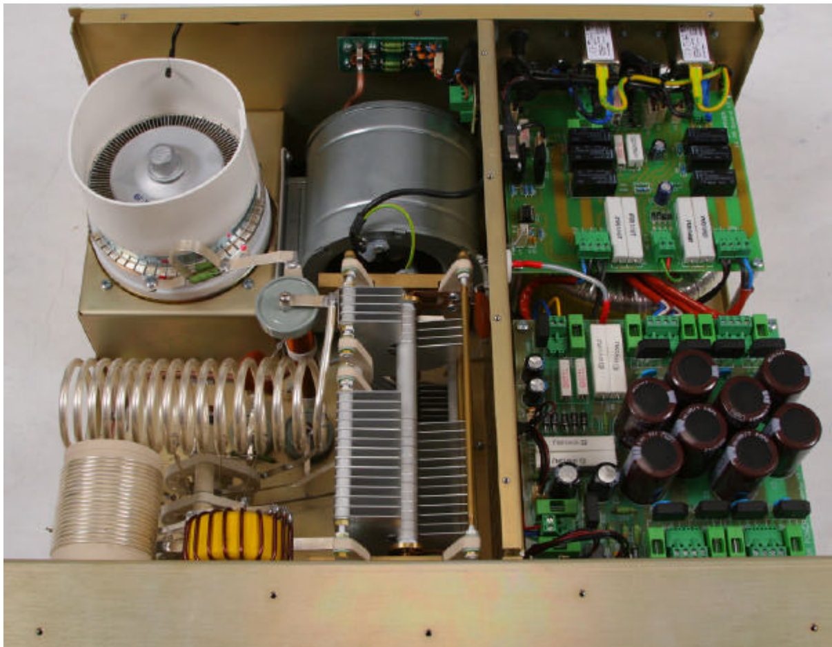
Vista da sopra ad amplificatore aperto