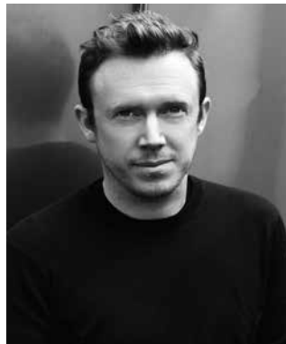
DANIEL HARDING DIRECTEUR MUSICAL DE L'ORCHESTRE DE PARIS

Sous sa direction, l'Orchestre de Paris se produit en février et mars 2018 à Wrocław, Vienne, au Luxembourg, à Dortmund, Cologne et Bruxelles avec la Neuvième symphonie de Gustav Mahler et le Viola Concerto de Jörg Widmann, interprété par son dédicataire, Antoine Tamestit. L'orchestre et Daniel Harding rejoindront en mai l'Espagne : Oviedo, Barcelone, Madrid, Murcia et Valence.