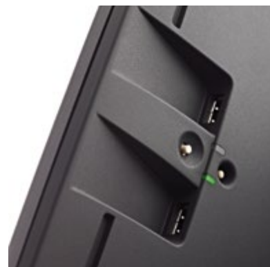
Back-up (salvataggio) & Recovery (ripristino) dati con un solo pulsante

Non saremmo veramente Orderman se durante lo sviluppo di Columbus non avessimo pensato anche ai nostri dispositivi palmari. Ecco perché Columbus può essere facilmente integrato con i palmari Orderman. Columbus è provvisto di serie del lettore Ordercard che permette l'utilizzo delle carte fidelity e prepagate dei clienti semplicemente avvicinando la carta al POS PC. Modello con prestazioni elevate grazie anche al Router Orderman integrato che permette di connettere direttamente molteplici Stazioni Base RF2. Diviene così un vero gioco da ragazzi, implementare installazioni grandi con molti palmari.