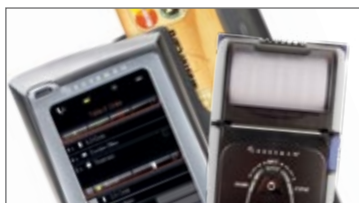
Sol+ MSR con lettore di banda magnetica e stampante da cintura