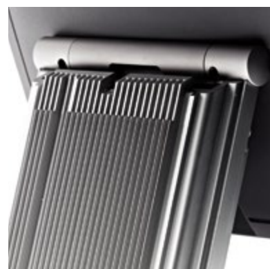
Raffreddamento senza ventole

Orderman Columbus sa essere elegante senza rinunciare a caratteristiche quali robustezza, velocità e affidabilità. In Columbus impieghiamo esclusivamente i processori e le schede grafiche più moderne e veloci. Tutti i componenti sono in perfetta sintonia. La base e la struttura interna, interamente in metallo, offrono un'elevata stabilità e permettono il raffreddamento del sistema senza usare ventole. I numerosi dettagli intelligenti, come il sistema di gestione integrato dei cavi, la serratura camerieri 2in1 e la funzione Back-Up & Recovery programmabile per eseguire il salvataggio e il ripristino dei dati con un solo pulsante, rendono Orderman Columbus un dispositivo dalla tecnologia e dal design semplicemente perfetti.