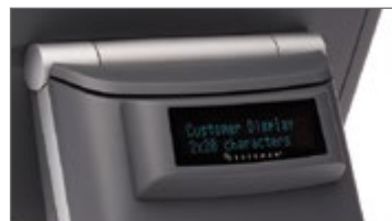
Display di cortesia clienti da 2x20 caratteri integrato