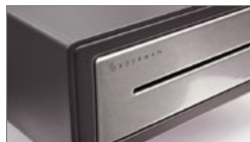
Cassetto portadenaro elegante