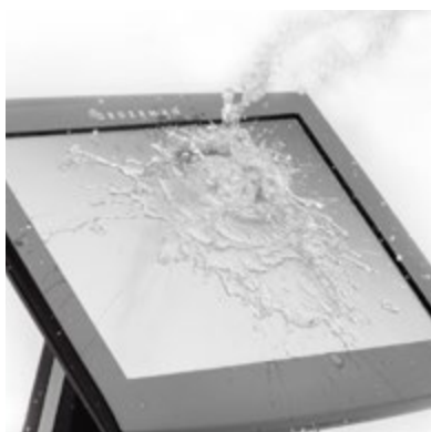
Robusto e affidabile