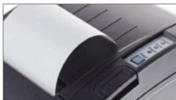
Stampanti termiche veloci