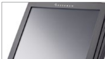
Letto di carte magnetiche MSR integrato