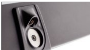
Serratura camerieri 2in1 integrata