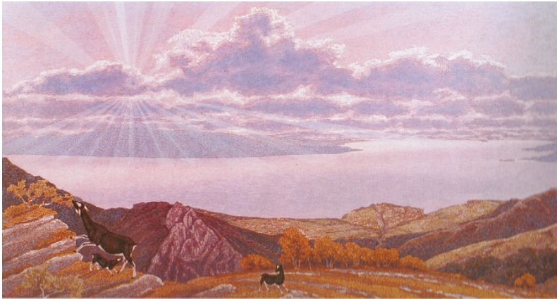
Umberto Moschetti “Panorama del Pizzocolo” (olio su tela 60x120cm)