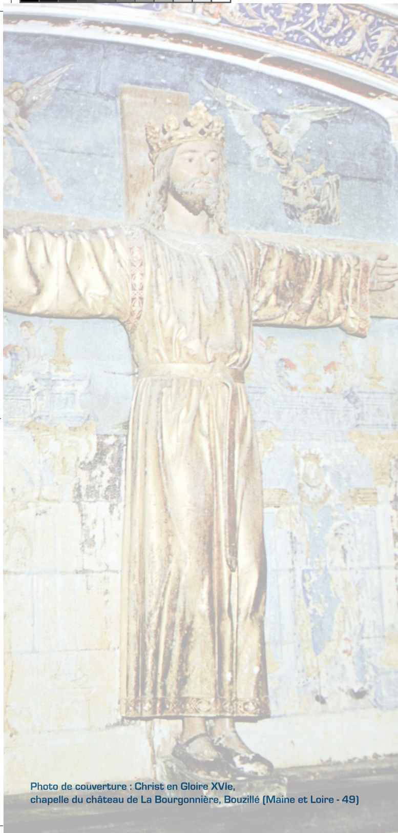
Photo de couverture : Christ en Gloire XVIe, chapelle du château de La Bourgonnière, Bouzellé (Maine et Loire - 49)