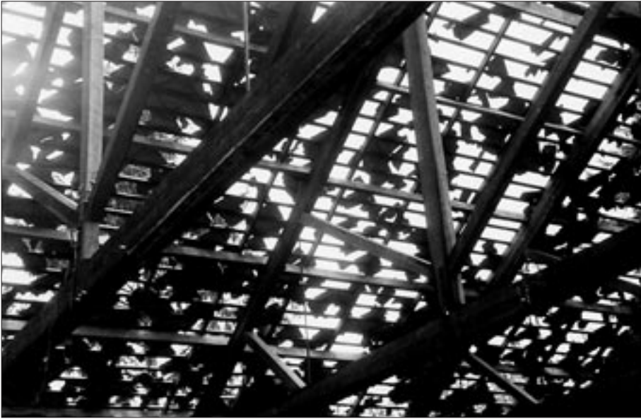
Destrosses de la pedregada en una teulada a Vic el dia de 26 de juliol de 1960.

neu a Terrassa i Manresa, fins a 64 cm a Sabadell i entre 40 i 50 cm a Vic, Igualada i Mataró; a la ciutat de Girona, 30 cm; a Lleida, 20 cm, i a Tarragona, només 3 cm. 12 La causa va ser una situació de NNE que va evolucionar molt ràpidament, amb una forta baixada de les temperatures només en 24 hores, i una depressió situada entre Còrsega, Sardenya i el nord d'Àfrica que va desencadenar aquests fets que s'han catalogat com a excepcionals. A la ciutat de Vic, el dia de Nadal es recorda com el dia de la gran nevada que va deixar sense llum i aigua la ciutat, i les temperatures baixaren considerablement. Les conseqüències d'aquest episodi també van ser enormes a Barcelona. La ciutat va quedar pràcticament paralitzada i els mitjans de comunicació se'n van fer un gran ressò. Les imatges d'esquiadors baixant pel passeig de Gràcia i el carrer Balmes, amb la utilització dels Ferrocarrils de la Generalitat com a remuntadors, foren la part divertida d'aquesta situació que, des del punt de vista meteorològic, es cataloga d'excepcional a la ciutat i en altres pobles i ciutats de la geografia catalana.