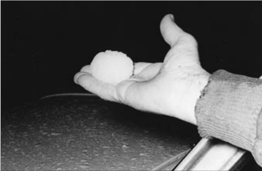
Mida de la pedra que va caure el dia de Santa Anna de 1960 a Vic.

estat l'única onada de fred que ha arribat a la nostra comarca, es recorda com una de les més dures. Els carrers glaçats, les canonades fetes malbé pel fred... les fotografies de l'època il·lustren les glaçades que va patir la ciutat de Vic. Cal destacar també la fredorada de 1945; els termòmetres baixaren considerablement i s'acumularen fins a 45 cm de neu a la mateixa ciutat.