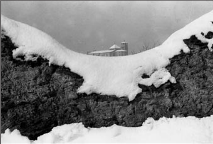
Vista panoràmica de la Catedral de Vic després de la nevada (1962).

1986: Un altre dels episodis singulars que va viure la comarca d'Osona va ser la nevada del dia 30 de gener de l'any 1986. Es van acumular gruixos de neu molt humida de gairebé un metre a Rupit i de 25 cm a la Plana, 13 i van quedar ciutats i pobles sencers sense llum, ni aigua, ni telèfon. Alguns diaris descrivien així la situació viscuda a principis d'aquell any: «La comarca quedà aïllada. Va començar a nevar al matí, a estones amb una virulència que ja feia témer serioses complicacions.» 14