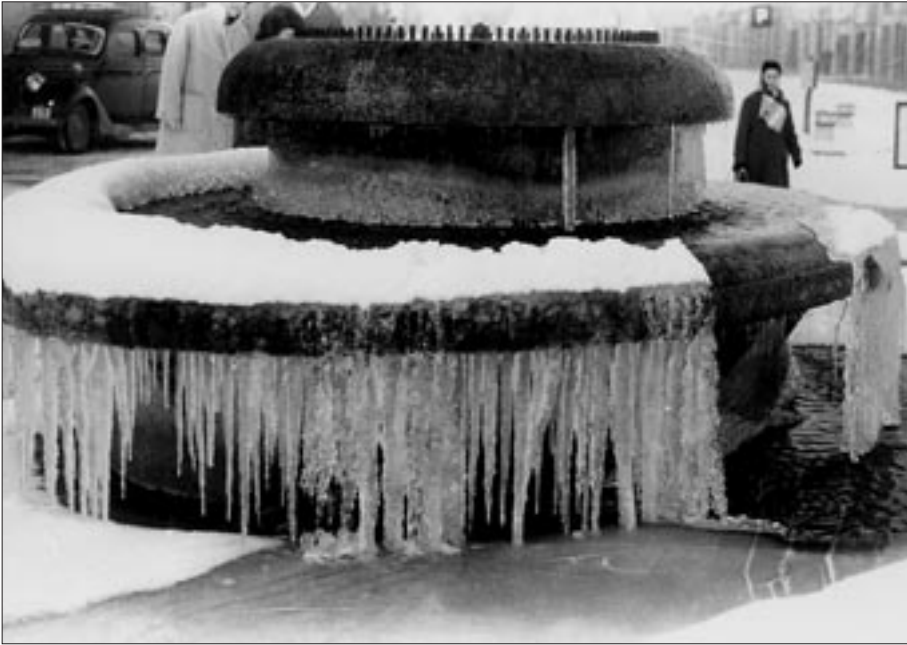
Espectacular glaçada a l'antic sortidor del Passeig de Vic. Mes de febrer de l'any 1956.

fortes arribaren el dia 17 a la nit i van ser de caràcter torrencial. El riu Ter va començar a incrementar el cabal amb crescudes irregulars. El seu màxim va ser a les sis de la matinada del dia 18, amb una alçada de més de nou metres en alguns punts. Els ponts i els edificis situats prop de la riba del riu van començar a cedir. Però Torelló fou la població on l'aiguat provocà més destrosses físiques i pèrdues humanes. Allà el riu Ter va fer de tap i no deixava baixar el riu Ges. A més, el pont de Torelló va quedar tapiat pels troncs i el fang que portava el riu, que es va desbordar i va inundar la part baixa de la vila de Torelló. Van cedir bona part dels edificis (118 en total), i es van comptabilitzar 62 morts i 52 ferits. 10