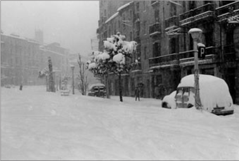
Vista del Passeig després de la nevada del 25 de desembre de 1962.