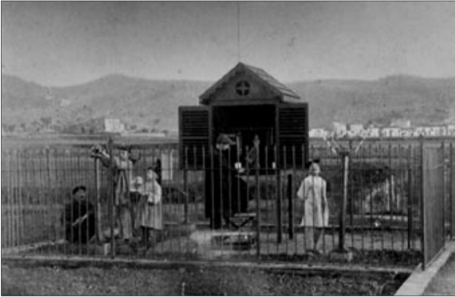
Fotografia de l'any 1909. Observatori del Col·legi del Roser de Sant Julià de Vilatorça.