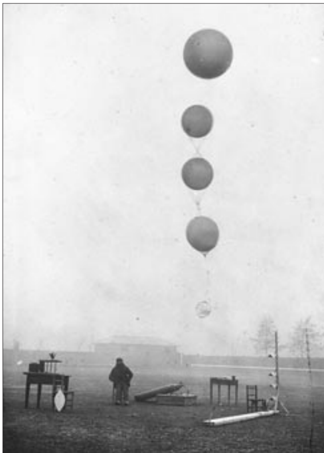
Imatge, fins ara inèdita, del sondatge fet al camp de futbol de Vic, els dies 24 i 25 de gener de 1925, amb Eduard Fontserè.