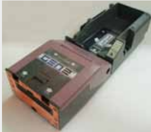
FUTURE LOGIC PSA-66-ST2N P/N: 220-00035-100