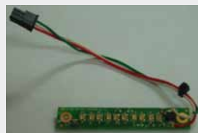
FUTURE LOGIC PSA-66-ST2R/N P/N: 140-00096-100 / 140-00096-101