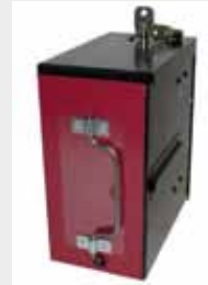
GPT SA-4 P/N: