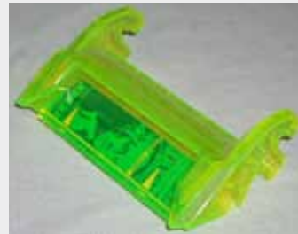
BOQUILLA DE BILLETES (BILL ENTRY GUIDE IGT "GREEN")