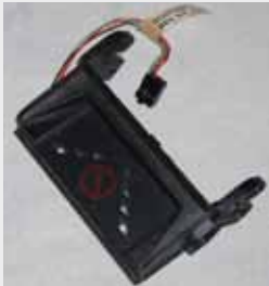
BOQUILLA DE BILLETES (BILL ENTRY GUIDE ARISTOCRAT "BLACK")