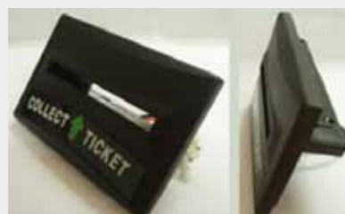
FUTURE LOGIC PSA-66-ST P/N: 140-00028