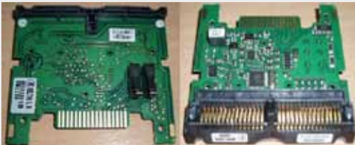
PLACA INTERFACE RS-232/MEI EBDS SPECIFIC INTERFACE BOARD (RS232) (SK, SC66/83-04 & 07 I/F PCB GEN2)

MEI SC66-04/07 P/N: BALLY P/N: 101952-00001