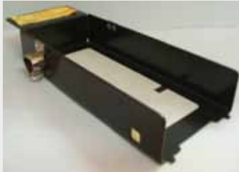
FUTURE LOGIC PSA-66-ST P/N: 310-00035