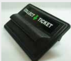
FUTURE LOGIC PSA-66-ST P/N: 130-00002