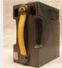
STACKER (CASHBOX PARA MEI SC-66)