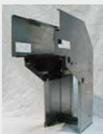
JCM WBA SS P/N: