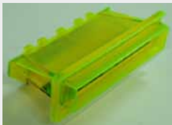
IGT S2000 UP RIGHT P/N: 581-408-02