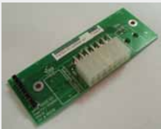
TRANSACT EPIC 950 P/N: 95-04998L (95-04998)