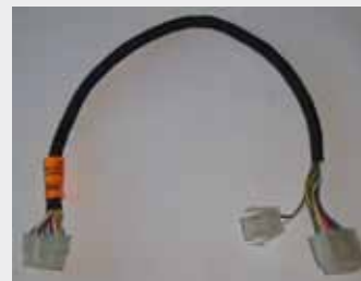
FUTURE LOGIC PSA-66-ST P/N: 150-00012