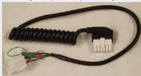
FUTURE LOGIC PSA-66-ST2N P/N: 150-00032-100