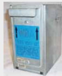
JCM WBA P/N: EDP#053445