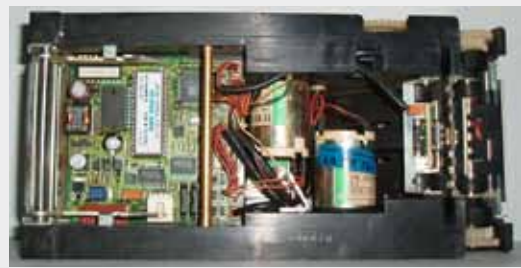
JCM WBA12 P/N: