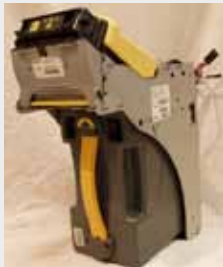
EQUIPO COMPLETO S/BEZEL (NETPLEX)