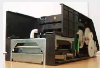
JCM WBA23 P/N: EDP#066845