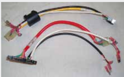
CABLEADOS PARA ATRONIC, BALLY Y WMS