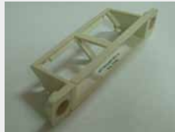
IGT S2000 UP RIGHT P/N: 196-365-00