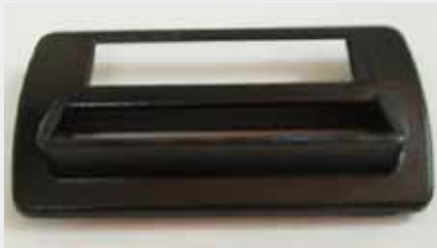
IGT S2000 UP RIGHT P/N: 652-194-00