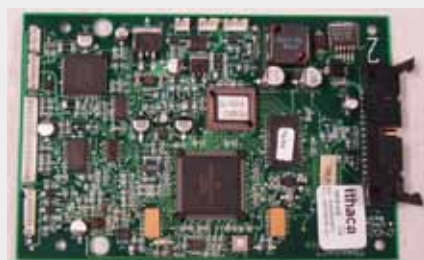
TRANSACT P/N: E030063-04