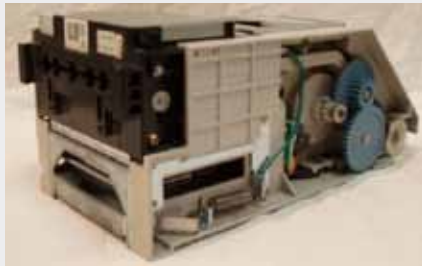
JCM WBA 13/23 SS P/N: