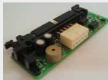
FUTURE LOGIC PSA-66-ST P/N: 140-00026