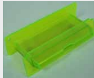
FUTURE LOGIC PSA-66-ST2R/N P/N: 130-00021-100