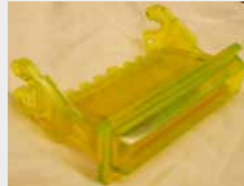
BOQUILLA DE BILLETES (IGT GAME KING PLUS UR 19" & S2000 UR 67mm ENTRY GUIDE)