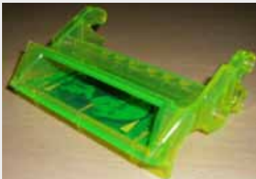
BOQUILLA DE BILLETES (IGT GAME KING UP RIGHT 17" VIDEO 67mm ENTRY GUIDE)