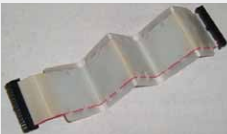
TRANSACT P/N: 85-05684 (85-03510)