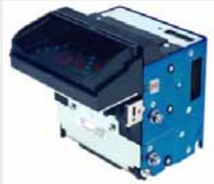
GPT SA-4 P/N: 304X311111