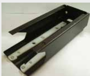
FUTURE LOGIC PSA-66-ST P/N: 100-00001 / 100-00003