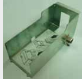
TRANSACT ITHACA 850 P/N: 85-03673