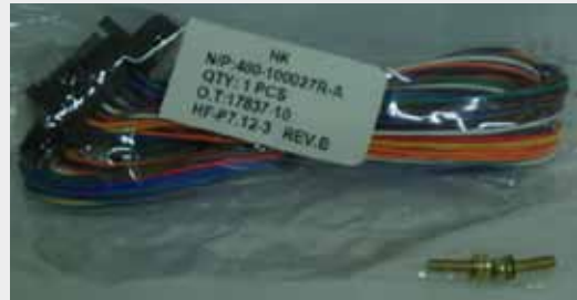
JCM WBA/UBA P/N: 400-100027