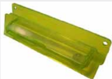
FUTURE LOGIC PSA-66-ST2R/N P/N: 130-00009-100