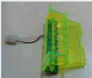
TRANSACT ITHACA 850 P/N: 85-00840