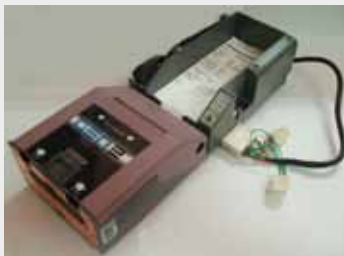
FUTURE LOGIC PSA-66-ST2R P/N: 220-00037-100