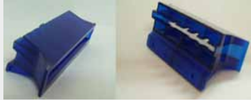
BEZEL BALLY ALPHA (CHUTE, BACC MEI, 66 WIDE, BLUE)

MEI SC66-04/07 P/N: BALLY P/N: 101952-00001