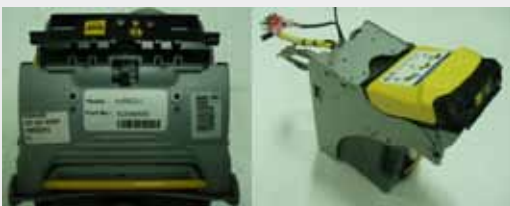
EQUIPO COMPLETO S/BEZEL (USB)