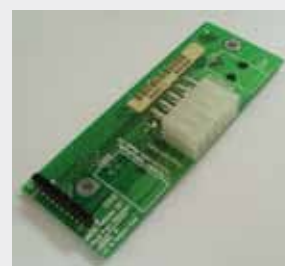
TRANSACT EPIC 950 P/N: 95-05001L (95-05001)