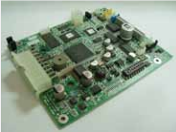
TRANSACT EPIC 950 P/N: 95-04992