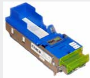
TRANSACT EPIC 950 BALLY P/N: E-01030-1415