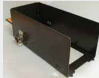
FUTURE LOGIC PSA-66-ST P/N: 310-00036