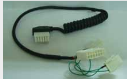
FUTURE LOGIC PSA-66-ST2R P/N: 150-00047-100