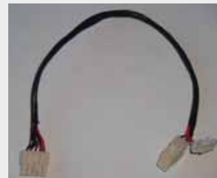
FUTURE LOGIC PSA-66-ST P/N: 150-00009