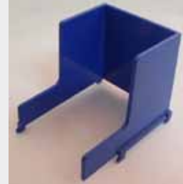
TRANSACT EPIC 950 P/N: 95-06385 (95-05615)