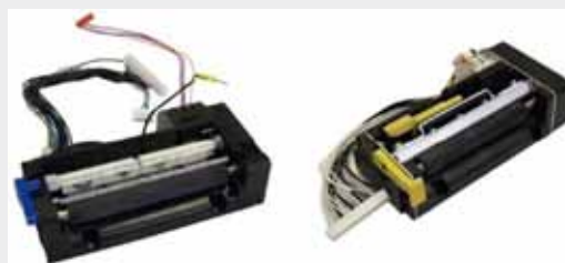
FUTURE LOGIC PSA-66-ST P/N: 400-00005/6