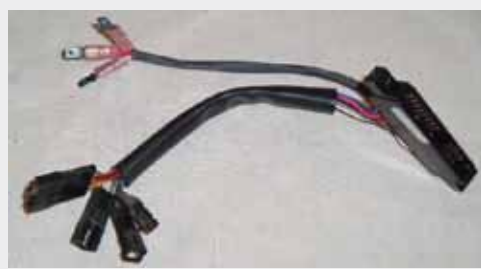
CABLEADOS PARA IGT