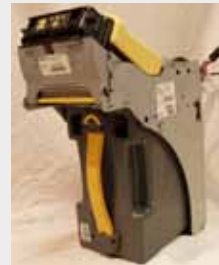
EQUIPO COMPLETO S/BEZEL (RS-232)