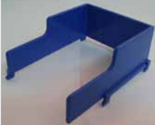
TRANSACT EPIC 950 P/N: 95-06384 (95-05614)