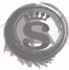
KIT PROGRAMACION (PCB, MAG TESTBOARD,4033-MC-0 1-01,UBA)