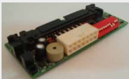
FUTURE LOGIC PSA-66-ST P/N: 140-00027