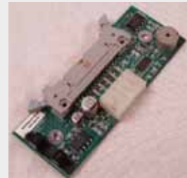
TRANSACT P/N: E030062-01