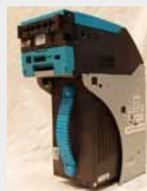
JCM UBA10-SS P/N: 821-100143