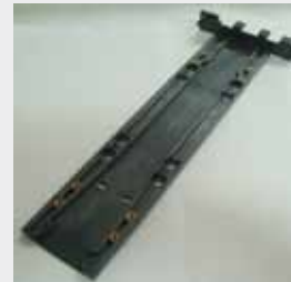
FUTURE LOGIC PSA-66-ST2R/N P/N: 370-00015-100