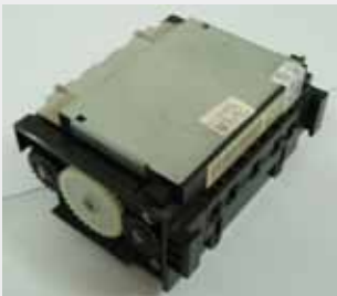
JCM WBA11/13 P/N: