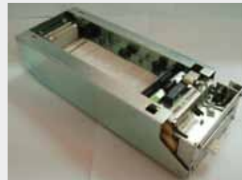
TRANSACT ITHACA 850 P/N: M850