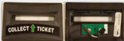
FUTURE LOGIC PSA-66-ST2R/N P/N: 130-00024-100