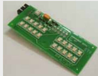
IGT S2000 UP RIGHT P/N: 751-158-0X