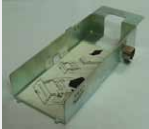
TRANSACT ITHACA 850 P/N: 85-03672