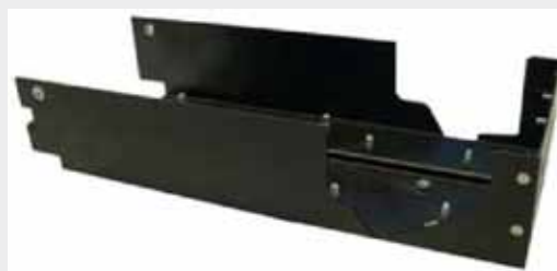
FUTURE LOGIC PSA-66-ST P/N: 100-00008