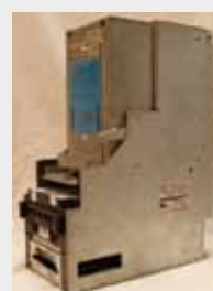
JCM WBA23 SU P/N: