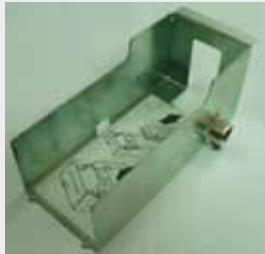
TRANSACT ITHACA 850 P/N: 85-03674