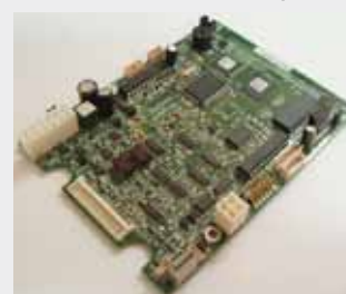
FUTURE LOGIC PSA-66-ST2N P/N: 140-00030