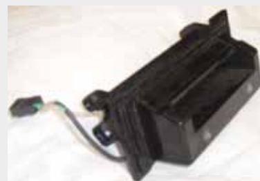
BOQUILLA DE BILLETES (BILL ENTRY GUIDE 67mm ATRONIC UNIVERSAL "BLACK")