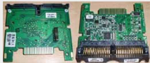
PLACA INTERFACE NETPLEX/MEI (INTERFACE CONTROL BOARD NETPLEX) (SK, SC66/83-02 PCB GEN2)