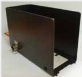
FUTURE LOGIC PSA-66-ST P/N: 310-00037