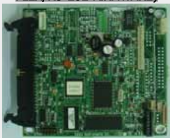
FUTURE LOGIC PSA-66-ST P/N: 140-00004 / 140-00005