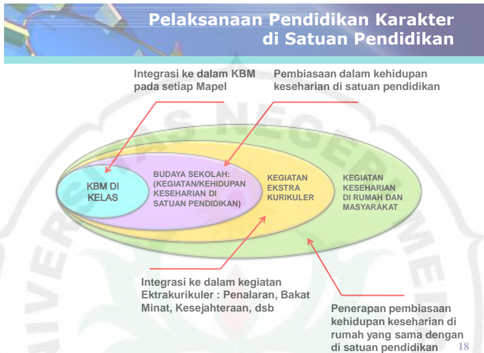
Gambar 3. Pelaksanaan pendidikan karakter di Satuan Pendidikan (Dit. Pendidik dan Kependidikan, 2011)

Sesuai dengan hakikatnya, atribut karakter tanggung jawab dapat ditanamkan melalui kegiatan pendidikan yang mengaplikasikan alat-alat pendidikan yang meliputi ketetadanan, kewibawaan, kasih sayang, ketulusan, ketegasan, dan pemotivasian, yang dimulai dalam pendidikan informal, dilanjutkan dengan pendidikan formal atau nonformal. Selanjutnya, implementasi karakter tanggung jawab dilakukan dalam keseluruhan segi kehidupan mahasiswa (pembiasaan kehidupan) yang menuntut tanggung jawab sebagai