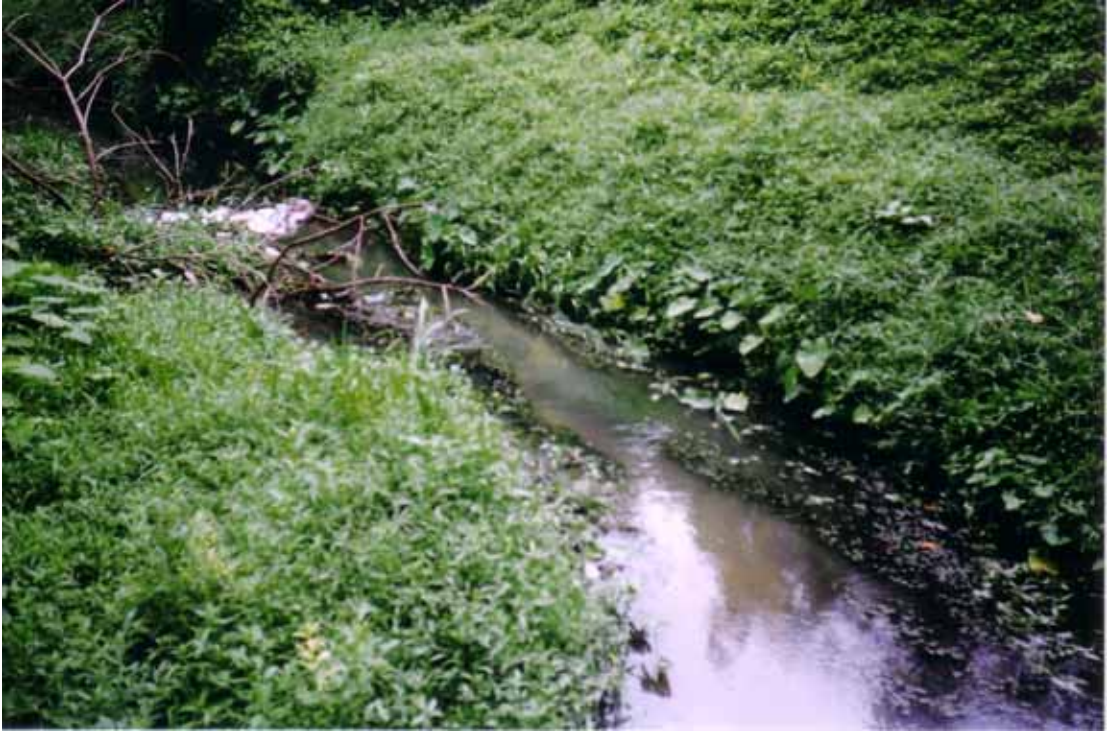
Plat 3.3 Sungai Taman Belia.