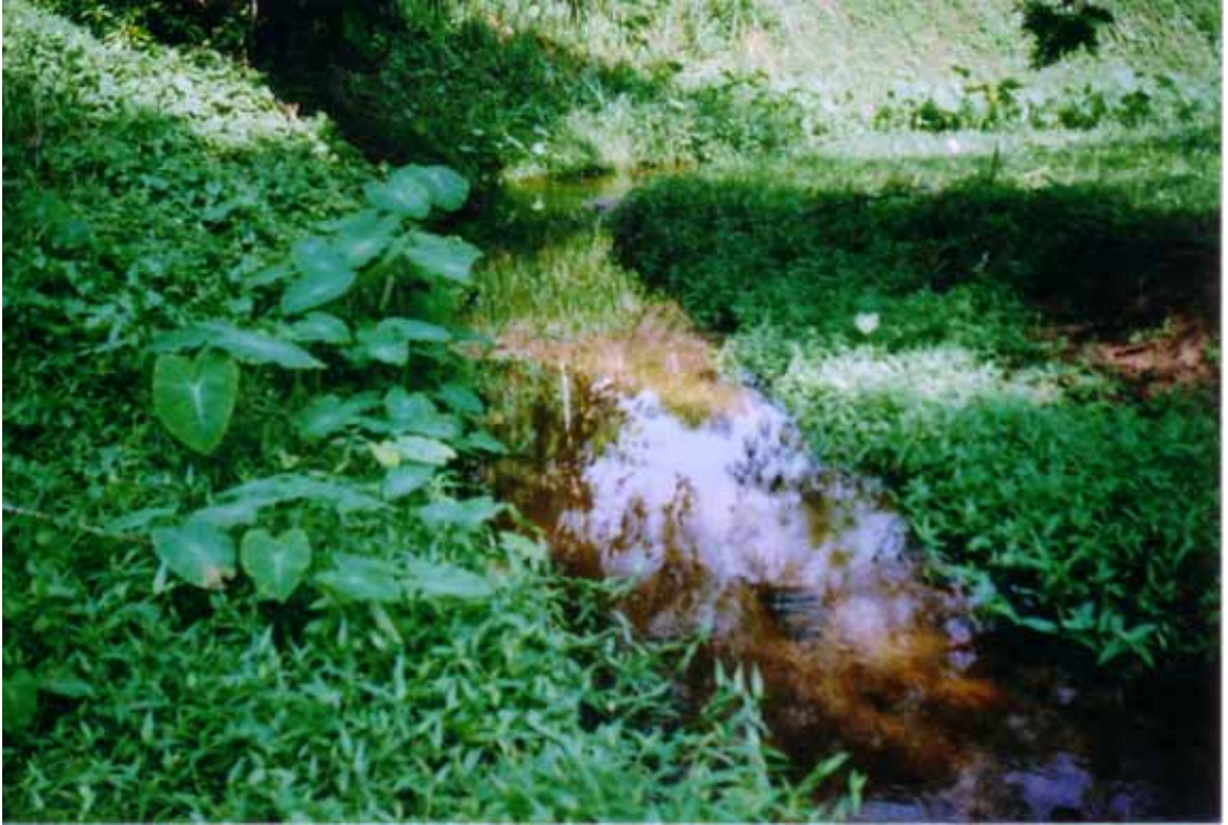
Plat 3.1 Sungai Air Terjun.