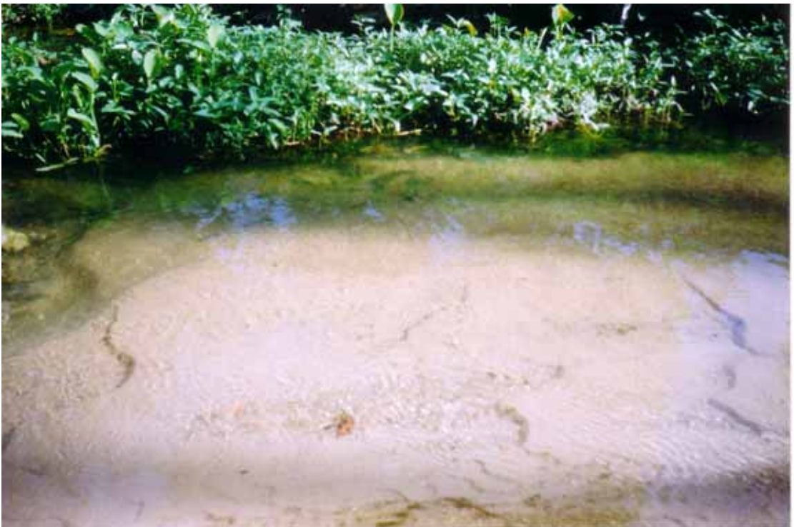
Plat 3.2 Sungai Titi Teras.