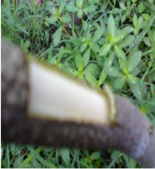
SAYATAN BATANG BAWAH