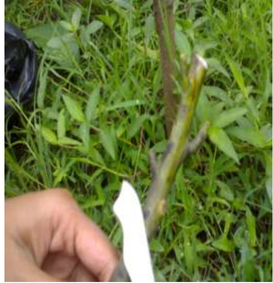
PENGAMBILAN MATA TUNAS