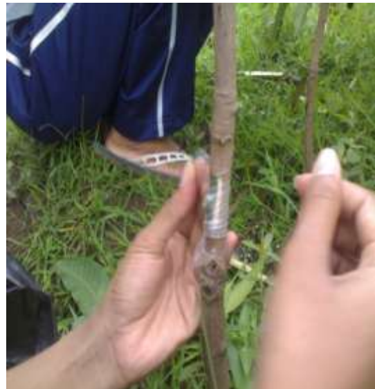
PENEMPELAN MATA TUNAS