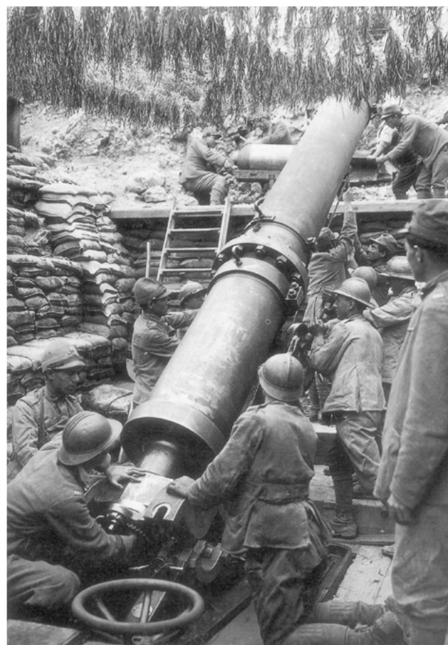
Soldati in trincea durante la Prima guerra mondiale.

andavano oltre Sarajevo e la Serbia. Ciò riconduce alla questione della colpa, ma Clark pensa che non sia questa la via giusta per capire cosa è successo. «Lo scoppio della guerra fu una tragedia, non un delitto con un colpevole [...]. Non si può fare a meno di chiedersi se i protagonisti compresero quanto fosse alta la posta in gioco.»