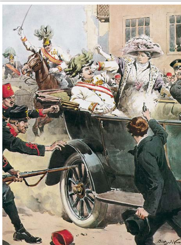
L'attentato di Sarajevo nel disegno di A. Beltrame per "La domenica del Corriere" (n. 27, 5-12 luglio 1914).

Sul fronte opposto a quello della casualità c'è l'inevitabilità. Prima ancora di chiarire meglio che cosa si possa ragionevolmente intendere con "inevitabile", è opportu-