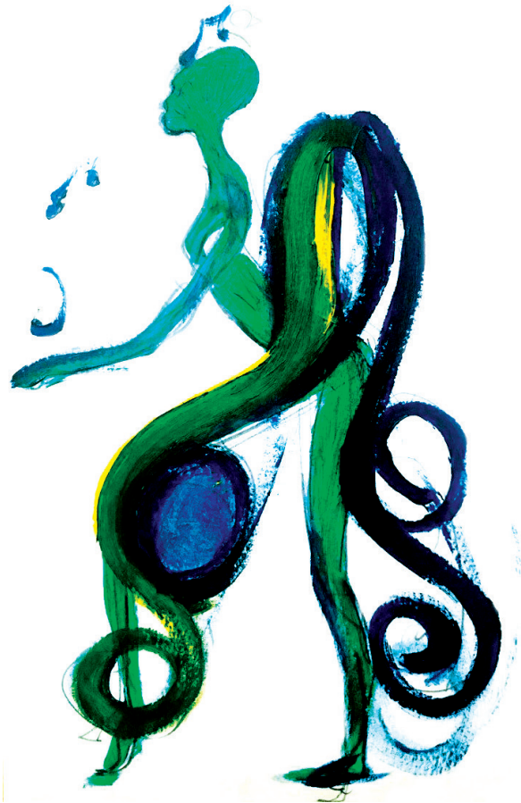
Dessin de Gabriella Furno