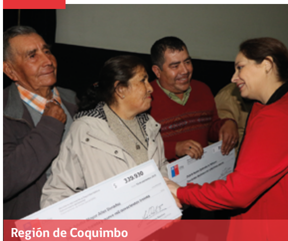
Región de Coquimbo