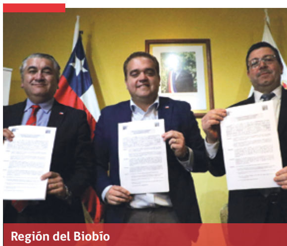
Región del Biobío

En el primer aniversario de la Región de Ñuble, el Ministro del Interior y Seguridad Pública, Andrés Chadwick , anunció una inversión de 14 mil millones de pesos del Fondo Nacional de Desarrollo Regional, para mejorar la infraestructura y modernizar al aparato policial. La reposición de 10 unidades policiales, entrega de 86 nuevos vehículos para la PDI y Carabineros, además de 236 cámaras de televigilancia, forman parte del Plan que busca fortalecer la seguridad. "Son vehículos que realmente vienen a modernizar y a mejorar la flota, algo tan importante para el patrullaje y para llegar a tiempo a los lugares y ejecutar la acción preventiva", aseguró el Ministro Chadwick.