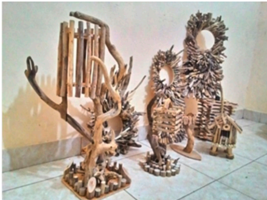
Gambar 4. Produk Hasil Pelatihan Sampah Laut Kayu