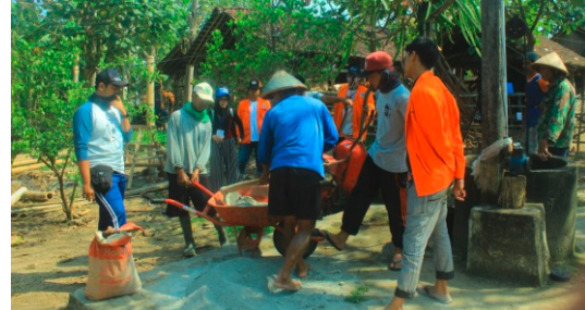
Gambar 11. Mahasiswa Bersama Masyarakat Membangun Green House

Pengadaan dan pembangunan rumah pembibitan di area kandang terpadu oleh mahasiswa KKN UAD bersama dengan Kelompok Ternak Kandang Andhini mempunyai harapan bahwa kawasan kandang terpadu dapat dimanfaatkan semaksimal mungkin untuk pembibitan bermacam tanaman buah atau tanaman obat keluarga sehingga dapat memanfaatkan kotoran ternak yang ada di sekitar kandang untuk dijadikan pupuk sekaligus dapat dijadikan arena edukasi tatacara pembibitan dan penanaman kepada para wisatawan yang datang ke area konservasi mangrove mengingat ke depan konsep pengembangan kawasan baros bertema Pengembangan Kawasan Konservasi Mangrove Berbasis Eko Eduwisata Mangrove .