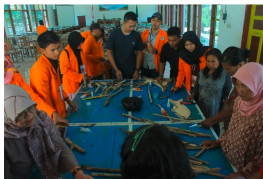
Gambar 3. Suasana Pelatihan Pemanfaatan Sampah Laut Kayu

Begitu pula adanya sisa limbah kayu meubel yang banyak dijumpai di tengah masyarakat Tirtohargo dapat pula dimanfaatkan menjadi kerajinan tangan yang bernilai tinggi. Hal itulah yang melatarbelakangi diadakannya pelatihan kerajinan tangan dalam program KKN PPM UAD di Desa Tirtohargo.