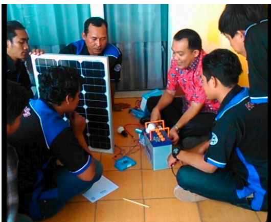
Gambar 15. Pelatihan Perakitan Solar Panel

Sebelum dilakukan pengadaan solar panel di pondok jaga, terlebih dahulu diadakan pelatihan perakitan dan penghitungan kebutuhan untuk pembuatan solar panel.