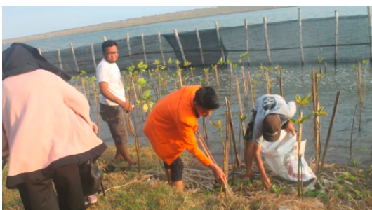
Gambar 10. Pembersihan Sampah di Sekitar Lokasi Penanaman Mangrove

Selain itu, setiap hari minggu mahasiswa bersama-sama dengan KP2B melakukan bersih pantai. Hasil sampah yang berupa kayu laut dibuat menjadi souvenir atau kerajinan tangan, dan sampah laut yang berupa sandal dirangkai sebagai dinding pembatas. Harapannya hal tersebut bisa menjadi pioner atau mengawali setiap kegiatan peduli lingkungan yang dilakukan para wisatawan di tempat tersebut. Para wisatawan diharapkan selain datang untuk menanam mangrove, setiap kembali dari menyusuri pantai ikut membawa sampah laut yang ditemuinya di sepanjang pantai sebagai wujud nyata peduli lingkungan yaitu menyelamatkan pantai dari sampah.