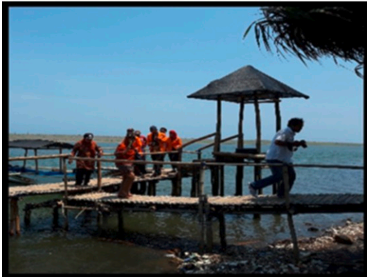
Gambar 18. Dermaga Mini Pantai Baros