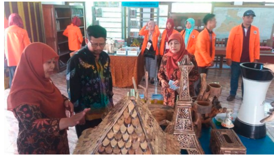
Gambar 13. Hasil Pelatihan dan Potensi yang Ada di Tiga Dusun Dipamerkan Saat FGD

FGD yang dilakukan mahasiswa KKN tersebut bertujuan untuk mempertemukan stake holder terkait, atau pemangku kebijakan atas pengembangan kawasan konservasi mangrove di Baros Tirtohargo ini dengan mengundang Bappeda Bantul, Dinas Lingkungan Hidup Kabupaten Bantul, Kecamatan Kretek, Pemerintah Kelurahan Tirtohargo, Dinas Pertanian dan Peternakan Kabupaten Bantul, Dinas Pariwisata Kabupaten Bantul serta SKPD terkait serta tak lupa KP2B sendiri sebagai pelaksana konservasi.