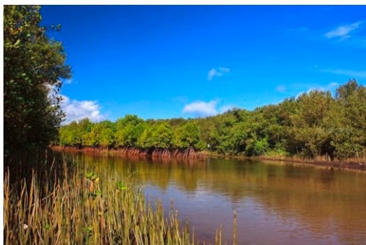
Gambar 1. Ekosistem Mangrove di Pantai Baros Tirtohargo

Penanaman mangrove di Pantai Baros ini di masa yang akan datang prospeknya sangatlah besar bagi kemakmuran warga masyarakat sekitar asalkan mulai dari sekarang dimanfaatkan dengan benar. Terdapat peluang besar pengembangan kemakmuran masyarakat sekitar yaitu: a) pengembangan wisata alam pantai yang sekaligus dapat berfungsi sebagai pusat pendidikan lingkungan pesisir di Yogyakarta; b) selain itu juga dapat dikembangkan perikanan payau dengan kolam jebak ataupun keramba jaring apung.