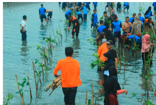
Gambar 8. Penanaman Mangrove Bersama dengan Siswa SMK dan Warga Masyarakat Sekitar

Kegiatan peduli lingkungan yang dilaksanakan adalah kegiatan penanaman 1000 batang tanaman mangrove bersama-sama dengan masyarakat sekitar dan juga bekerja sama dengan Lembaga Penanggulangan Bencana, Kokam serta Hizbul Wathan Pimpinan Daerah Muhammadiyah Kabupaten Bantul.