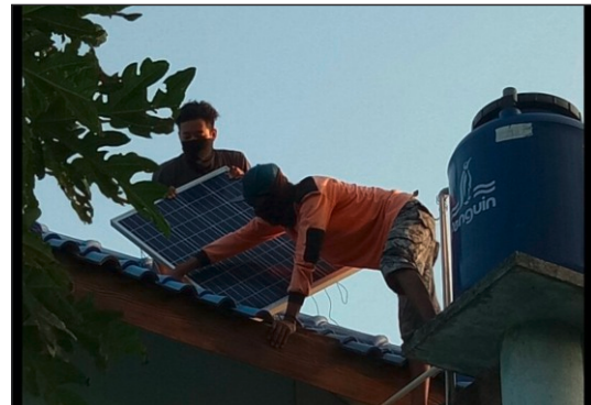
Gambar 16. Pemasangan Solar Panel di Pondok Jaga