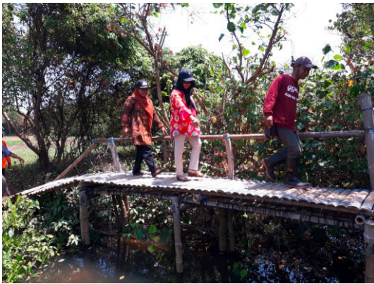
Gambar 19. Jembatan Bambu di Kawasan Baros