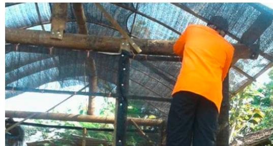
Gambar 12. Mahasiswa sedang Memasang Atap untuk Rumah Pembibitan