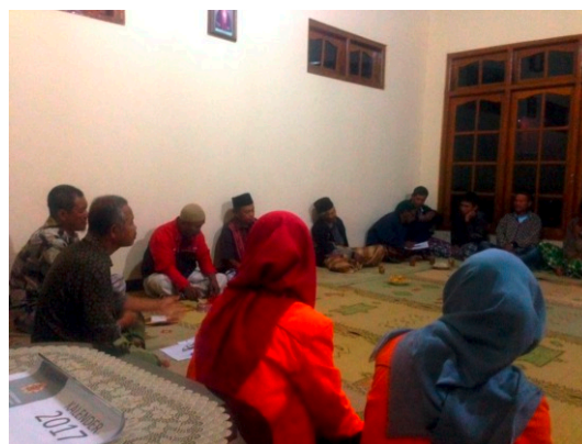
Gambar 2. Suasana Pelatihan yang Dilakukan Malam Hari Bersama Warga

Pelatihan-pelatihan yang dilakukan antara lain adalah (a) pelatihan menuju desa wisata; (b) pelatihan service excelent (pelayanan prima); (c) pelatihan pemanfaatan sampah kayu laut dan limbah meubel untuk dijadikan souvenir daerah wisata, (d) pelatihan pemanfaatan lahan kosong di sekitar lahan mangrove dan di sekitar tempat tinggal untuk dimaksimalkan untuk budidaya air payau.