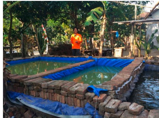
Gambar 7. Kolam Terpal di Dua Dusun Penyangga

Tahapan dalam pembuatan kolam terpal adalah sebagai berikut. (1) Persiapan. Begitu pemasangan terpal selesai, saat itu pula segera diairi, dan proses pengairan sebaiknya sedikit demi sedikit, karena dengan begitu terpal akan mapan dengan baik; agar terpal tidak mudah rusak, semua bagian harus tertutup baik dengan batako ataupun dengan air, oleh karena itu air harus penuh, apabila hujan tumpahan air akan mengalir disela-sela batako; setelah pengisian air penuh diberikan pupuk cair (probiotik) dengan cara dipercikkan secara merata; air kolam jangan sampai tumpah karena pupuk cair akan terbuang; setelah penuh, 3 hari sebelum penebaran benih, sebarkanlah garam dapur (krosok) 200 gram/m 3 air secara merata di kolam sebagai desinfektan; kolam didiamkan selama 7 hari untuk penumbuhan pakan alami; penebaran benih lele pada hari ke-8, ukuran 7 - 9 cm dengan kepadatan 100 ekor/m 2 ; penebaran benih dilakukan pagi hari sebelum jam 8, atau sore hari menjelang senja.