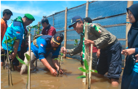
Gambar 9. Penanaman Mangrove Bersama dengan Lembaga Penanggulangan Bencana dan Hizbul Wathan Pimpinan Daerah Muhammadiyah Bantul

Selain itu, setiap hari minggu mahasiswa bersama-sama dengan KP2B melakukan bersih pantai. Hasil sampah yang berupa kayu laut dibuat menjadi souvenir atau kerajinan tangan, dan sampah laut yang berupa sandal dirangkai sebagai dinding pembatas. Harapannya hal tersebut bisa menjadi pioner atau mengawali setiap kegiatan peduli lingkungan yang dilakukan para wisatawan di tempat tersebut. Para wisatawan diharapkan selain datang untuk menanam mangrove, setiap kembali dari menyusuri pantai ikut membawa sampah laut yang ditemuinya di sepanjang pantai sebagai wujud nyata peduli lingkungan yaitu menyelamatkan pantai dari sampah.