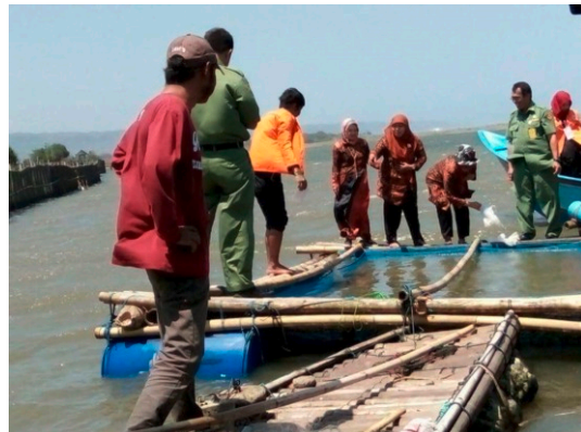
Gambar 14. FGD Diakhiri dengan Pelepasan Bibit Ikan di KJA Setelah Sebelumnya Berkeliling di Area Konservasi Mangrove

Saat FGD berlangsung turut dipamerkan hasil pelatihan berupa pemanfaatan sampah laut yang berupa kayu ataupun pemanfaatan limbah meubel kayu. Selain itu juga, FGD juga melibatkan masyarakat dengan turut serta menampilkan potensi yang ada di masing-masing dusun, seperti potensi adanya tanaman jahe, potensi budidaya jamur, potensi tanaman bawang merah dan bawang putih, serta adanya potensi pembuatan gerabah.