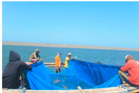
Gambar 6. Pembuatan Keramba Jaring Apung (KJA) di Muara Sungai

Harapan diadakannya pelatihan ini nantinya KJA (Keramba Jaring Apung) yang dibangun dapat menjadi pilot project masyarakat setempat. Sedangkan di dua dusun lain sebagai dusun penyangga kawasan konservasi yang tidak mempunyai muara, maka dibuatkan pilot project kolam sistem terpal dengan menggunakan batako.