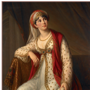
Élisabeth Vigée Le Brun (1755–1842) Giuseppina Grassini dans le Rolle de Zaïre 1805, Huile sur toile

Hôtel de Bourgtheroulde -15 Place de la Pucelle – Rouen