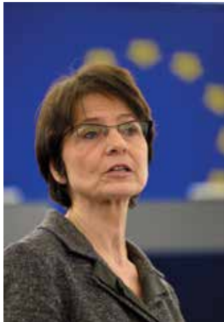
Marianne Thyssen Comissária europeia para o emprego, assuntos sociais, competências e mobilidade

“Este ano marca o 40.º aniversário do Cedefop. Nenhuma outra organização compreende tão bem a forma como os sistemas de ensino e formação profissional europeus procuram, neste momento, ir ao encontro das expectativas do século XXI.