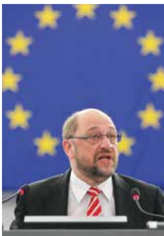
Martin Schulz Presidente do Parlamento Europeu

“Numa altura em que nos deparamos com grandes dificuldades económicas, é fundamental melhorar a capacidade dos sistemas de ensino e formação profissional. Não devem ser poupados esforços na procura de uma solução para a crise.