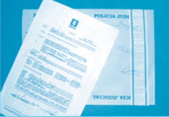
Describir en forma detallada el estado físico de las sustancias

4.2 Constatar la presencia de la Policía Judicial y del delegado del Ministerio Público y realizar la inspección ocular.