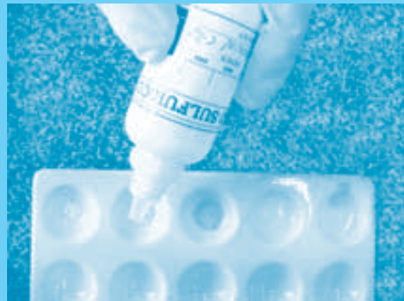
Aplicación de reactivo ácido sulfúrico en PIPH

La identificación preliminar de dichas sustancias es un proceso técnico en el que se utilizan reacciones químicas cualitativas, sencillas e inmediatas, basadas en el desarrollo del color y/o reacciones de precipitación. Esta identificación debe ser realizada por personal capacitado y certificado, dotado de los elementos de trabajo que requiere este tipo de pruebas en campo, cuyos resultados deben ser sin excepción confirmados por los laboratorios estatales reconocidos y competentes mediante el desarrollo de la prueba pericial, realizada por profesionales del área de química.