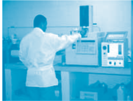
Cromatógrafo de gases

Calle 38 No 44-71. Piso 12. Edificio Lara Bonilla. Barranquilla. Telefax 3511823 – 3491178 - 3491065