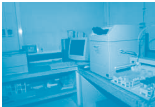
Espectrómetro de masas acoplado a plasma inducido de Argón

Todo el material utilizado anteriormente se relaciona y almacena en la bolsa plástica con cierre tipo cremallera se ROTULA Y SELLA de acuerdo con la Resolución 0-1890 del 5 de noviembre de 2002 que establece el diseño y aplicación del sistema de cadena de custodia.