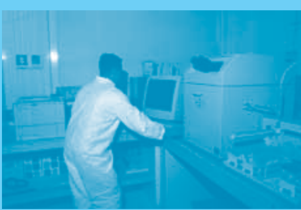
Equipo ICP-MS, para análisis de residuos de disparo

El oficio debe contener la solicitud expresa del análisis requerido, la unidad de Fiscalía, o la autoridad de policía judicial solicitante, dirección y teléfono. Así mismo, debe registrarse la autoridad con los datos correspondientes para el envío del dictamen o informe del laboratorio