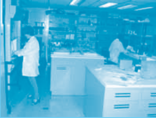
Vista parcial Laboratorio Buga