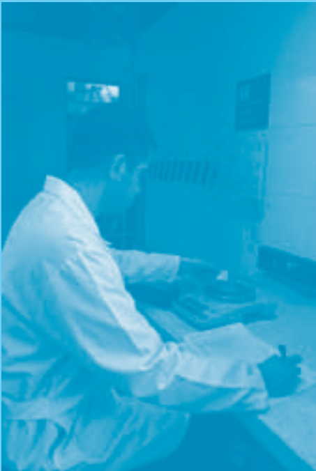
Registrar marca de la balanza y su capacidad