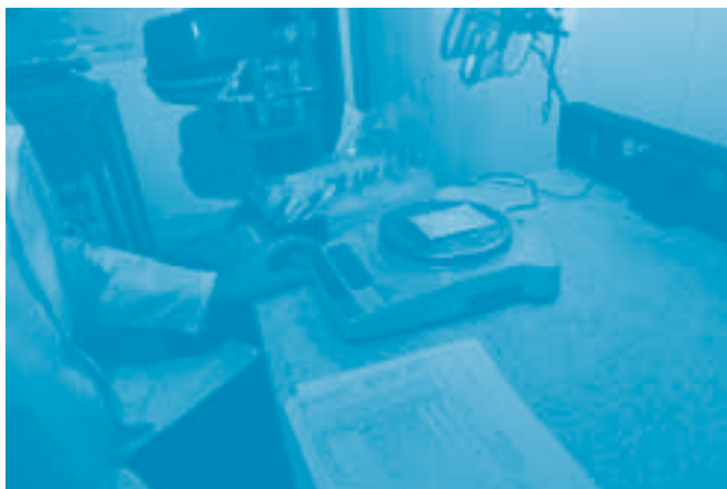
Muestra para análisis instrumental

Para solicitar los servicios debe diligenciar el formato de cadena de custodia diseñado para el manejo de elementos físicos de prueba y enviarlo con un oficio dirigido al Jefe del LABICI a la siguiente dirección: