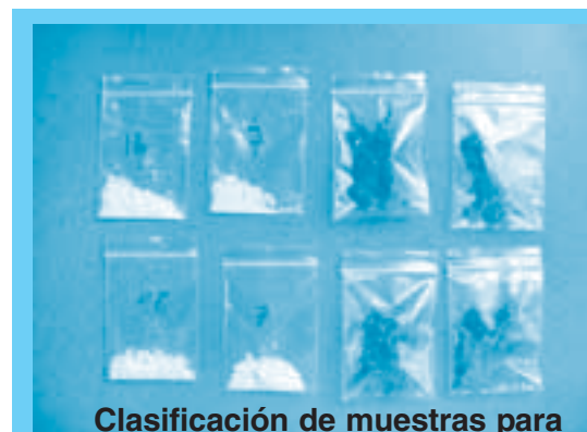
Clasificación de muestras para PIPH

Las inspecciones judiciales incluyen la descripción y clasificación de las sustancias, determinación del peso y/o volumen, la identificación preliminar (PIPH), toma de muestras, rotulado, embalaje y disposición final de remanentes. En todos esos procedi-