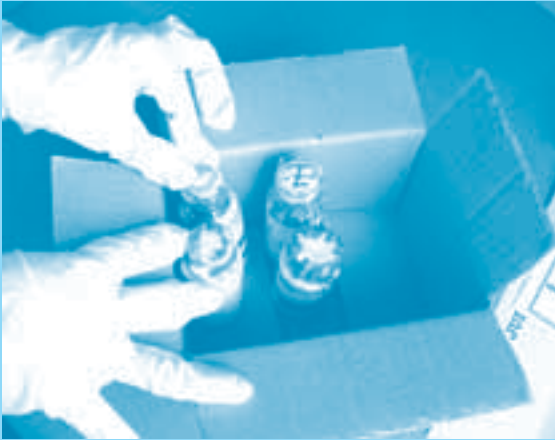
Empacar líquidos en caja de tamaño adecuado

Realizar las pruebas de identificación preliminar correspondientes.