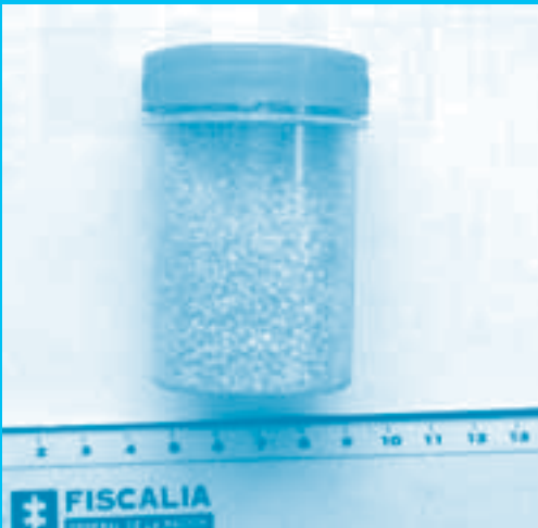
Muestra de ANFO

Nitrato de amonio: Explosivo terciario cuya velocidad de detonación es de 3,2 km/seg. La mezcla de éste con un hidrocarburo ACPM por lo general forma el comúnmente conocido ANFO, cuyas siglas en inglés corresponden a ammonium nitrate fuel oil.