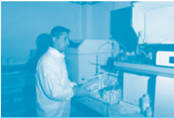
Análisis de residuos de disparo en mano por ICP-MS

deben preservarse libres de cualquier tipo de contaminación en especial la relacionada con metales.