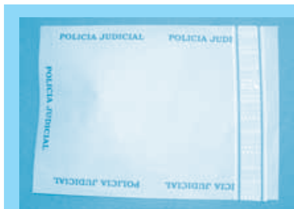
Utilizar sobre de manila, con su banda de seguridad

La autoridad competente entregará oportunamente con la seguridad que amerita los elementos materia de prueba al laboratorio del Estado, para la práctica de la prueba pericial.