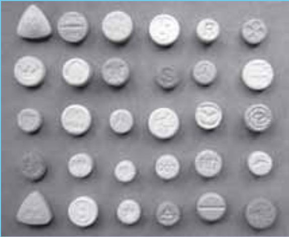
Pastillas de Extasis

Por lo general, las muestras son recolectadas en el lugar de los hechos mediante inspección judicial y luego de realizada la prueba preliminar, estas muestras junto con su registro de cadena de custodia son enviadas al área de química aplicada para su plena identificación, la cual se realiza mediante la aplicación de pruebas físicas (ph, color, apariencia, solubilidad), químicas (formación de precipitados coloreados, oxidación-reducción) cromatografía en capa delgada y análisis instrumental.