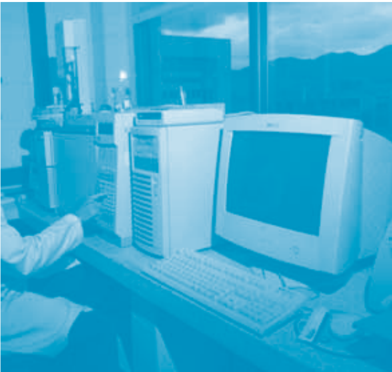
Cromatógrafo de Gases - Masas