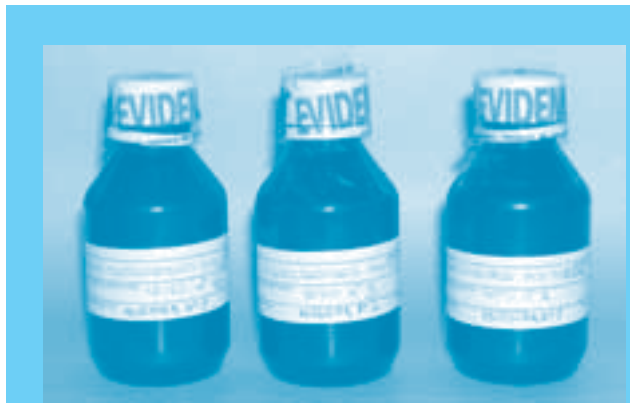
Empacar cada muestra y marcarla

Líquidos: Frascos limpios, secos, provistos de tapa y contratapa no reutilizables.