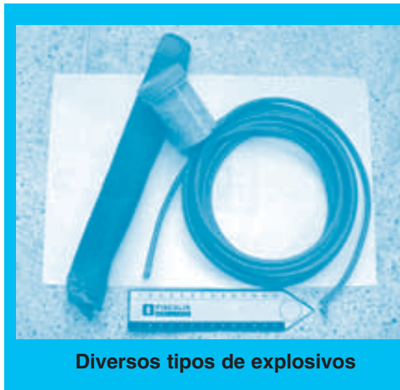
Diversos tipos de explosivos

RDX: Explosivo de alto poder, que se conoce también como exógeno o ciclonita. El nombre químico es ciclo trimetilenetrinitramina y su velocidad de detonación es de 8 km/seg.