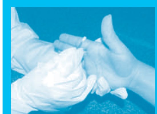
Toma de muestra en dorso derecho

Para la toma de muestras se adoptó el método de hisopos de algodón humedecidos con ácido nítrico diluido, los cuales se analizan en el laboratorio por el método de espectrometría de masa inducida por plasma, ICP- MS.