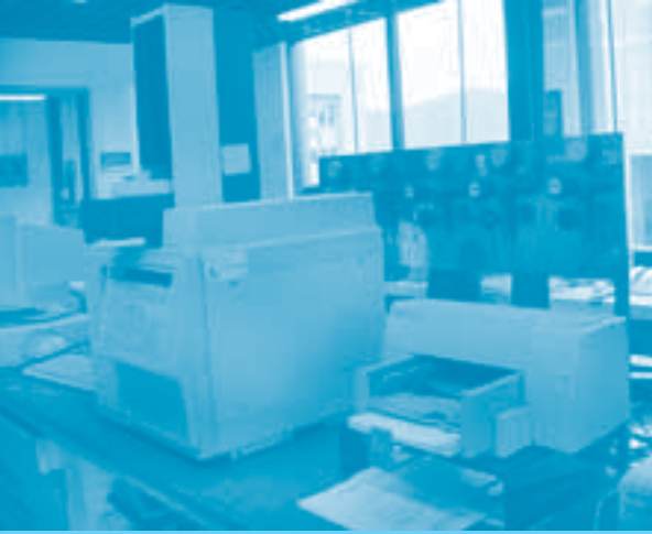
Cromatógrafo de gases para análisis de estupefacientes

Atiende los departamentos de Cauca, Nariño, Huila, Putumayo y Valle del Cauca.