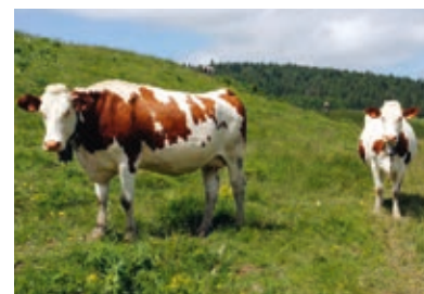
La Montbéliarde dans ses prairies natales du Haut-Jura

Le pâturage est obligatoire tant que les conditions climatiques le permettent et dès que l'herbe est disponible.