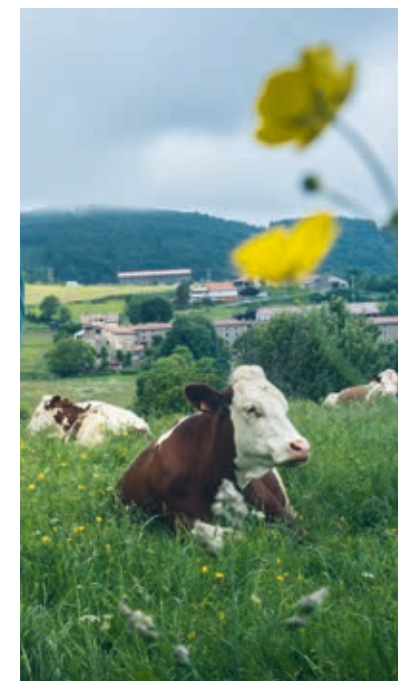
Coquette pâturant dans les prairies du Forez

Alors, nous, producteurs, mettons tout en œuvre pour que nos vaches évoluent dans les meilleures conditions .