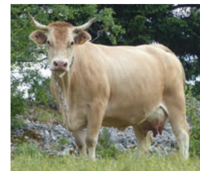
La Villarde, perle du Vercors

D'ailleurs, on les appelle toutes par leur prénom, c'est vous dire si on les bichonne !