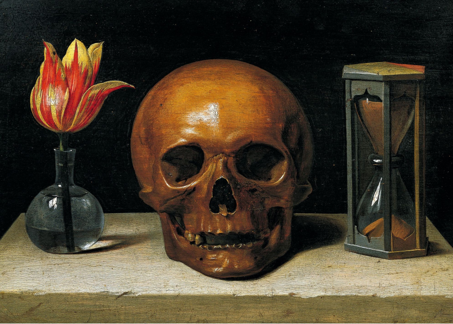
Philippe de Champaigne, Vanité ou allégorie de la vie humaine , 1644