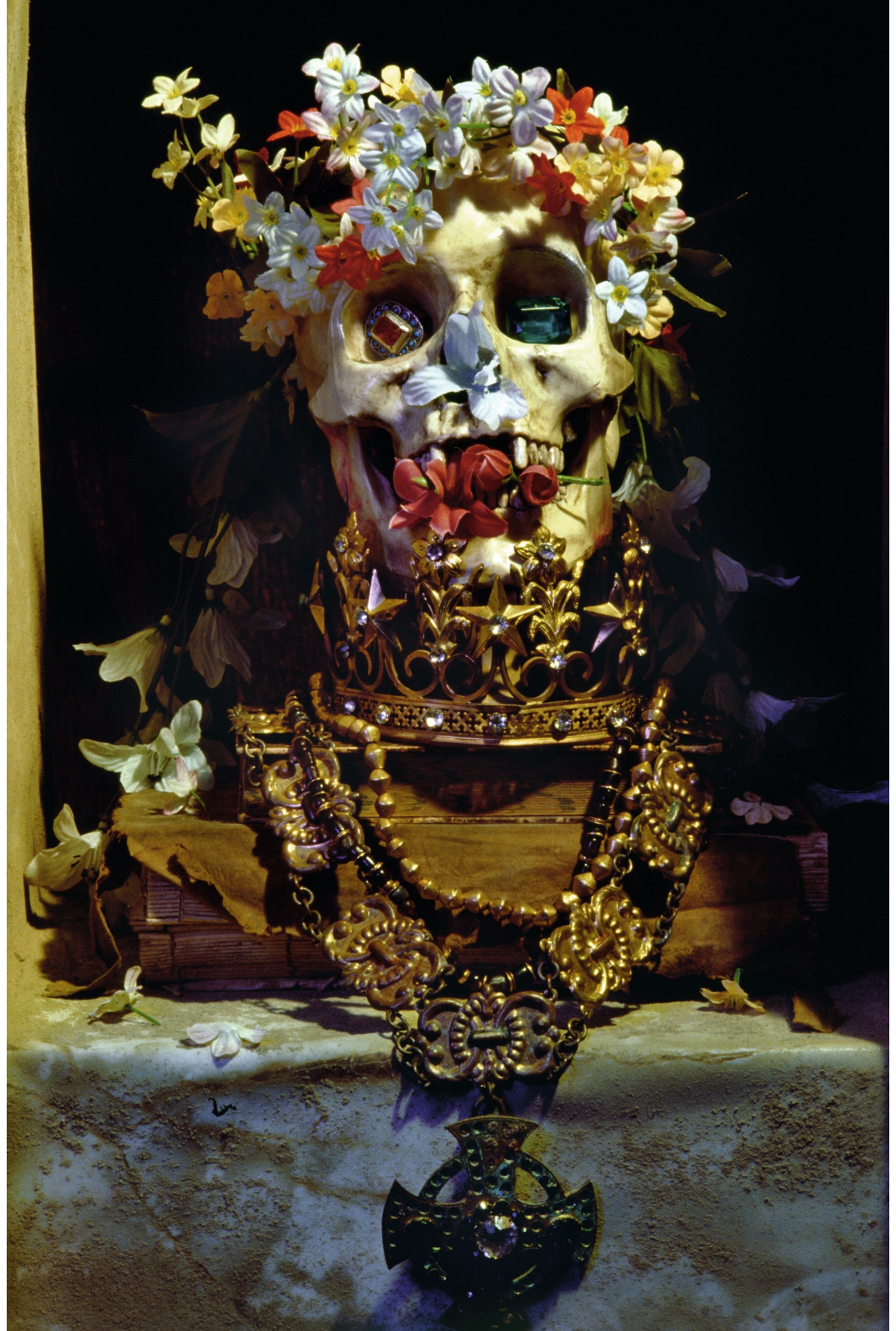
Cindy Sherman, Untitled n°272 , 1992, photographie.