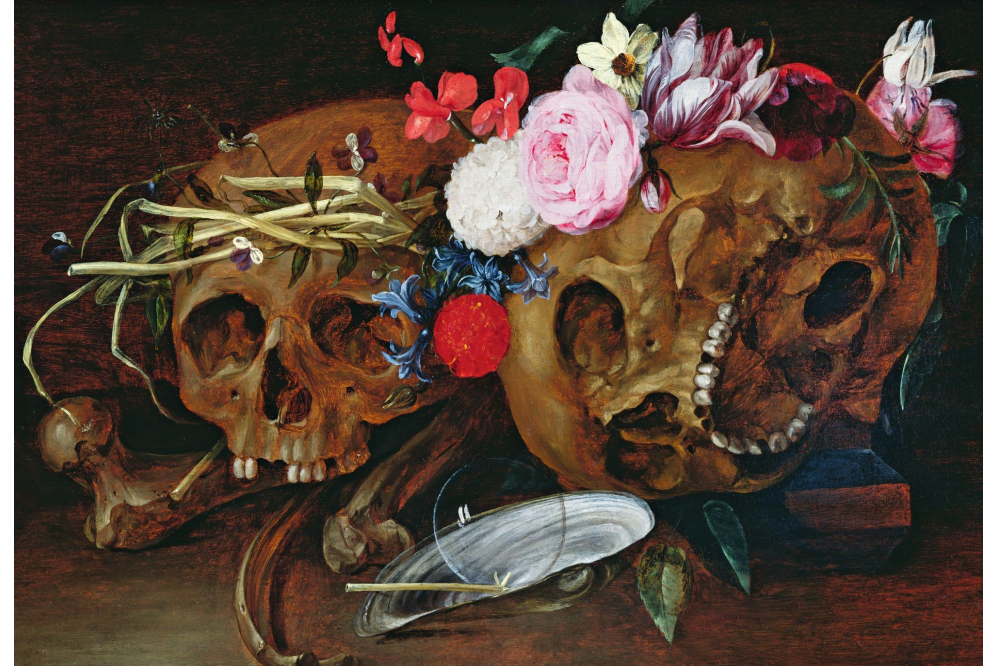
Nicolaes van Veerendael, Vanité , vers 1680,