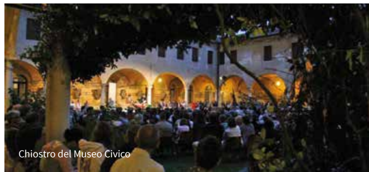
Chiostro del Museo Civico