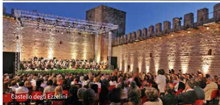
Castello degli Ezzelini