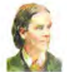
Elena G. de White

El tiempo que el líder pasa con Dios tiene influencia en la iglesia que dirige.