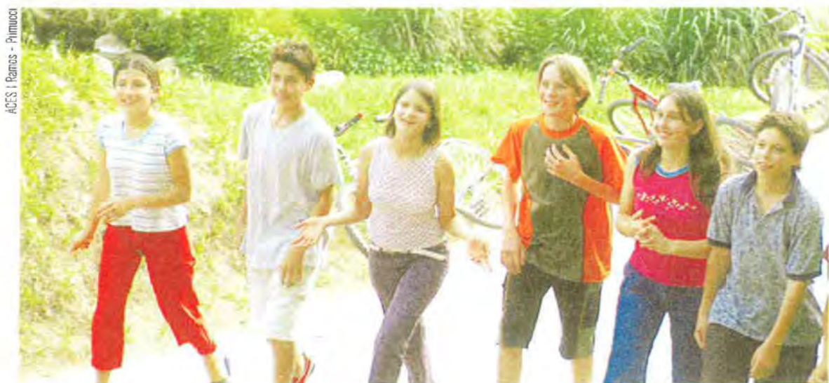
ACES | Ramas - Pimuco