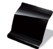
NV676 - Negro Nacré