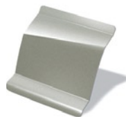
D11 - Beige Pimienta