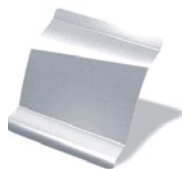
KNH - Gris Estrella