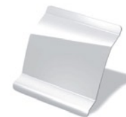
OV369 - Blanco Glaciar