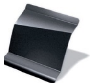
KNS - Gris Cuarzo