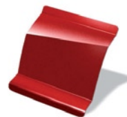
B76 - Rojo Fuego