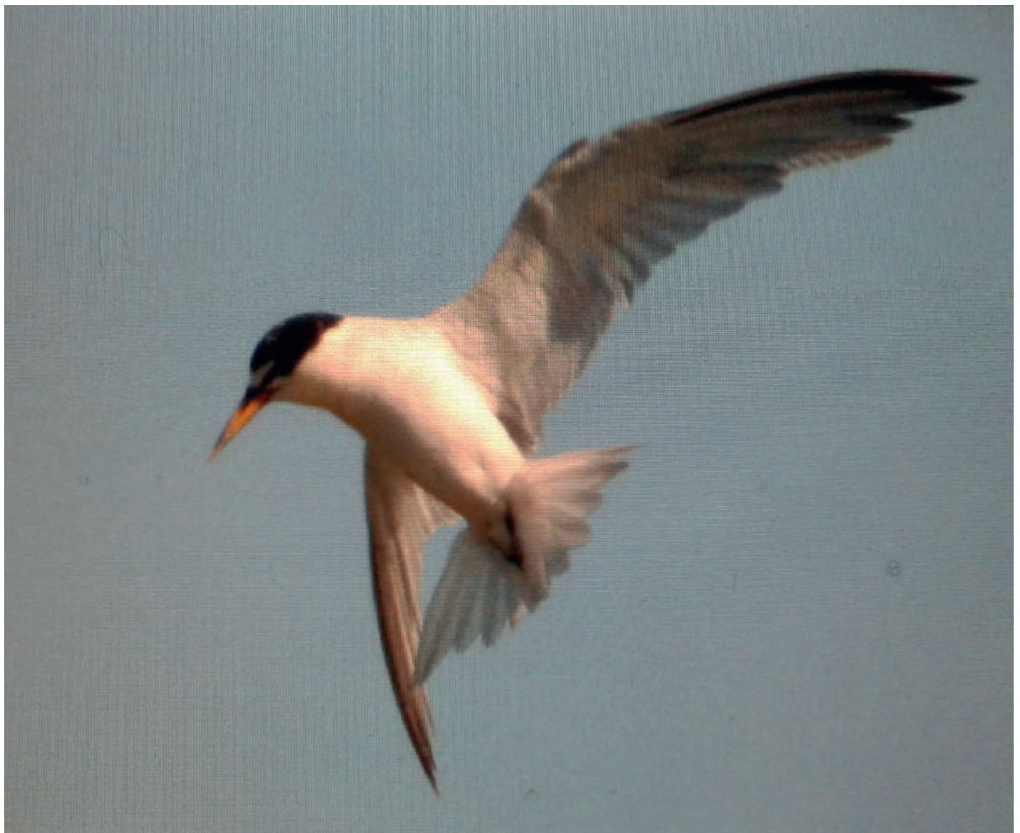
Arriba: Gaviotín chico boreal ( Sternula antillarum ), desembocadura del río Lluta (Reg. Arica y Parinacota), 21 julio 2016, foto Ronny Peredo. Abajo: Gaviotín chico boreal ( Sternula antillarum ), humedal de Pachingo, Tongoy (Reg. Coquimbo), 12 octubre 2016, foto Marcelo Torrejón.