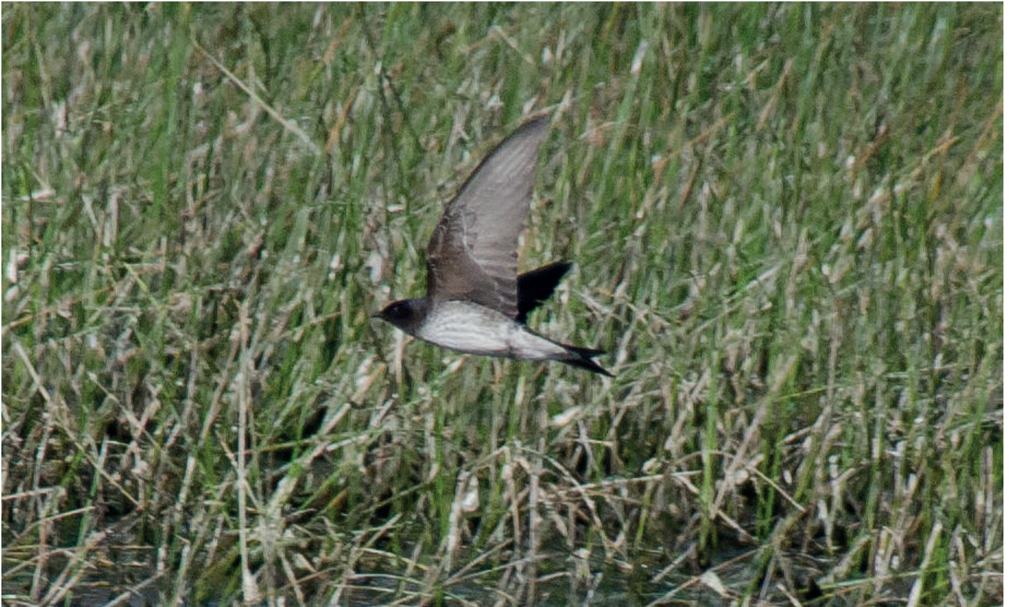
Golondrina doméstica ( Progne chalybea ), desembocadura del río Lluta (Reg. Arica y Parinacota), 27 noviembre 2016, foto Jorge Fuentes.

de la presencia de 1 ejemplar en el humedal de Pachingo, Tongoy (Reg. Coquimbo) el 12.10 (M. Torrejón).