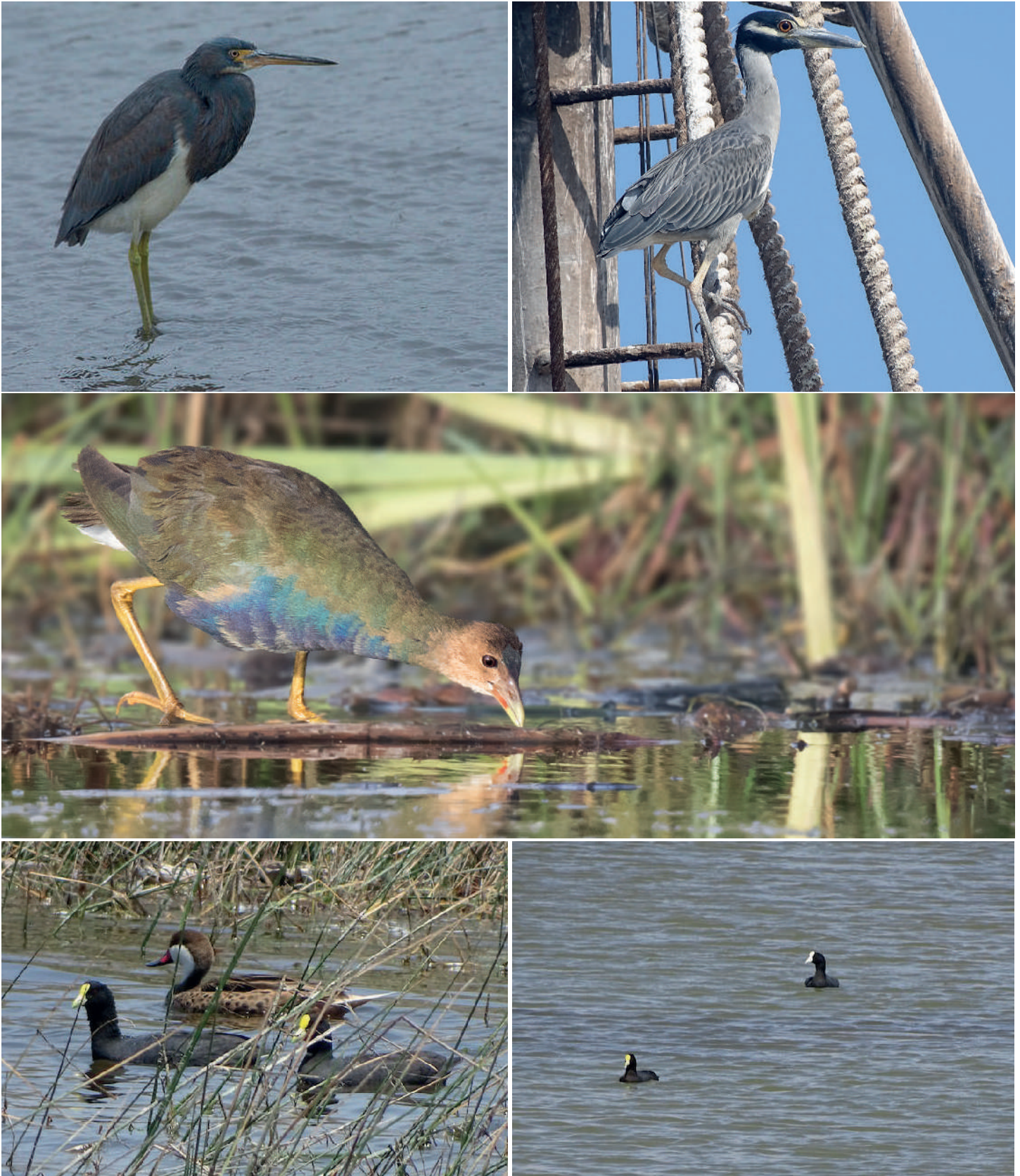
Arriba Izq.: Garza tricolor ( Egretta tricolor ), desembocadura del río Lluta (Reg. Arica y Parinacota), 03 agosto 2016, foto Cristián Pinto. Arriba Der.: Huairavo de corona amarilla ( Nyctanassa violacea ) puerto de Arica (Reg. Arica y Parinacota), 07 agosto 2016, foto Charly Moreno. Centro: Tagüita purpúrea ( Porphyrio martinicus ), desembocadura del río Lluta (Reg. Arica y Parinacota), 27 octubre 2016, foto Pío Marshall. Abajo Izq.: Tagua chica ( Fulica leucoptera ), desembocadura del río Lluta (Reg. Arica y Parinacota), 27 noviembre 2016, foto Charly Moreno. Abajo Der.: Tagua chica ( Fulica leucoptera ), Tranque Sobraya (Reg. Arica y Parinacota), 01 noviembre 2016, foto Charly Moreno.