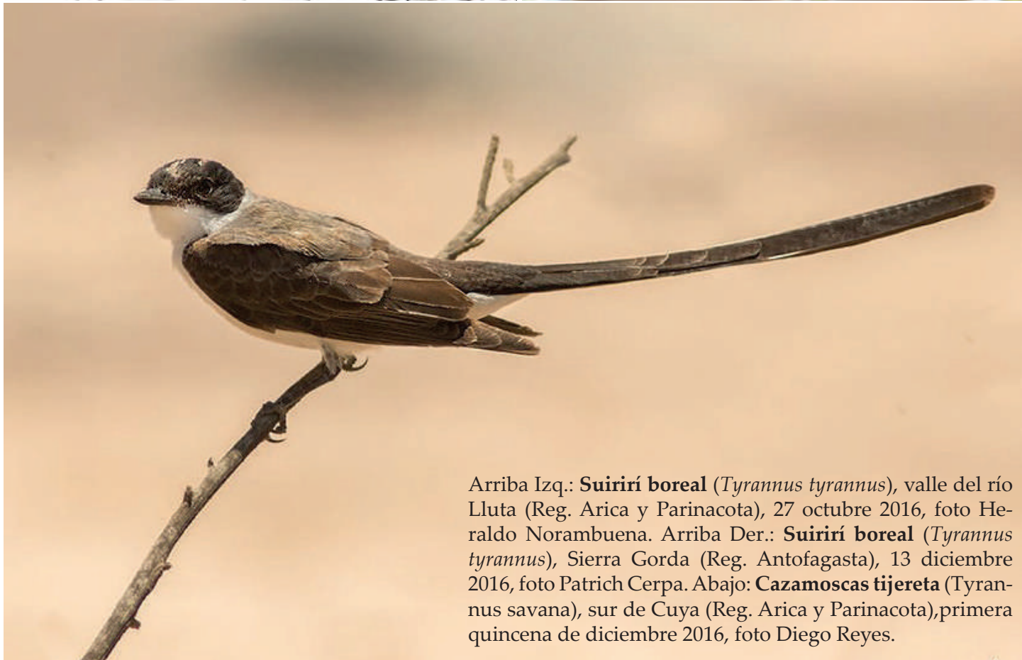
Arriba Izq.: Suirirí boreal ( Tyrannus tyrannus ), valle del río Lluta (Reg. Arica y Parinacota), 27 octubre 2016, foto Heraldo Norambuena. Arriba Der.: Suirirí boreal ( Tyrannus tyrannus ), Sierra Gorda (Reg. Antofagasta), 13 diciembre 2016, foto Patrich Cerpa. Abajo: Cazamoscas tijereta ( Tyrannus savana ), sur de Cuya (Reg. Arica y Parinacota), primera quincena de diciembre 2016, foto Diego Reyes.