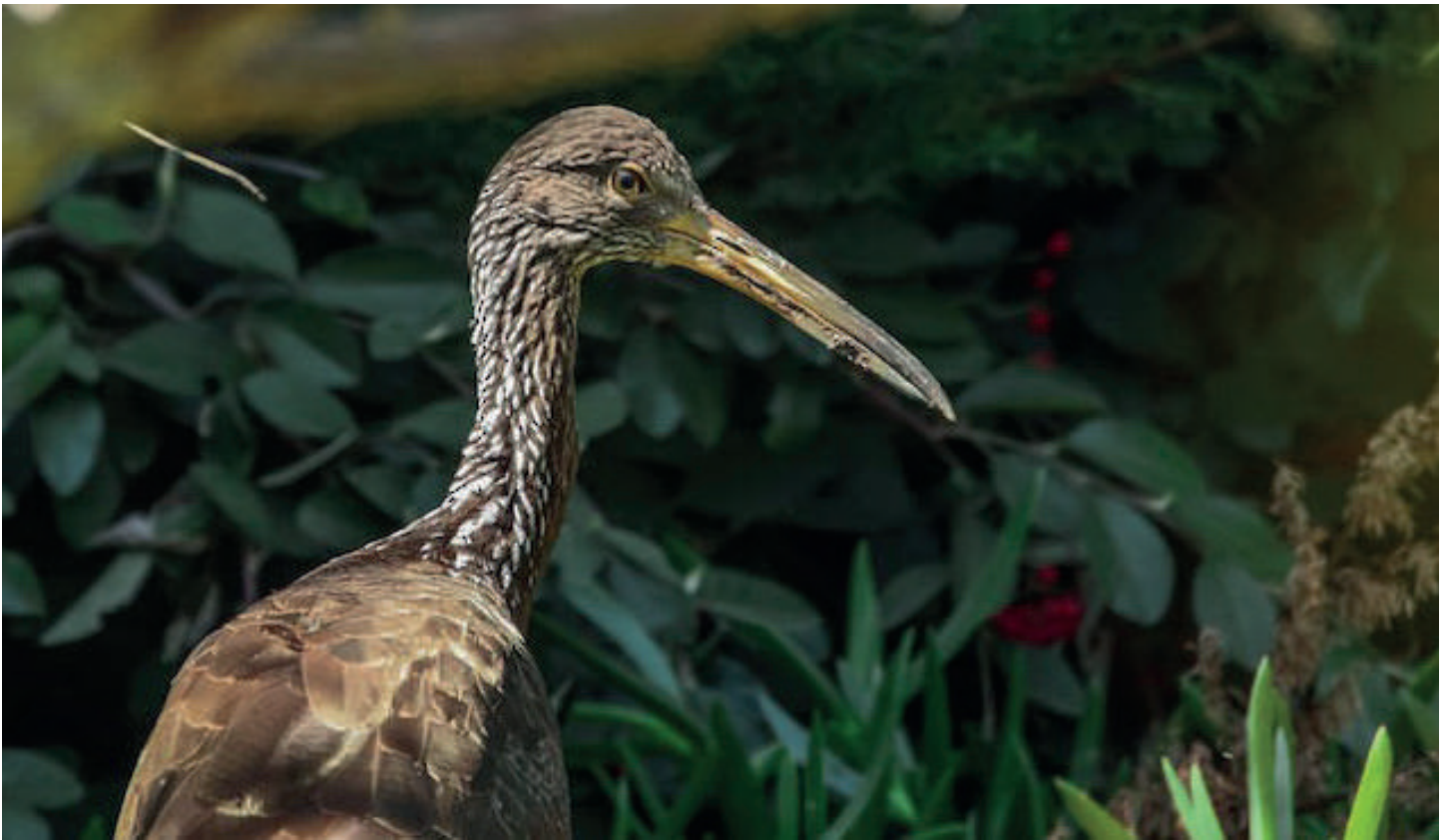
Carau ( Aramus guarauna), Huentelauquén Sur (Reg. Coquimbo), 05 septiembre 2016