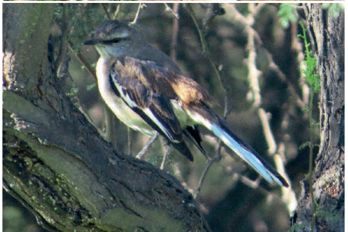
Tenca de alas blancas ( Mimus triurus ). Arriba Izq.: Baquedano (Reg. Antofagasta), 16 julio 2016, foto Charly Moreno. Arriba Der.: Isla Choros (Reg. Coquimbo), 14 noviembre 2016, foto César Chávez. Centro Izq.: Embalse La Laguna (Reg. Coquimbo), 19 noviembre 2016, foto Marcelo Olivares. Centro Der.: La Colorada (Reg. Coquimbo), 19 noviembre 2016, foto Marcelo Olivares. Abajo Izq.: Colina (Reg. Metropolitana), 15 agosto 2016, foto Jean Paul de la Harpe. Abajo Der.: Calle Tobalaba, La Reina (Reg. Metropolitana), 24 septiembre 2016, foto Juan Pablo Gabella.