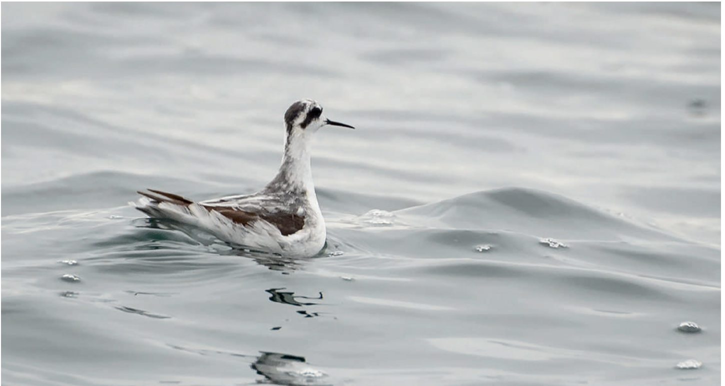
Pollito de mar boreal ( Phalaropus lobatus ), salida pelágica frente a Arica (Reg. Arica y Parinacota), 07 agosto 2016, foto Andrés Puiggros.

(Reg. Arica y Parinacota) entre el 05 y 15.12 (F. Medrano, H. Norambuena, V. Araya, J. Fuentes, C. Gutiérrez, Ch. Moreno, A. Puiggros, F. Schmitt, M.J. Valencia).