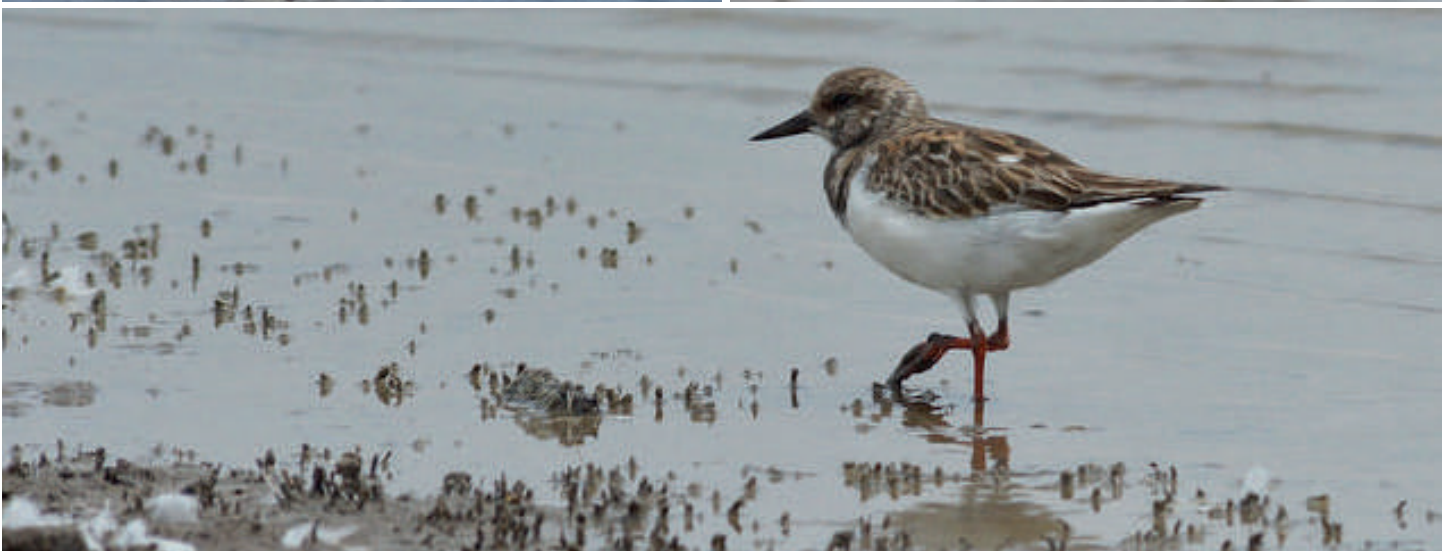
Arriba Izq.: Chorlo de la puna ( Charadrius alticola ), humedal de Los Choros (Reg. Coquimbo), 25 septiembre 2016, foto Freddy Olivares. Arriba Der.: Playero canela ( Calidris subruficollis ): 1 ejemplar está presente en la desembocadura del río Lluta (Reg. Arica y Parinacota), 06 diciembre 2016, foto Fabrice Schmitt. Centro Izq.: Playero occidental ( Calidris mauri ), desembocadura del río Lluta (Reg. Arica y Parinacota), 08 diciembre 2016, foto Charly Moreno. Centro Der.: Playero occidental ( Calidris mauri ), humedal de Los Choros (Reg. Coquimbo), 25 septiembre 2016, foto Freddy Olivares. Abajo: Playero vuelvepiedra ( Arenaria interpres ), laguna de Batuco (Reg. Metropolitana), 25 noviembre 2016, foto Cristián Pinto.