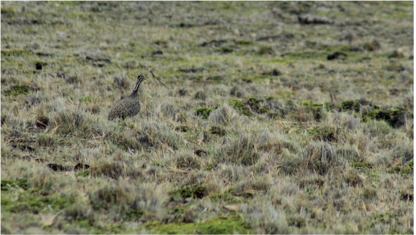
Perdiz austral ( Tinamotis ingoufi), camino a Punta Delgada, San Gregorio (Reg. Magallanes), 19 septiembre 2016