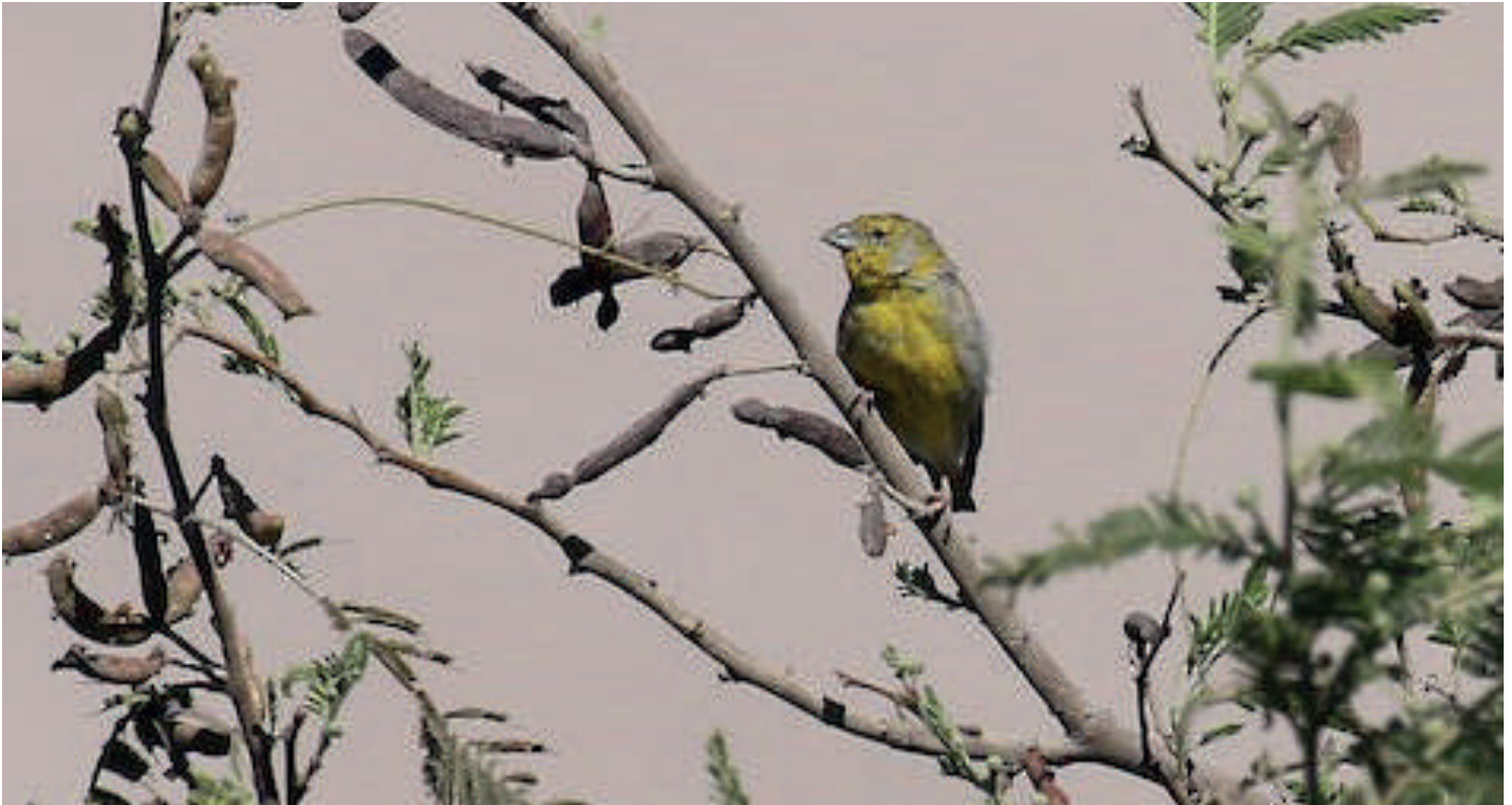
Chirihue de Raimondi ( Sicalis raimondii ), valle de Chaca (Reg. Arica y Parinacota), 16 noviembre 2016, foto Fabrice Schmitt.

de Chaca (Reg. Arica y Parinacota) el 30.12 (Ch. Moreno).