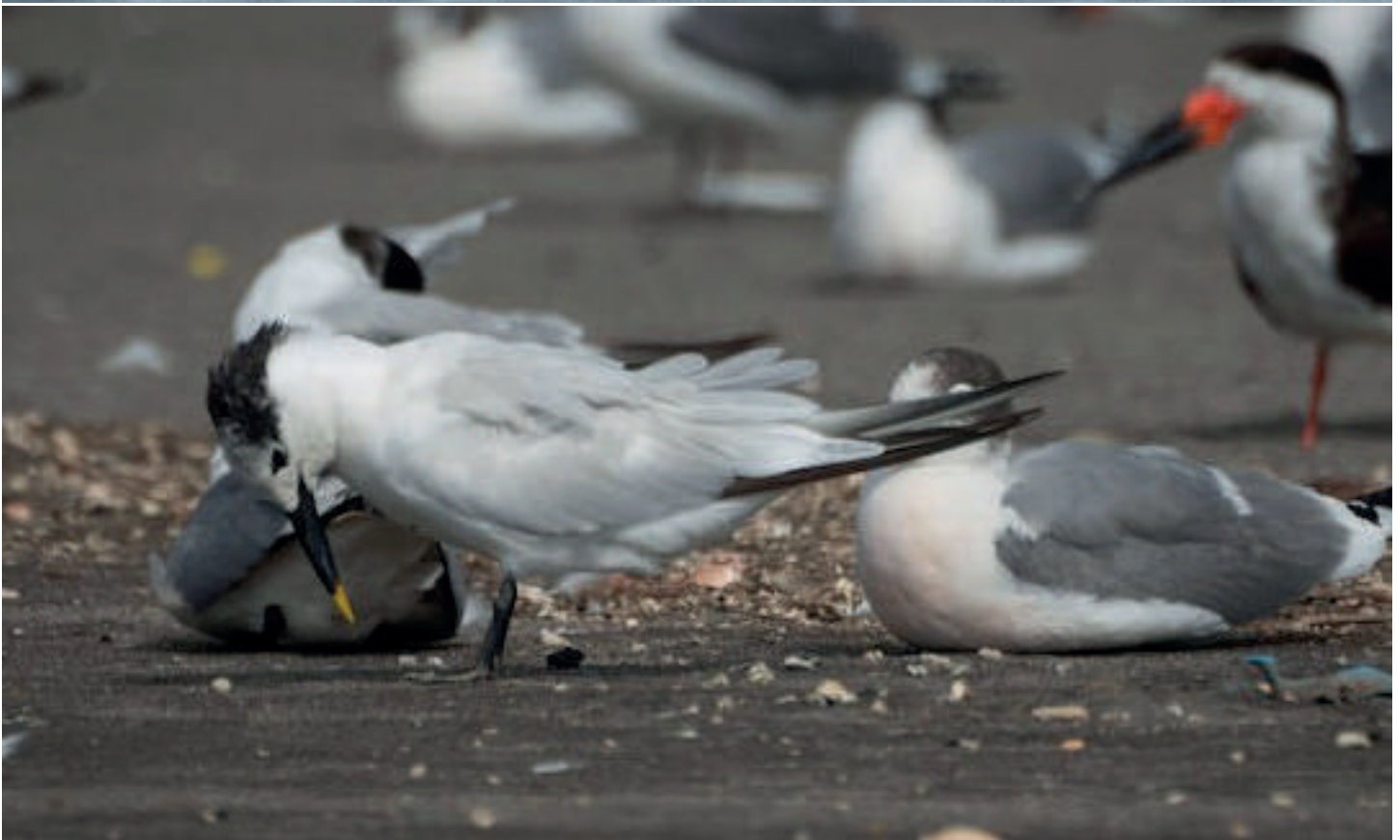
Arriba: Gaviotín negro ( Chlidonias niger ), salida pelágica frente a Arica (Reg. Arica y Parinacota), 22 octubre 2016. Abajo: Gaviotín de Sandwich ( Thalasseus sandwicensis ), desembocadura del río Maipo (Reg. Valparaíso), 04 diciembre 2016.