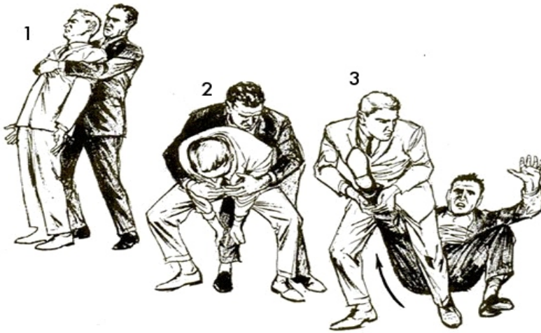
teknika te vete-mbrojtjes – 'perqafimi i ariut' dhe terheqja e kembes