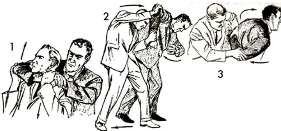
teknika te vete-mbrojtjes – shpetimi nga mbytyja nga prapa