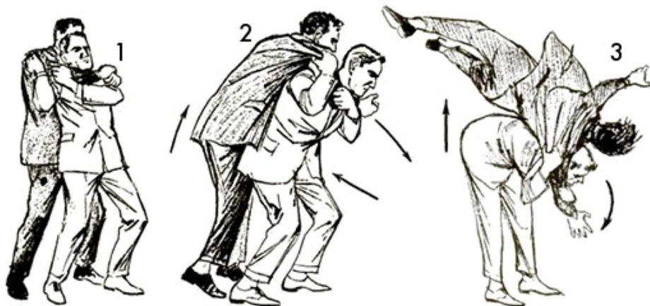
teknika te vete-mbrojtjes – sulmi nga prapa dhe krahe-supi