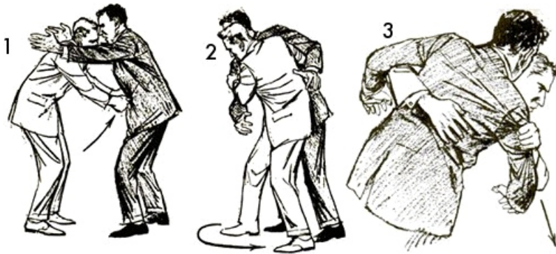
teknika te vete-mbrojtjes – koshi-guruma ose oki-goshi