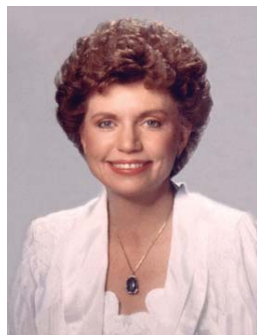
Elizabeth Clare Prophet