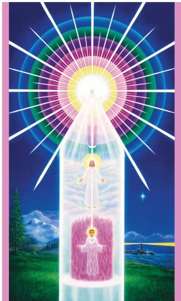
Tu Ser Divino