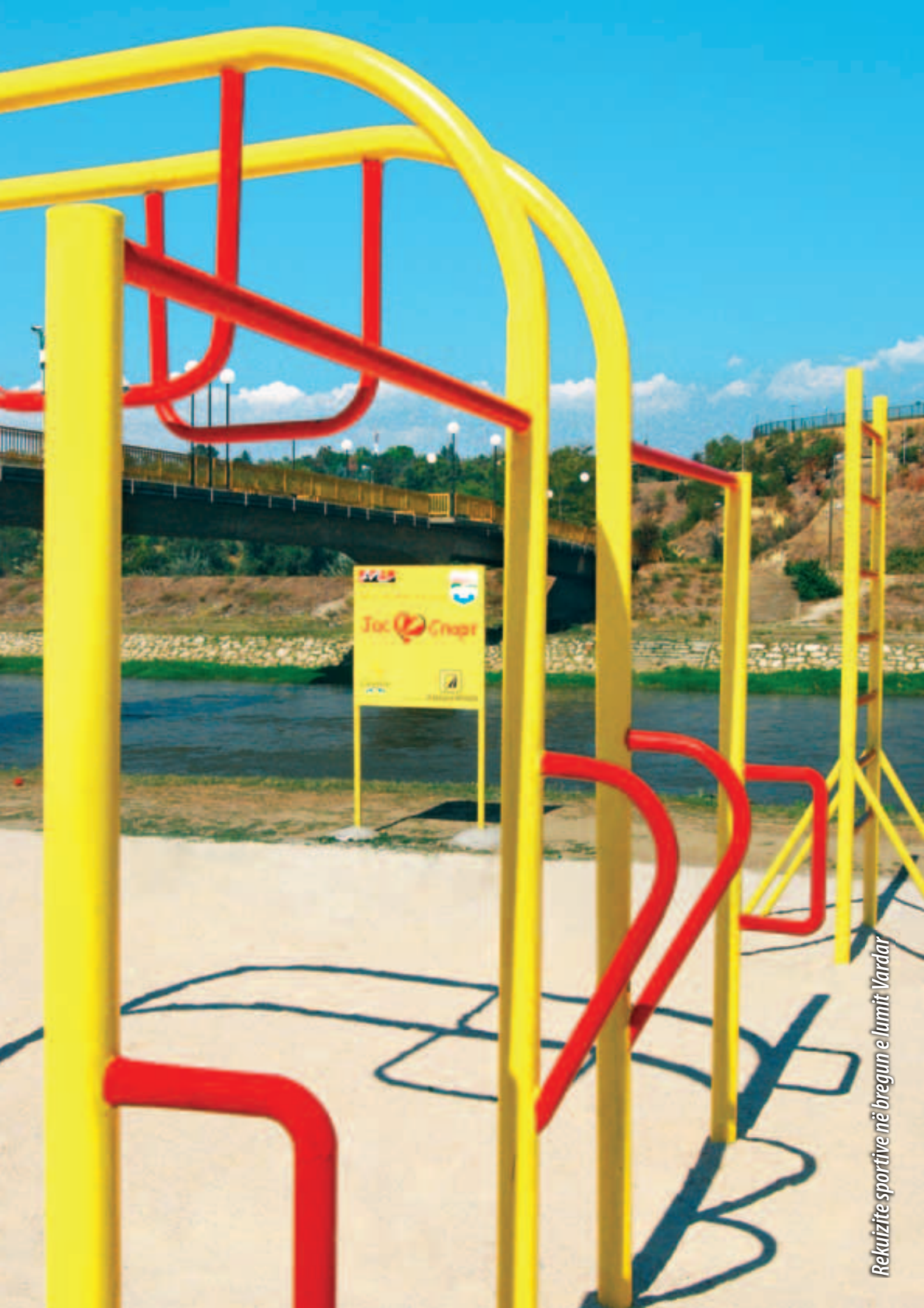
Rekuzite sportive në bregun e lumit Vardar