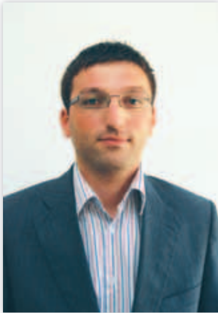
Shkruan Sasho Stefanovski

Të nderuar, ky është vizioni i cili po bëhet realitet vitet e fundit dhe shikohet në çdo hap, në çdo kënd të Shkupit tonë. Shkupi ndërtohet!