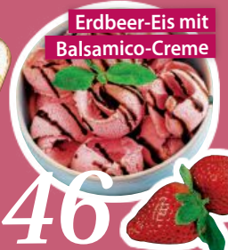
Erdbeer-Eis mit Balsamico-Creme