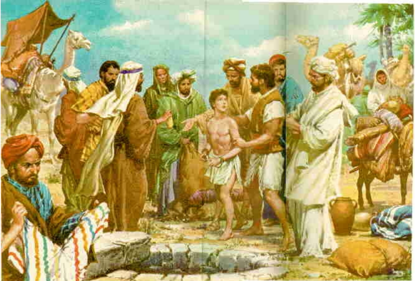
Fig. José es vendido por sus hermanos

El caso de Tina, la hija de Jacob que quiso tener más contacto con el mundo y sus amigas de ahí y fue ultrajada, (2 Samuel 13:1-9) Tamar la hija del Rey David fue violada por su hermano quien confundió el amor por una pasión mal enfocada, dañando la vida de Tamar y marcando su vida.