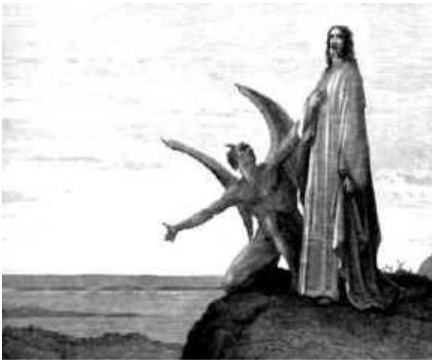
Jesús igual fue atormentado, pero venció con la palabra de Dios

El adversario de nuestra vida (Satanás) desde el comienzo de la vida ha querido destruir la obra magna de Dios (el hombre). Los métodos que ha usado han sido múltiples, pero su ataque principal ha sido al alma del hombre.