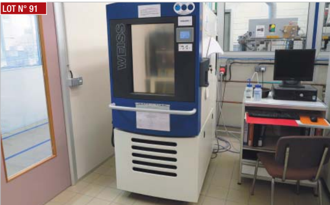
► Enceinte climatique WEISS, type WK3-180/40/5, année 2013 ► Climatic enclosure WEISS, type WK3-180/40/5, year 2013