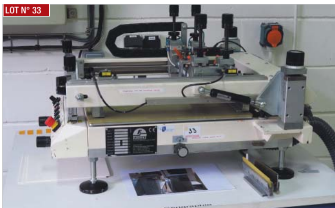
LOT N° 33