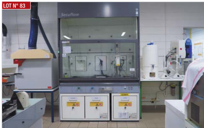
► Sorbonne WALDNER SERIFLOW CHIMIE, année 2013 ► Extractor, WALDNER SERIFLOW CHIMIE, year 2013