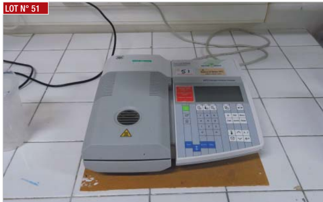
► Balance METTLER TOLEDO, type HR73 ► Scale, METTLER TOLEDO, type HR73