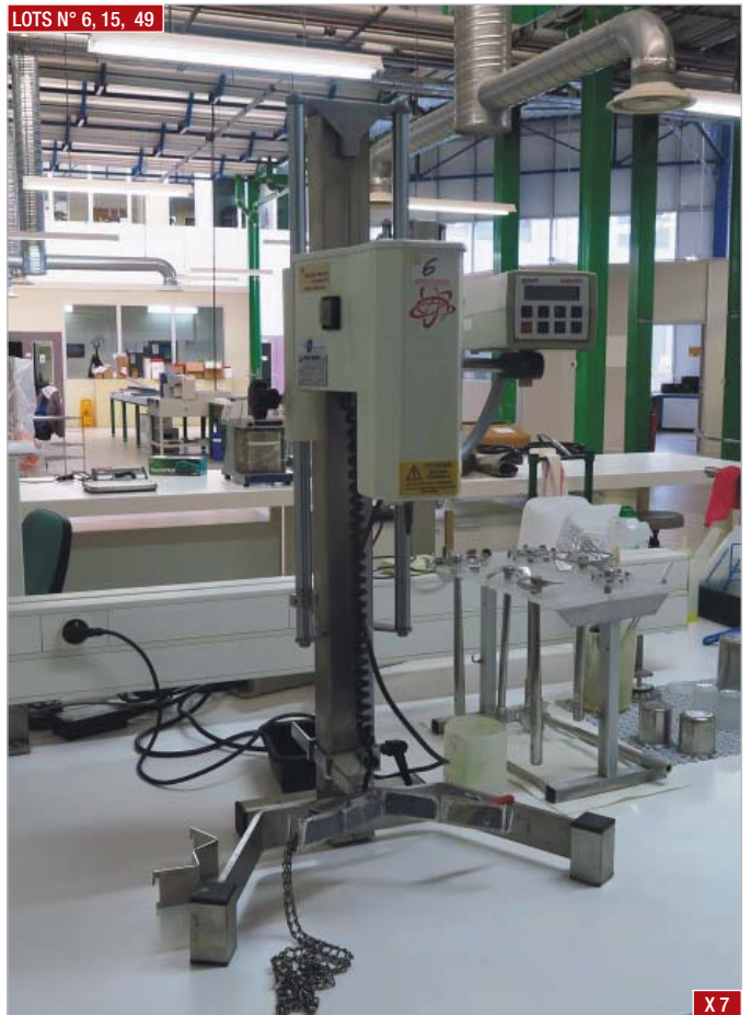
► Agitateur RAYNERIE TURBOTEST , type 33/300 ► Stirrer, RAYNERIE TURBOTEST , type 33/300