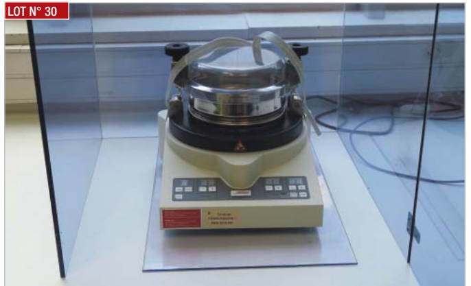
► Tamiseuse vibrante analysette 3 FRITSCH, année 2016 ► Vibrating analysis sieve, 3 FRITSCH, year 2016