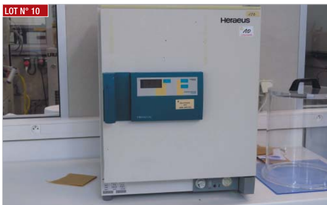
LOT N° 10