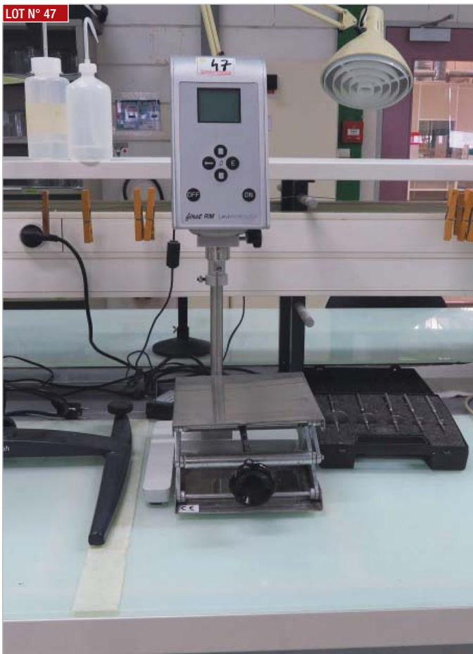
► Viscosimètre LAMY RHEOLOGY, modèle First RM ► Viscosimeter, LAMY RHEOLOGY, model First RM