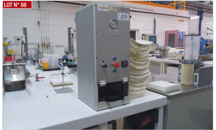
► Presse humide formette NOVI PROFIBRE, type N2001, année 2016 ► Wet form press NOVI PROFIBRE, type N2001, year 2016