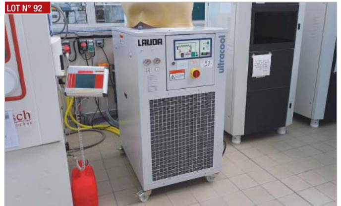
► Groupe froid LAUDA ULTRACOOOL CHILLER, année 2012 ► Cooling unit, LAUDA ULTRACOOOL CHILLER, year 2012