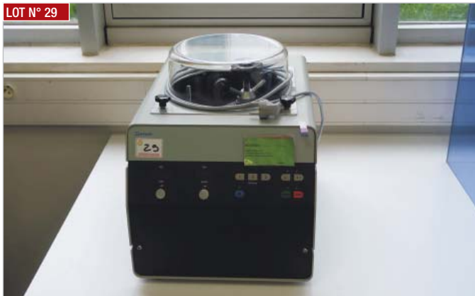
► Broyeur centrifuge RETSCH S100 ► Centrifugal crusher, RETSCH S100