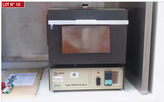
► Four à cendres THERMOLYNE, type 6000 FURNACE, cap. 1100° C, année 1987 ► Ash furnace, THERMOLYNE, type 6000 FURNACE, cap. 1100°C, year 1987