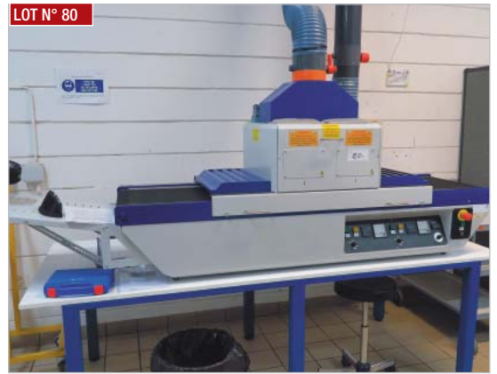
► Tunnel UV TECHNIGRAF , type UTS1074, année 2012 ► UV tunnel, TECHNIGRAF , type UTS1074, year 2012