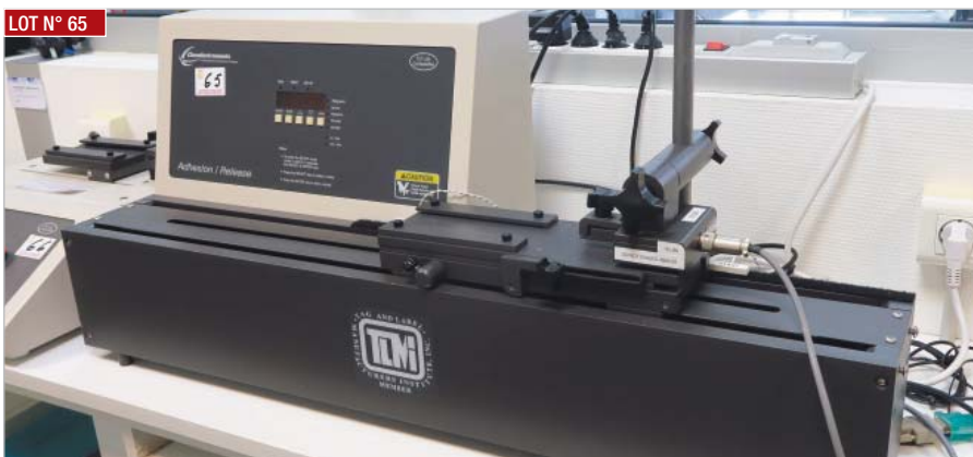
LOT N° 65