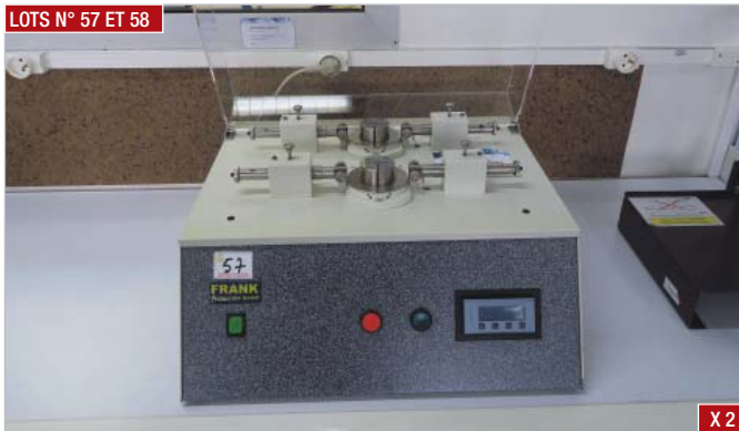
► Machine double plis agrafes SHOPPER FRANCK , type 13505FD000, année 2004 ► Double staple ply machine, SHOPPER FRANCK , type 13505FD000, year 2004