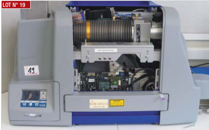
► Graveuse laser IXLA100 plus, année 2014 ► Laser writer, IXLA100 plus, year 2014