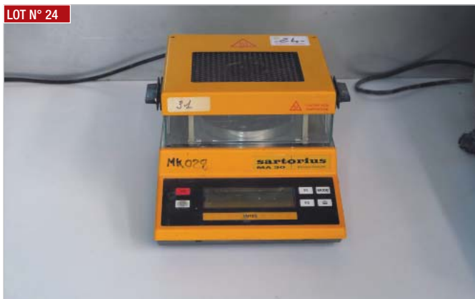
► Balance thermique SARTORIUS, type MA30 ► Thermal scale, SARTORIUS, type MA30