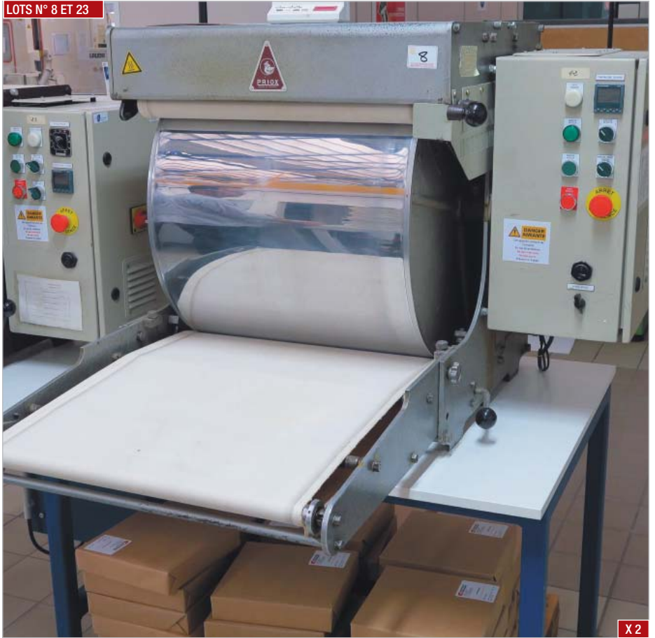
► Glaceuses PRIOX C60 et F52 ► Glazing units, PRIOX C60 and F52