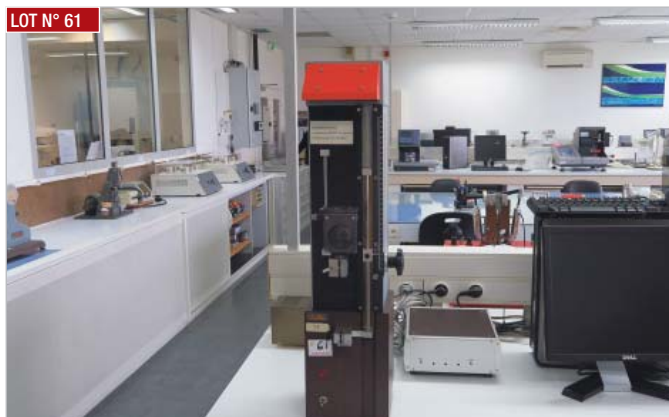
LOT N° 61