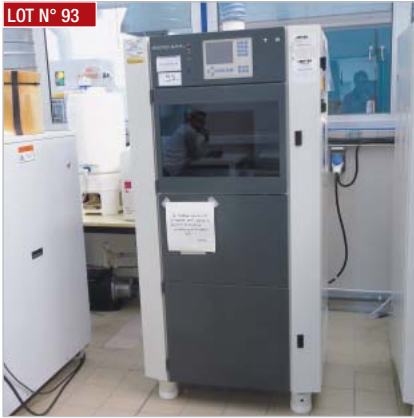
► Xenotest, type ALPHA+, année 2010 ► Xenotest, type ALPHA+, year 2010