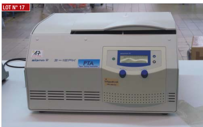
LOT N° 17