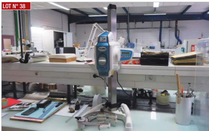
► Agitateur RAYNERIE TURBOTEST , type V2004, année 2014 ► Stirrer, RAYNERIE TURBOTEST , type V2004, year 2014