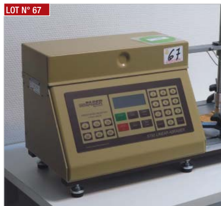
LOT N° 67