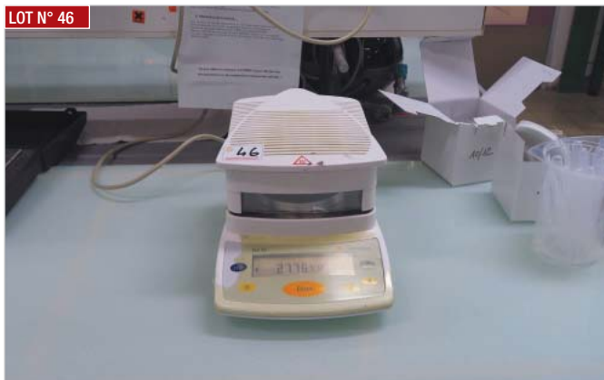
► Balance SARTORIUS, type MA-45 ► Scale, SARTORIUS, type MA-45