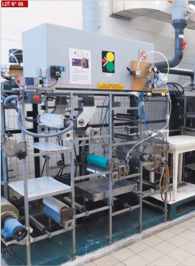
► Coucheuse pilote DIXON ► Pilot coating unit, DIXON