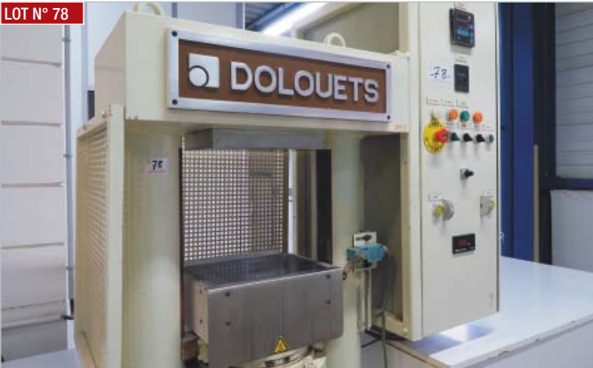
► Presse DOLOUETS ► Press, DOLOUETS