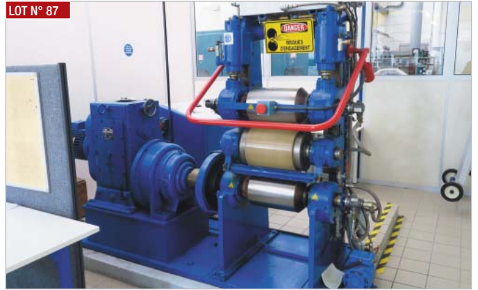
► Calandre REPIQUET avec poste de commande type MRUATP4 ► Grille, REPIQUET with command post type MRUATP4