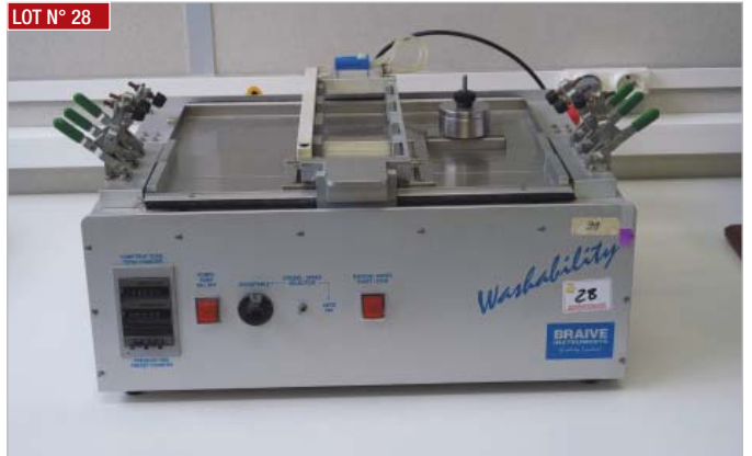
► Appareil pour tester l'abrasion WASHABILITY BRANE INSTRUMENTS ► Abrasion testing device, WASHABILITY BRANE INSTRUMENTS