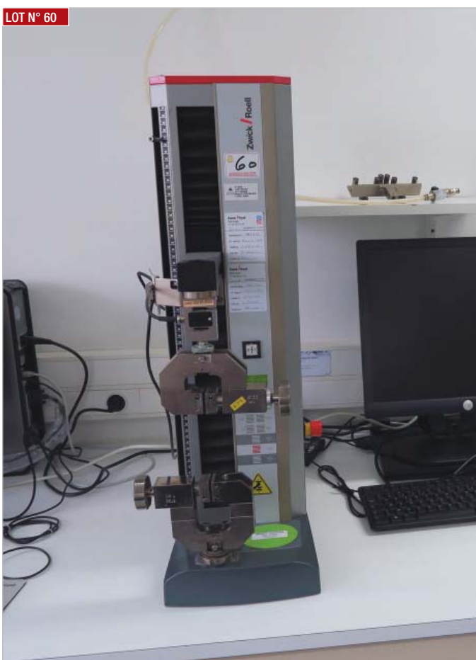
LOT N° 60