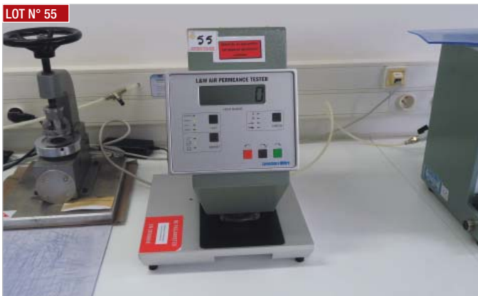
► Porosimètre L&W AIR 167 PERMEANCE TESTEUR ► Permeance tester, L&W AIR 167 PERMEANCE TESTER