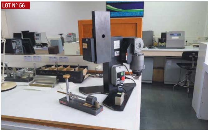
► Paper automatique CRUMPLER MKII avec 3 appareils CRUMPLING ► Automatic paper CRUMPLER MKII with 3 CRUMPLING devices