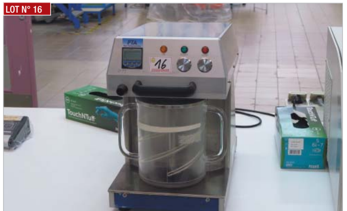
► Désintégrateur PTA ► Disintegrator, PTA