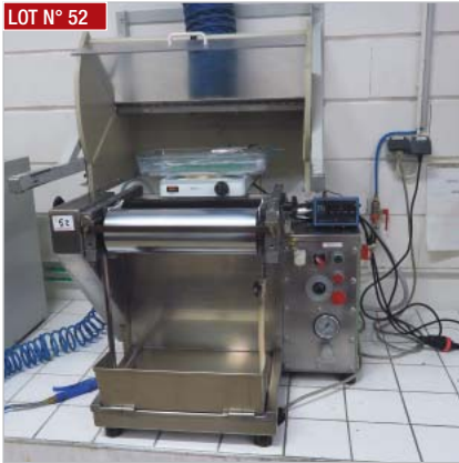
► Size press ERNST BENZ AG ► Size press, ERNST BENZ AG