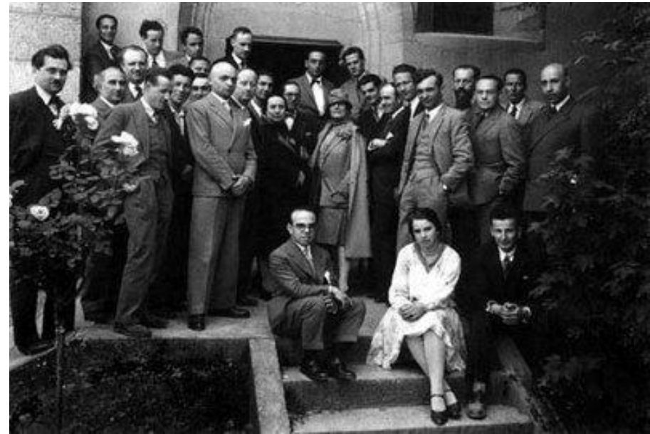
Reunión por invitación de Madame Mandrot en su Castillo de la Sarraz (Suiza).