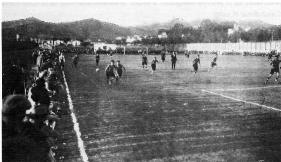
Vista del camp de la Rambla durant un partit. Al fons, d'esquerra a dreta, dipòsit del Sagrat Cor, cases del carrer Font, can Piquet i pins de can Meliton. (Reproduïda de l'obra Llibre d'Or del Futbol Català , Edició 1928).

de 1939, en els magatzems de «Fills de Magí Campreciós» es trobaven algunes d'aquestes peces ja que, com gairebé sempre acaben aquestes històries, no se'n va saber mai més res del propietari ja que no havien estat pagades.