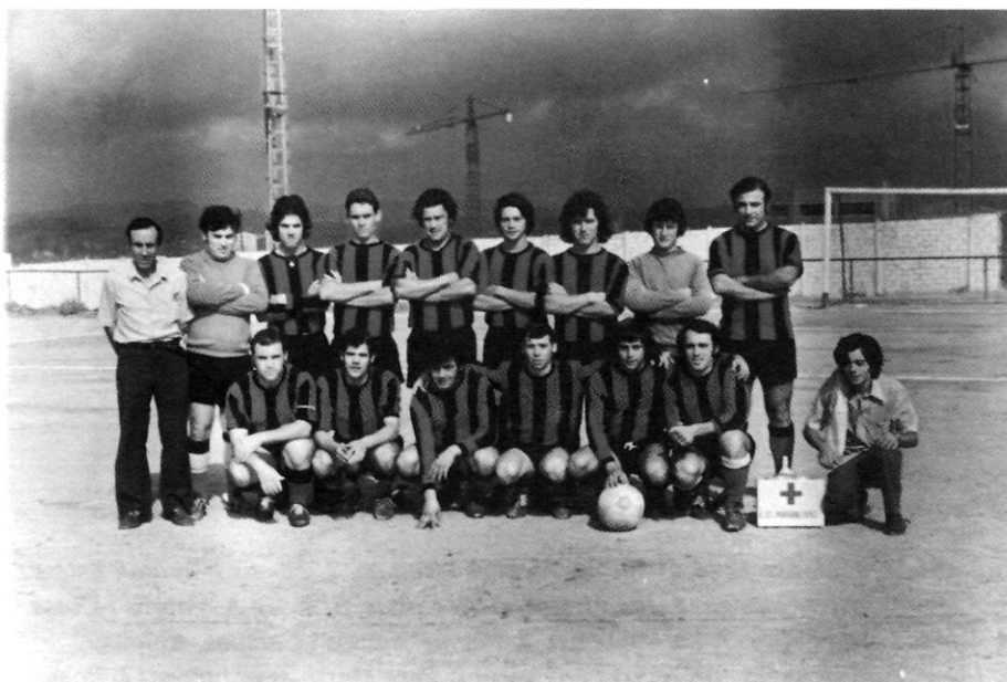
Arrabalense (Recreatiu). 1r. equip temporada 1974-1975.