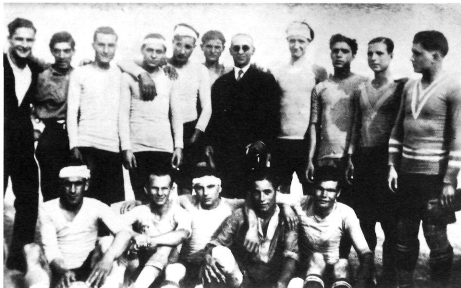
Camp de la Rambla. "Unió Esportiva Sant Just-Esplugues".

Al l'equip que jugava en el camp de la Rambla col.laboraven jugadors d'Esplugues, la qual cosa va permetre, o potser aconsellar, la formació d'un equip conjunt sota la denominació de «Unió Esportiva Sant Just-Esplugues», amb tanta activitat que li valgué la seva inscripció en el Llibre d'Or del Futbol Català (edició 1928), on figuren dues pàgines en bilingüe i dues fotografies (pàg. 334/5).