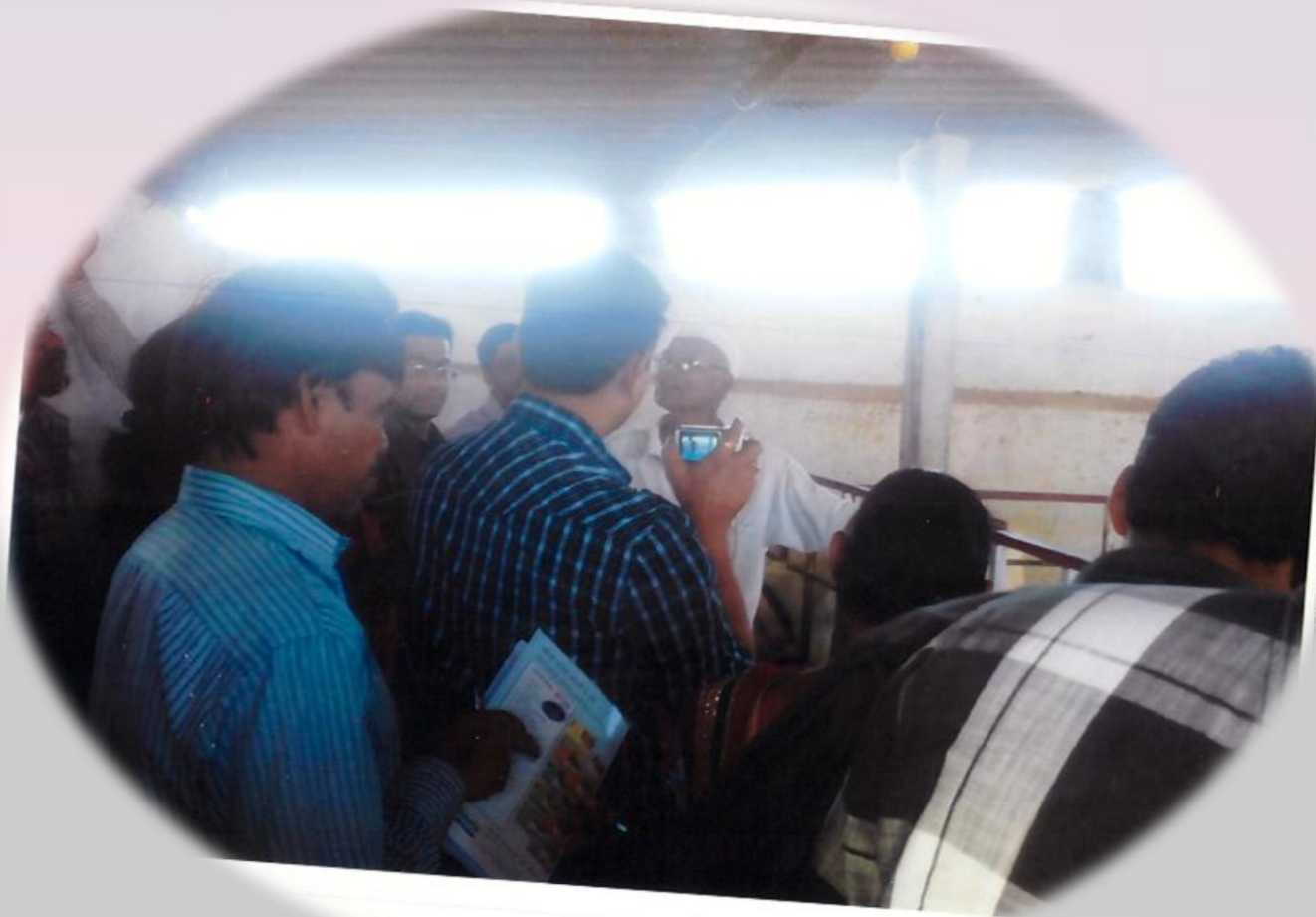
Visitors from MITCON Pune at Farm