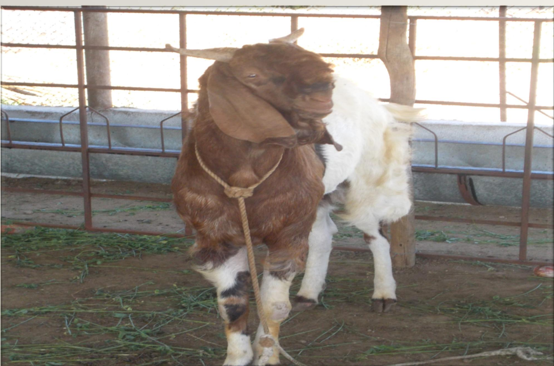
Boar Male 11 months Weight 75 kg