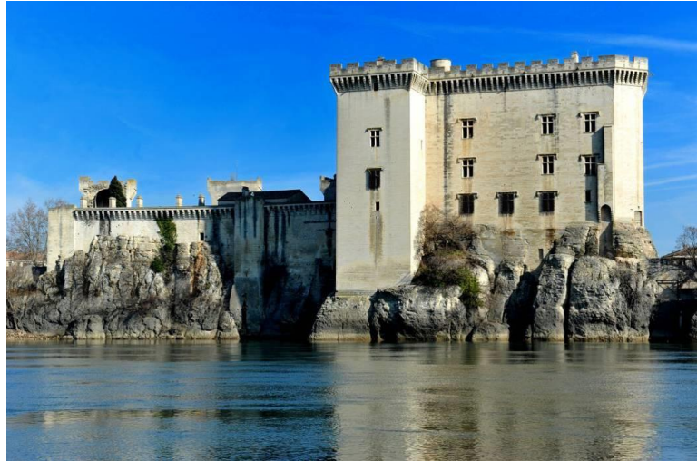
Vue de la façade du château, côté Rhône