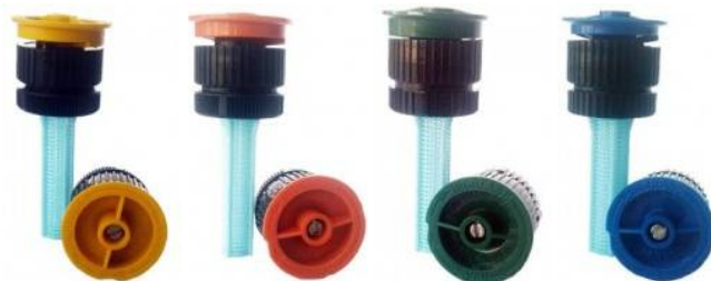
P10004 P10006 P10008 P1001001