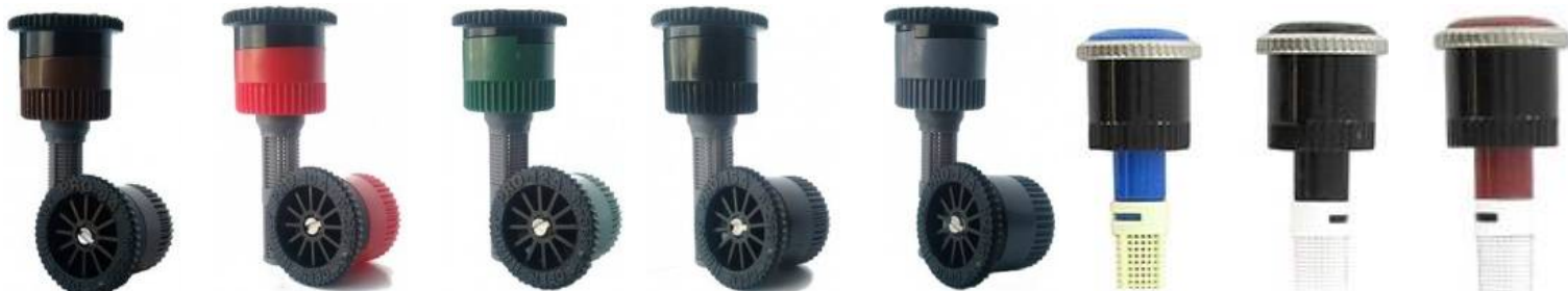
8A 10A 12A 15A 17A MP1000210 MP2000210 MP3000210