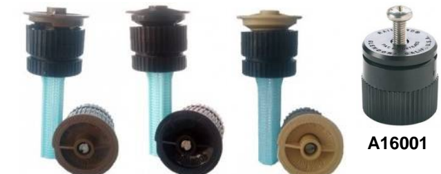
P1001201 P1001501 P10018 A16001