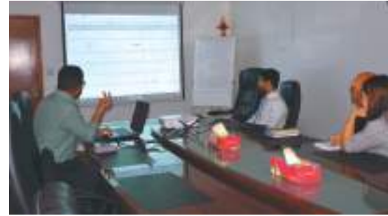
الورش التدريبية في شركة ناس للخدمات اللوجستية