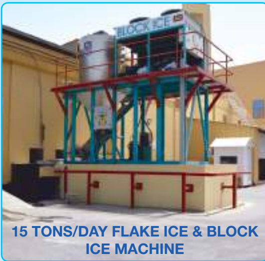
15 TONS/DAY FLAKE ICE & BLOCK ICE MACHINE

The device is clean & Hygienic, Fast & Easy useful, produces both Flake & Block Ice. No Mould & No Glycol. Changeable Ice Dimensions, New Desing & New Ice Technology.