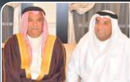
RAMADAN AT "THE MAJLIS"