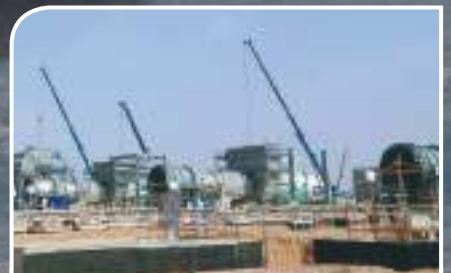
NIS POWER PLANT IN DHURMMA TO BE DELIVERED ON SCHEDULE