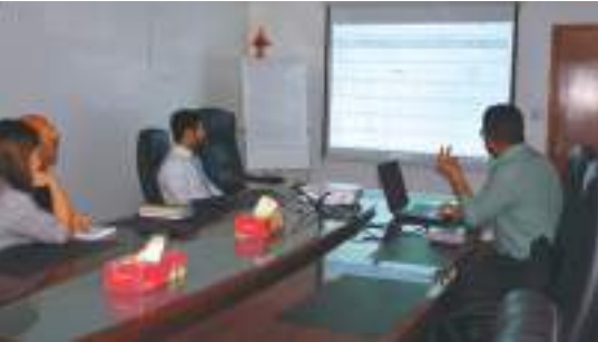
Training at NASS Logistics