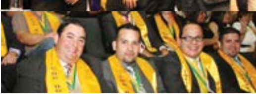
Durante la ceremonia de la Noche de Logros