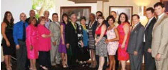
Miembros de la Junta Directiva de la Asociación de Graduados, junto a personal directivo de la Inter y los Egresados Distinguidos 2013.