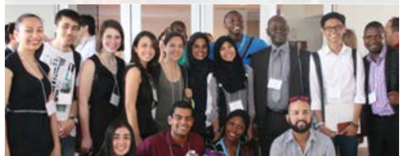
Grupo de participantes de Georgia, Puerto Rico, Malasia, Nigeria, Canadá y Rusia.