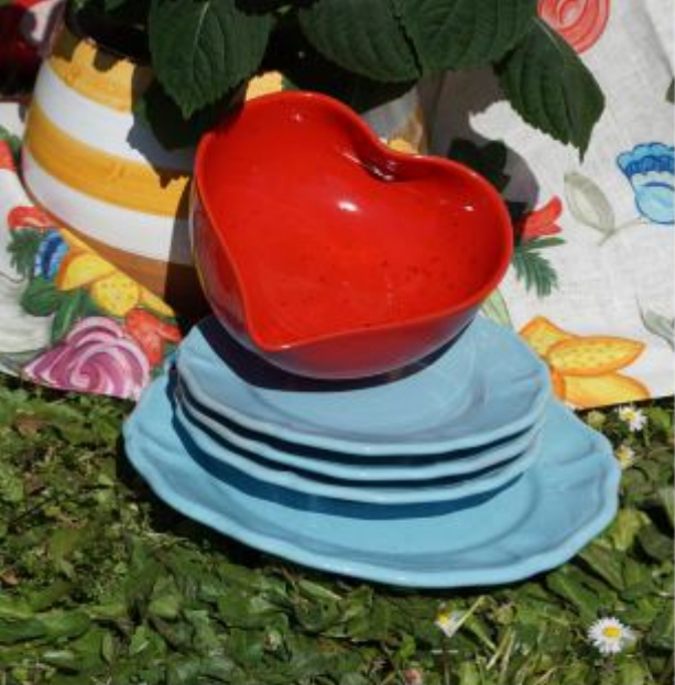
TABLE SETTING LA TAVOLA

Parola d'ordine: romanticismo agreste-chic per un week end in campagna, eccentrico al punto giusto e opportunamente colorato. A dominare sono i toni dell'azzurro e del rosso, che lasciano spazio a nuance intense e luminose del giallo e del verde. Per una scenografia che risponde ai desideri di uno stile classico ma dalla forte personalità.