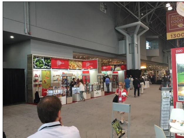
คูหา Pavilion จากประเทศต่างๆ (ต่อ)

Summer Fancy Food Show ในปีนี้มีประเทศตุนีเซียเป็นผู้สนับสนุนร่วม (Country Partner) ในการจัดงาน ใช้พื้นที่ในการจัดงานทั้งหมด 33,700 ตารางเมตร มีบริษัทที่เข้าร่วมแสดงสินค้าจำนวน 2,670 ราย แบ่งเป็นผู้แสดงสินค้าจากสหรัฐอเมริกาจำนวน 1,370 ราย และจากประเทศอื่นๆอีก 1,300 รายจาก 55 ประเทศ โดยประเทศที่เข้าร่วมแสดงสินค้าในรูปแบบ Pavilion ได้แก่ อิตาลี สเปน จีน ฝรั่งเศส แคนาดา ตุรกี ลัตเวีย เนเธอร์แลนด์ เวียดนาม เดนมาร์ก ลิทัวเนีย และไทย ผู้ประกอบการจากไทยที่เข้าร่วมงานมีทั้งหมด 21 บริษัท เป็นบริษัทที่อยู่ภายใต้โครงการ SMEs-ProActive จำนวน 7 ราย (ตั้งเอกสารแนบ) ทั้งนี้มีผู้เข้าร่วมชมงานประมาณ 25,000 ราย จากกลุ่มร้านค้าปลีกสินค้าอาหารเฉพาะทาง (Specialty Retailing) ร้านอาหาร และ Food Service ซึ่งมีผู้ซื้อรายสำคัญ ได้แก่ Whole Foods, Kroger, Formaggio Kitchen, Starbucks, Trader Joe's, UNFI, KeHE, Dean & DeLuca, Barnes & Noble College, Zingerman's, Marriott, และอื่นๆ