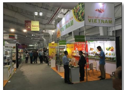
คูหา Pavilion จากประเทศต่างๆ