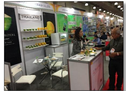
คูหาผู้ประกอบการจากไทย

นอกจากนี้ ภายในงานยังมีกิจกรรมและงานแสดงสินค้าพิเศษต่างๆอีกมากมาย อาทิ