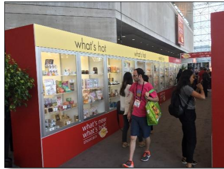
Showcases และกิจกรรมอื่นๆ