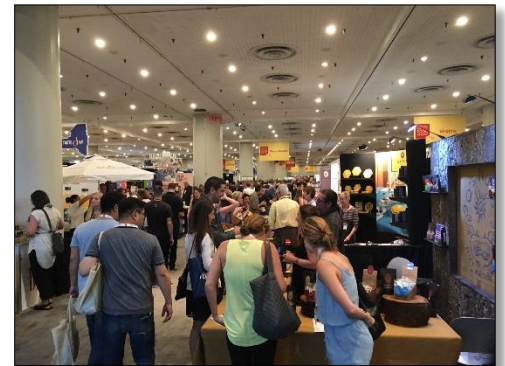
บรรยากาศทั่วไปภายในงาน