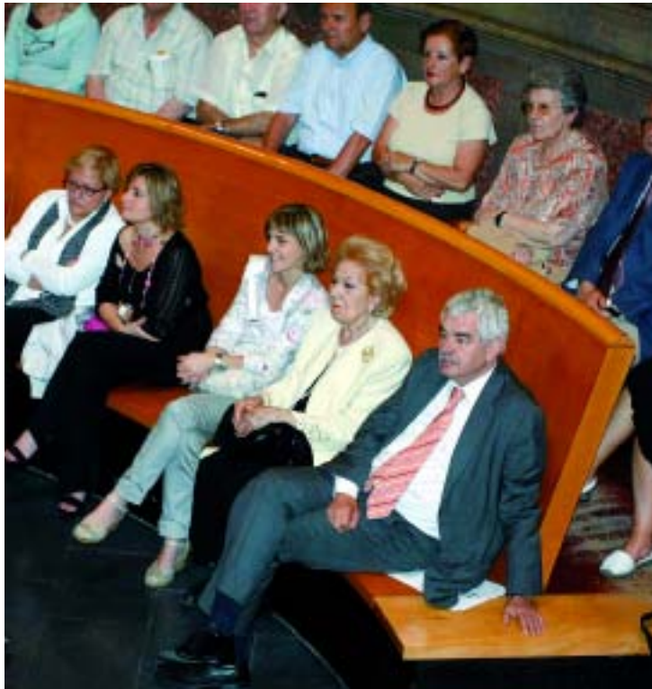
L'expresident Pasqual Maragall va assistir a l'homenatge.