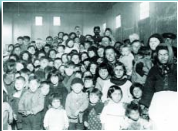
Veïns refugiats en un magatzem de ferrocarril, després del temporal de 1932.

Si té fotografies o documents del seu barri, en pot fer donació a l'Arxiu Municipal del Districte, 93 221 94 44