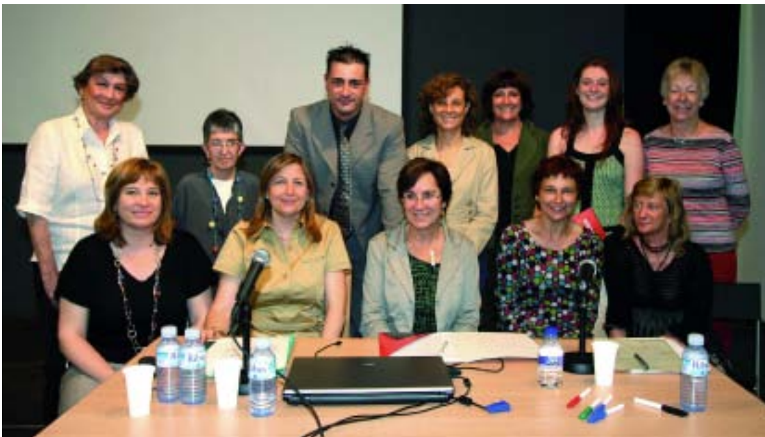
Alguns dels participants a les jornades.

A Sant Martí s'han organitzat dues jornades per millorar la formació i coordinació dels professionals que atenen persones maltractades. El coneixement i el treball en equip són fonamentals per actuar amb eficàcia