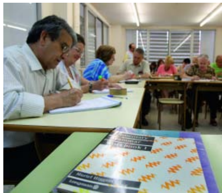
Alumnes de l'escola d'adults La Pau.

García opina que la formació d'adults continua sent la gran desconeguda de l'ensenyament públic. I explica que la funció d'aquest sector educatiu és facilitar "que les perso-