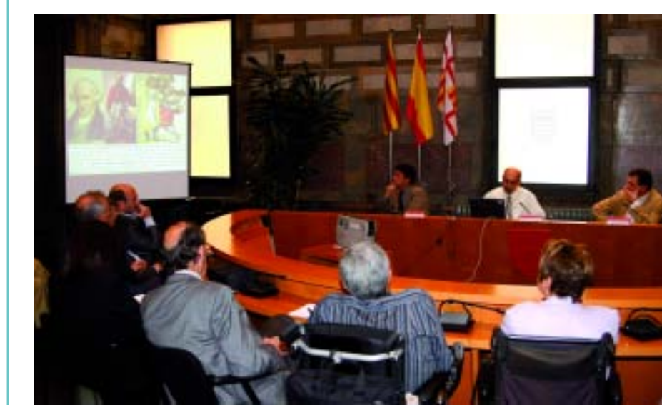
Un moment de l'acte.