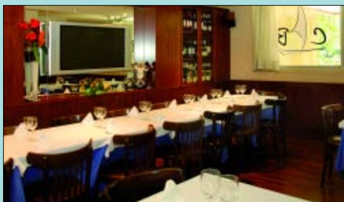
El menjador de Cala Blanca.