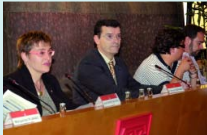
Un moment del Ple del dia 4 de juny.

L es obres que s'estan fent al districte avancen segons els terminis previstos, segons es va informar en la darrera sessió plenària celebrada el passat 4 de juny. Aquest és el cas de la rehabilitació integral del contenidor cultural de Can Saladrigas i del casal infantil de la Via Trajana. D'altra banda, l'arranjament de l'espai viari interior del sud-oest del Besòs-fase III ja està pràcticament finalitzat, així com la urbanització del carrer Lull-fase III, entre Joan d'Àustria i Badajoz, que ja és obert al trànsit. Es va destacar la importància de les obres de rehabilitació i obertura del carrer Pallars, entre rambla de Poblenou i Badajoz, que ja han finalitzat. Aquest és el cas també de la urbanització del carrer Veneçuela, entre Puigcerdà i Maresme. D'altra banda, a les obres del carrer Badajoz, entre Pallars i Ramon Turró, s'està procedint a l'asfaltat entre Lull i Pallars. Així mateix, avancen al ritme previst les obres d'ur-