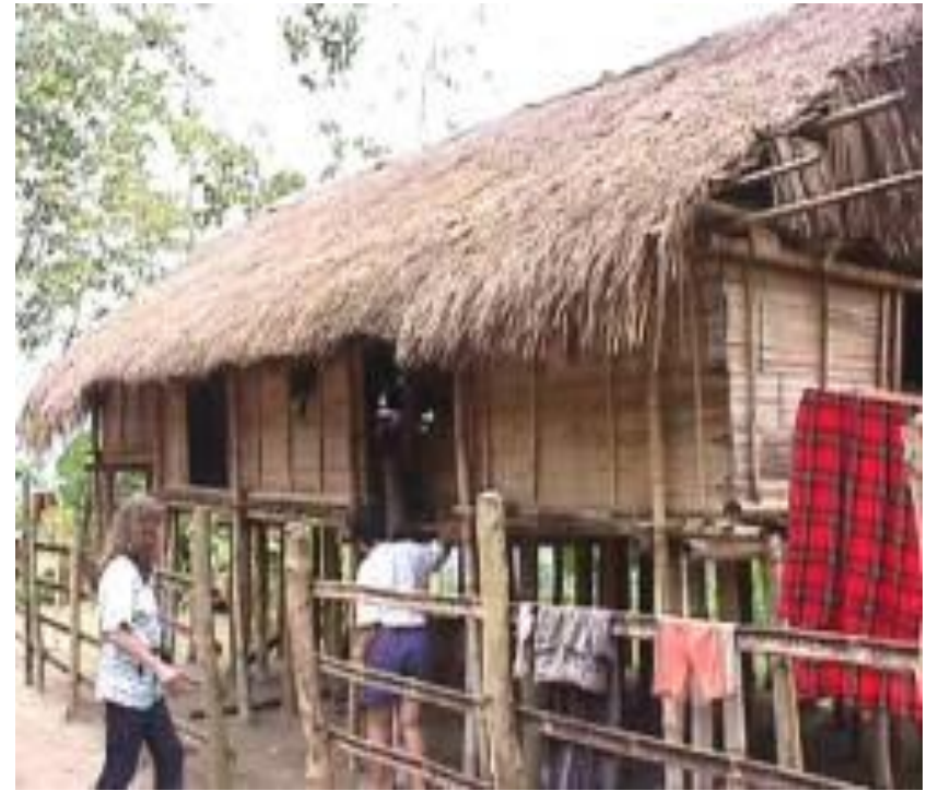
Gunu Bung – uri ng bahay na may dalawang palapag

*Ang anyo ng mga bahay ng T'boli ay nag-iiba batay sa katayuan nila sa lipunan - ang sukat ng bahay nila ay katumbas ng sukat ng kanilang kayamanan.